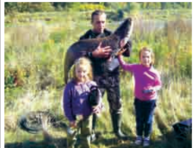
Zwycięski łowca z pokonanym sumem i młodymi adeptkami sztuki wędkarskiej.

Piękne puchary i statuetki, piękna Odra, niezłe wyniki i świetna (jak to w Malczycach bywa) atmosfera - podsumowanie się udało.