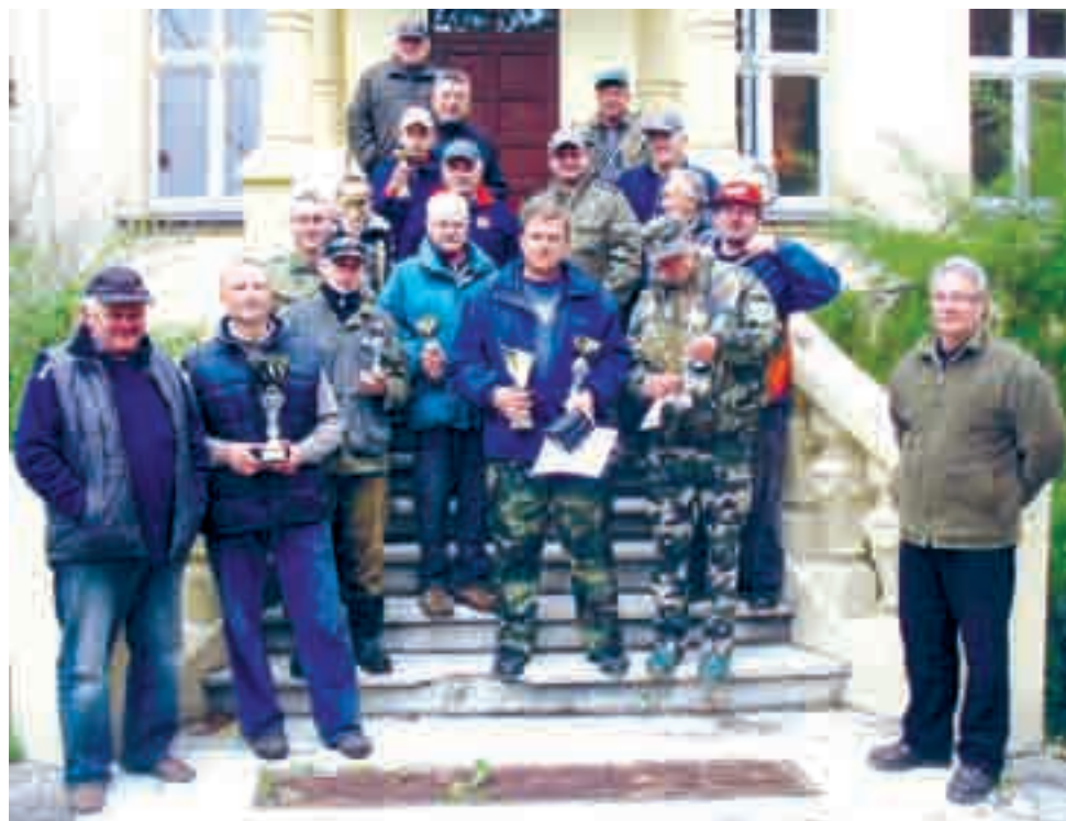
Pamiętkowe zdjęcie na finał sezonu.