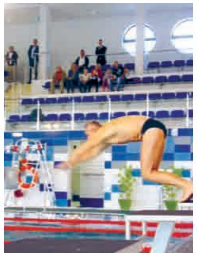
Olimpijska Sztafeta Pokoju.

Bieżące informacje o ofercie, promocjach i innych ciekawych wydarzeniach już niedługo znaleźć będzie można stronie internetowej www.sredzkiparkwodny.pl . Zapraszamy