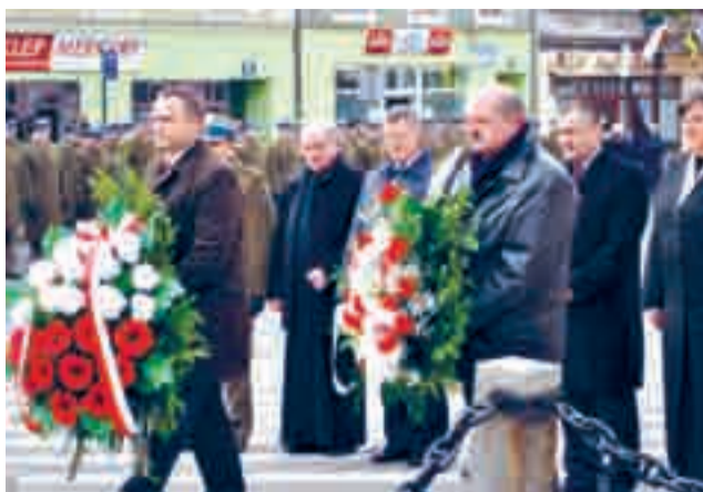
Wieniec złożyli przedstawiciele lokalnych władz, służb mundurowych oraz duchowieństwa

Druga część obchodów, odbyła się pod pomnikiem Żołnie-