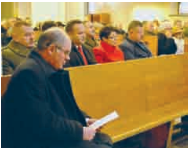
Częścią obchodów było wspólne śpiewanie