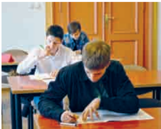
Testy dokładnie weryfikują wiedzę uczniów

Tegoroczne, powiatowe eliminacje rozpoczęły się 14 listopada. Dwunastu uczniów klas IV – VI szkół podstawowych wzięło udział w zorganizowanym w starostwie konkursie „zDolny Ślązaczek”. Dzień później w Poradni Psychologiczno-Pedagogicznej odbył się blok matematyczno-fizyczny „zDolny Ślązak Gimna-