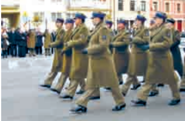
Przemarsz 10. Wrocławskiego Pułku Dowodzenia

1. Batalionowi Dowodzenia podjął w maju br. Minister Obrony Narodowej. Określenie to ma podkreślić więzi łączące wrocławskich żołnierzy z mieszkańcami miasta.