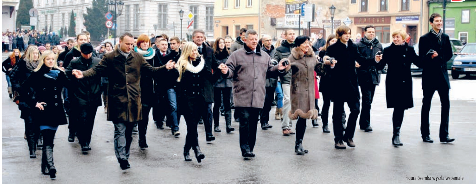
Figura ósemka wyszła wspaniale