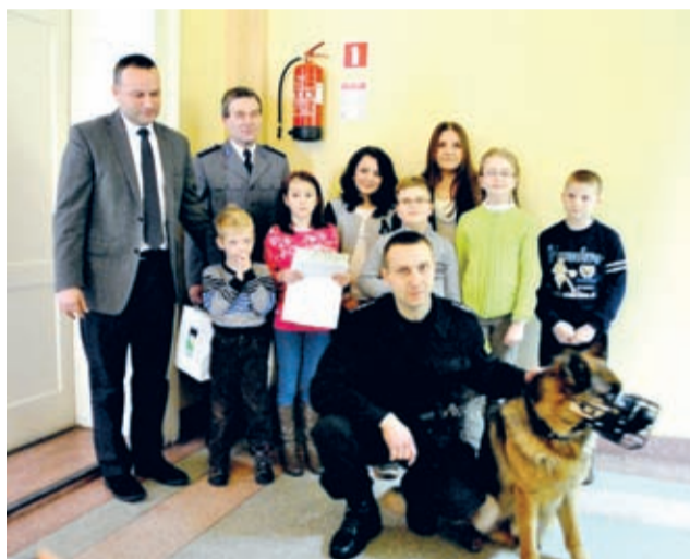
Kumpla Badię obfotografowano jak celebrytę

sprawcy całego zamieszania. Kumpel Badi chętnie pozował do zdjęć, a jego opiekun odpowiadał na pytania zebranych. Dzieci dowiedziały się m.in., że ma 3 lata, szkolenie zaliczył na piątki i czwórki, za osiem lat przejdzie na emeryturę, był już na patrolach,