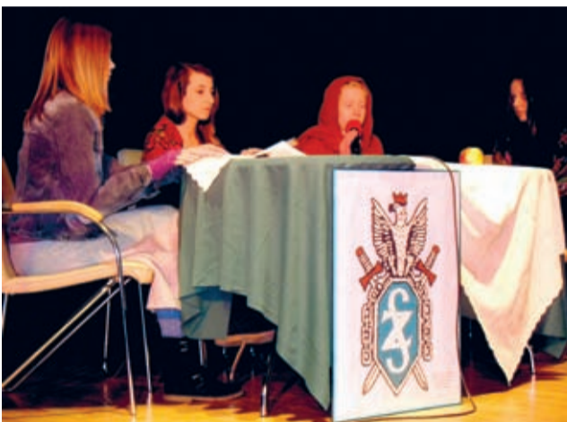
Młodzież ze średzkiego gimnazjum – jak zwykle niezawodna.

poświęcono tablicę upamiętniającą zesłańców Sybiru.