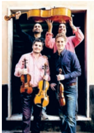
Kwartet smyczkowy Quartetto di Cremona.

Koncert „Viaggio in Italia” („Podróż do Włoch”) w wykonaniu włoskiego kwartetu smyczkowego Quartetto di Cremona wzbudził ogromny entuzjazm zgromadzonych, którzy swój podziw dla wirtuozerii grających wyrazili owacjami i gromkimi brawami. Kameralny koncert był niezapomnianą chwilą wytchnienia i ucieczką od codzienności.