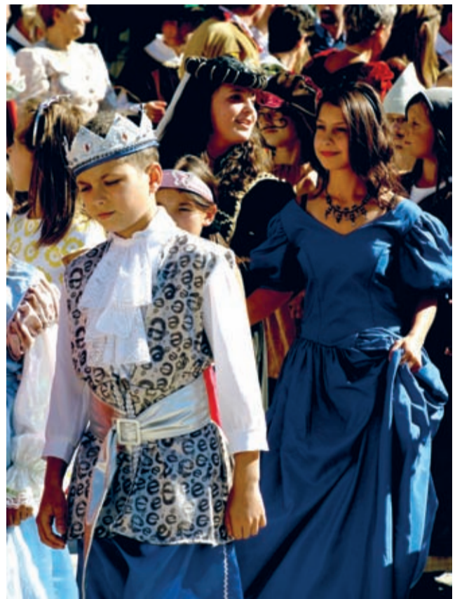
Kolorowo i radośnie – jak zawsze.