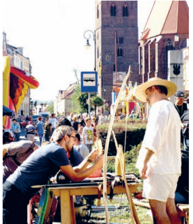
Pokazy dawnych rzemiosł, także wojennych – jak zwykle ciekawe.