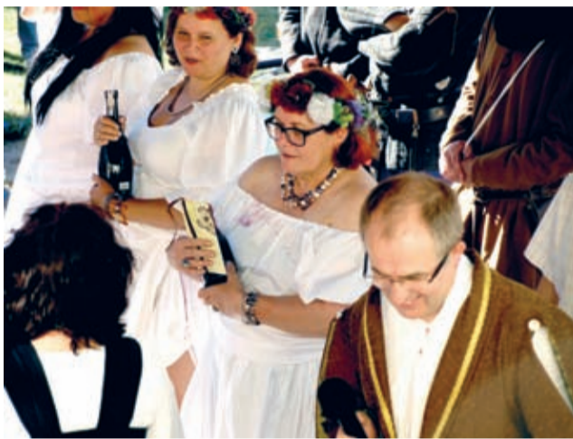
Wybory Miss Winnego Grona.