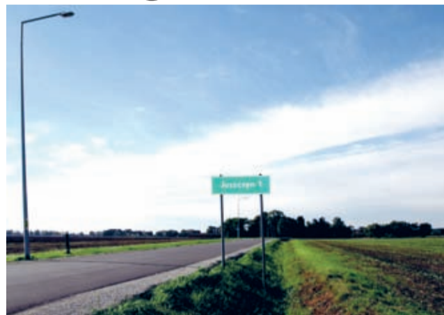
Droga 94 – Juszczyzna: 630 mb nowej nawierzchni, a wzdłuż całej długości (po stronie z oświetleniem) nowy chodnik.

W ramach przeprowadzonej inwestycji, na odcinku 630 mb, nawierzchnia drogi została przebudowana, a wzdłuż całej jej długości wykonano nowy chodnik. Ponadto w miejscach, gdzie jezdni była zbyt wąska, co znac-