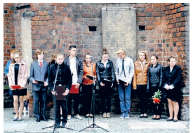
Młodzież z ZS Rakoszyce.