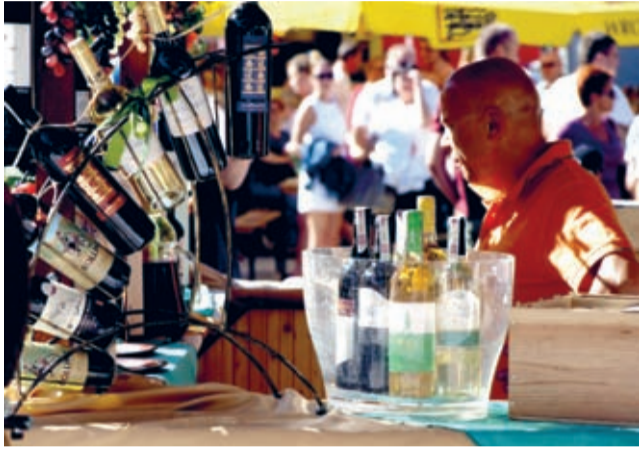
Wino na Święcie Wina.

Święto Wina w Mieście Skarbów już za nami. A szkoda, bo jak co roku było wiele atrakcji, którym towarzyszyła piękna słoneczna aura. Tegoroczna, 9 – ta już edycja imprezy, zorganizowana została nietypowo w sobotę ze względu na przypadające w niedzielę Dożynki Wojewódzkie organizowane na terenie naszej gminy, w Juszczyźnie.