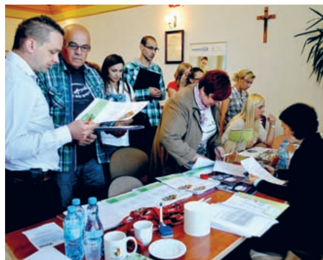
Stoisko BASF Polska cieszyło się dużym zainteresowaniem

Tym razem z zaproszenia do udziału w targach skorzystało sie-