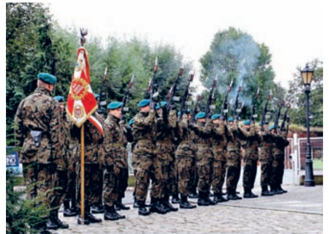
10 Wrocławski Pułk Dowodzenia – salwa honorowa.