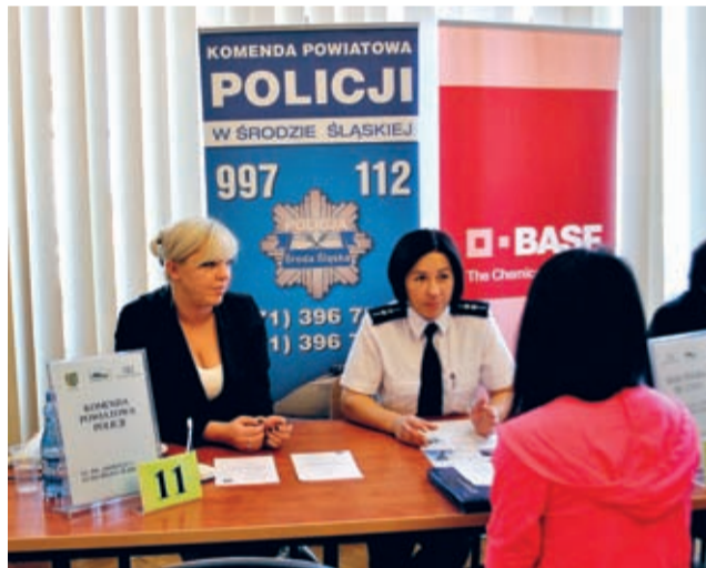
Średzka Komenda Policji jest na każdych targach