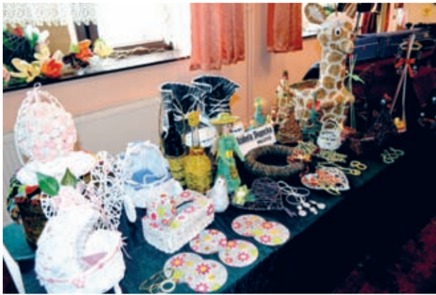
W zaciszu swoich domów lokalny wystawca miodu, który

Nikt nie spodziewał się, że w gminie Malczyce jest tylu uzdolnionych i ciekawych artystów amatorów.