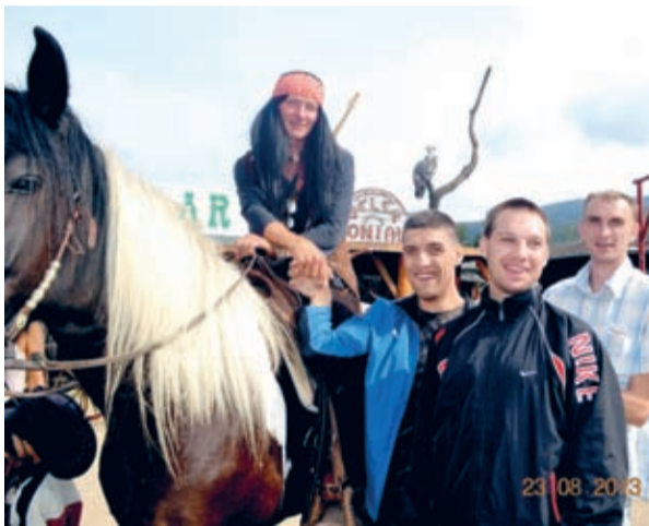
Projekt „Szczęśliwi, bo razem” zakończy się w grudniu br. (opr. ers)