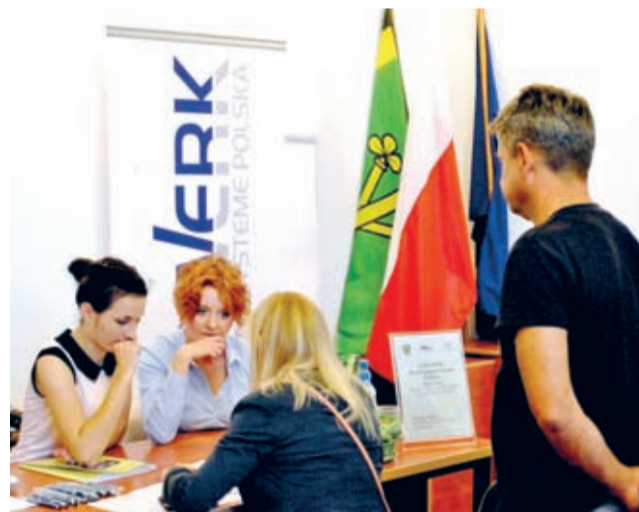
Targi odwiedziło kilkaset osób