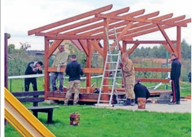
Prace wykonywali mieszkańcy-wolontariusze

Zrealizowany projekt w dużym stopniu przyczynił się do poprawy wizerunku i estetyki wsi Słup, a dzięki jego realizacji mieszkańcy zyskali nowe miejsce wspólnych spotkań. (Karolina Ożóg)