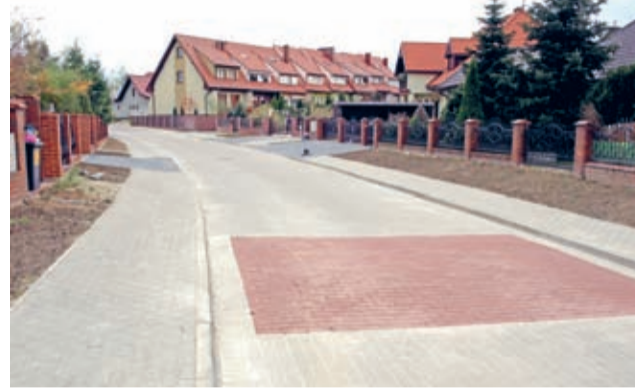
Ulica Floriańska ma nową nawierzchnię i obustronny chodnik.

- Na obu ulicach wykonano z betonowej kostki łącznie ponad trzy tysiące metrów kwadratowych drogi wraz z chodnikiem, na nowej podbudowie i z nowymi krawężnikami – wyli-