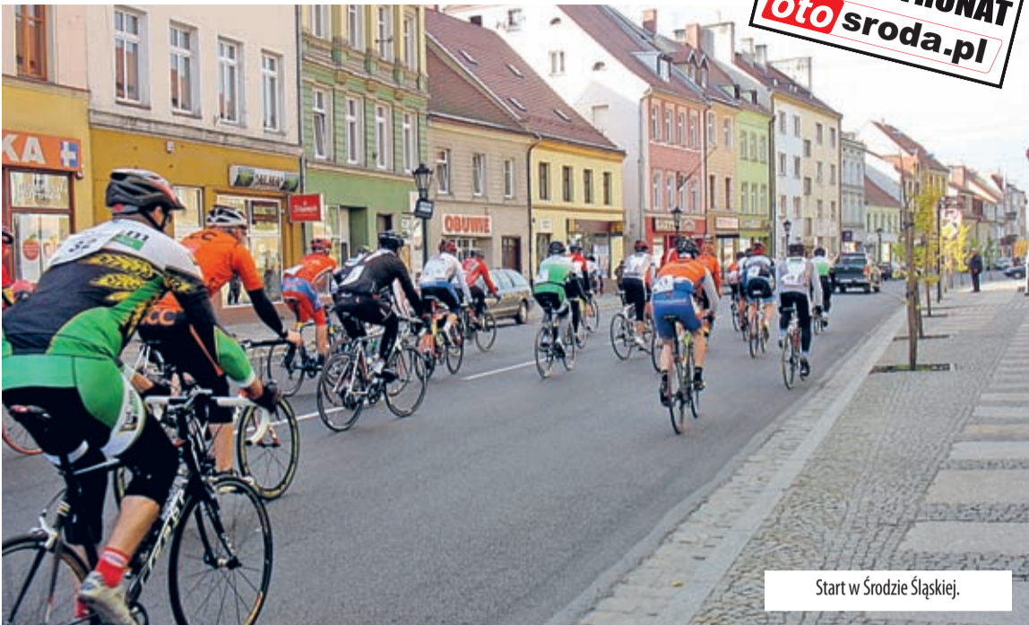
Start w Środzie Śląskiej.

kowo motywuje organizatorów. Nieoficjalnie mówi się, że przygotowania do III wyścigu już się rozpoczęły. Dlatego teraz dziękujemy wszystkim, którzy pojechali w niedzielę i zapraszamy już za niecały rok.