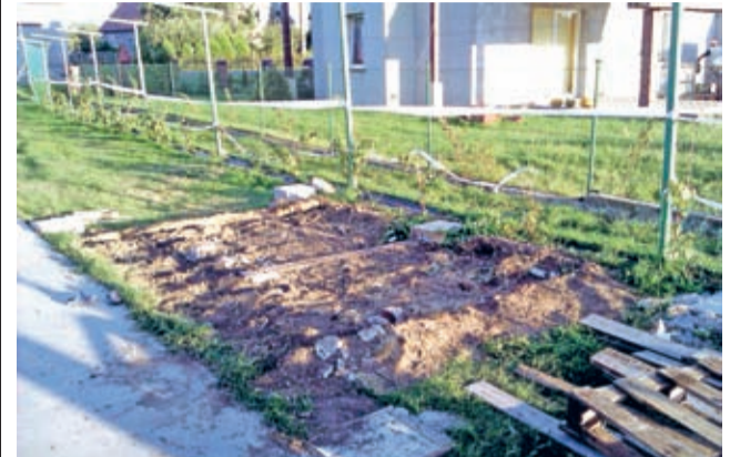
Mała architektura – początek.

Stowarzyszenie na rzecz rozwoju wsi Słup zrealizowało kolejny projekt z programu „Działaj lokalnie” Polsko Amerykańskiej Fundacji Wolności ogłoszony przez Stowarzyszenie Lokalna Grupa Działania Kraina Łęgów Odrzańskich.