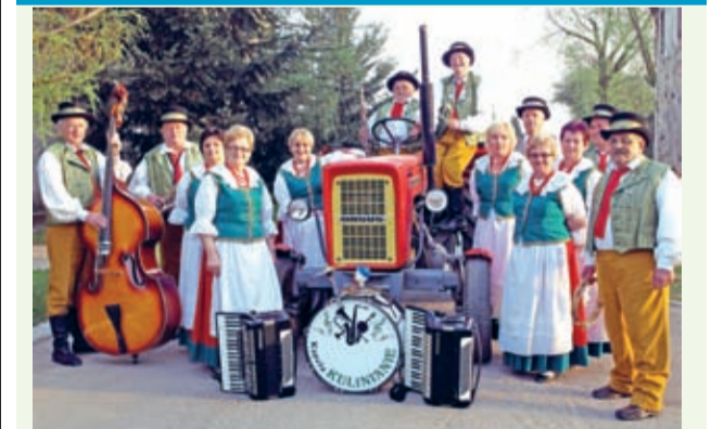
Kulinianie na foto-sesji na potrzeby płyty „Jedzie traktor z pola”

Kapela ludowa Kulinianie czynnie uczestniczy – w ścisłej czołówce – w jesiennej edycji Listy Przebojów Ludowych Radia Wrocław.