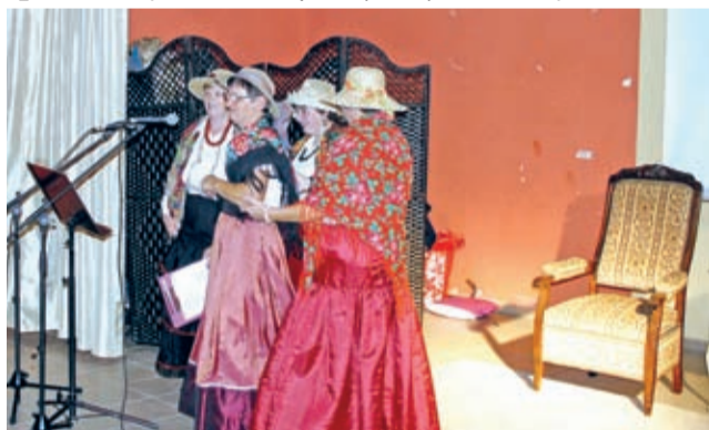
„Jastrzębianki” w wersji kabaretowej.

Skoro jesień nie musi być smutna, to jesień życia tym bardziej. Dowiedli tego seniorzy z Jugowca, Środy Śląskiej, Przedmościa, Bukówka i Jastrzębiec. Z okazji swojego święta w bardzo licznym gronie spotkali się w świetlicy wiejskiej w Jastrzębcach.