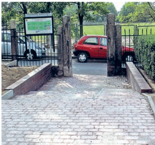
Przebudowane wejście na cmentarz od ul. Górnej.