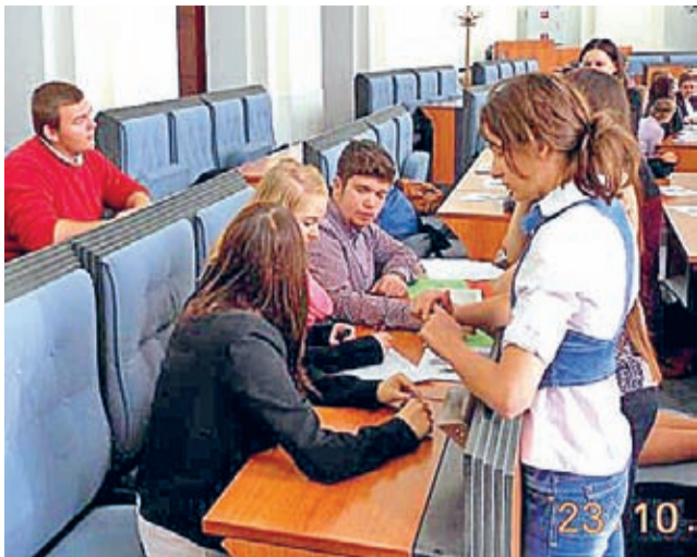
Uczniowie najpierw obejrze-

Wyjazd odbył się w ramach jednego z projektów realizowanych przez Stowarzyszenie Semper Avanti z Wrocławia. To samo, które organizuje Młodzieżowy Sejmik Województwa Dolnośląskiego.