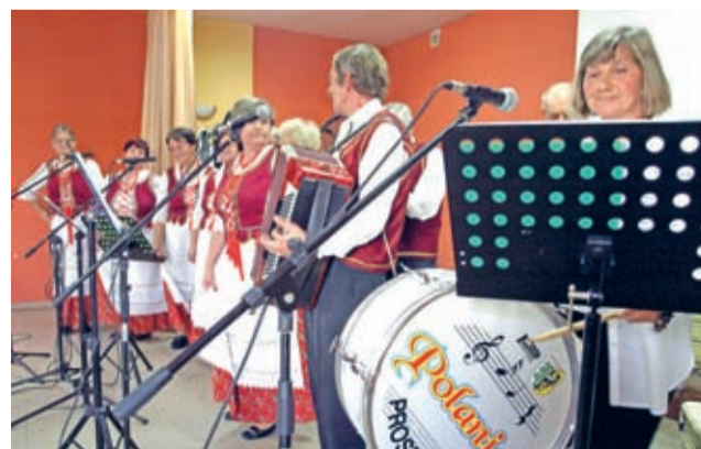
„Polanie” z Proszkowa - ciężka praca się opłaca, a trening czyni mistrza.