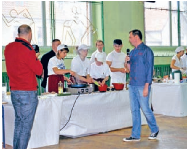
Gotowanie młodych kucharzy zakończyło się degustacją...