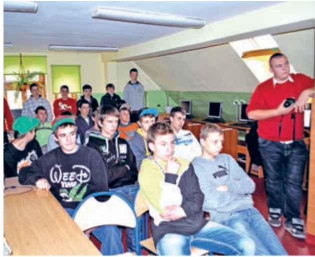
Najwięcej do opowiedzenia o szkole mają jej uczniowie...

Inne zajęcia odbywały się na terenie szkoły. Sympatycy motoryzacji mogli sprawdzić się w jeździe sprawnościowej samochodem. Z kolei w budynku szkoły można było wziąć udział w zajęciach z programowania oraz turnieju Colin McRae Rally' 04. Ciekawym pomysłem była prezentacja multimedialna na temat szkoły. Uczniowie zespołu najpierw przybliżyli swoją szkołę, a później odpowiadali na pytania młodszych kolegów. Gimnazjalistom udostępniono również warsztaty szkolne, gdzie mogli zobaczyć jak pracują maszyny do obróbki precyzyjnej.