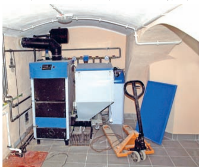
„Centrum ogrzewania” – wspólne dla lokali socjalnych i biblioteki.

szu Dopłat. Na utworzenie filii BP otrzymano 104 745 zł z Programu Rozwoju Obszarów Wiejskich. Całkowity koszt trwającej blisko rok inwestycji to blisko 1 200 000 zł. (prg)