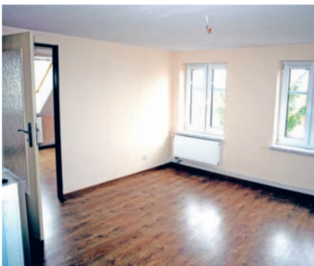
Jeden z dziewięciu lokali socjalnych w budynku byłej SP w Krynicznie.