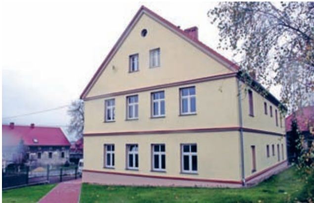
„Utworzenie lokali socjalnych po byłej szkole podstawowej w Krynicznie” - jedno z większych w tym roku zadań gminy Środa Śląska.

Sam budynek cieszy nie tylko wizualnie. Pod nową elewacją i dachem kryją się wzmocnione i zaimpregnowane drewniane belki stropowe, kondygnacje z nową izolacją termiczną. Budynek ma wzmocnione fundamenty, nową wewnętrzną instalację elektryczną, instalacje CO, kanalizacyjną i deszczową, nowe przyłącza, a wnętrza wykończone są w tzw. systemie kartonowo-gipsowym.