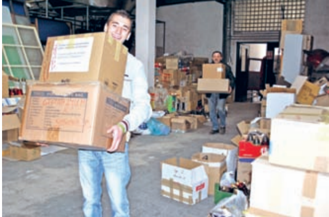
W transporcie pomogli uczniowie PZSP nr 2 oraz służba drogowa

mu Zespół Obsługi Placówek Oświatowych w Środzie Śl. Znicze zbierano w przedszkolach