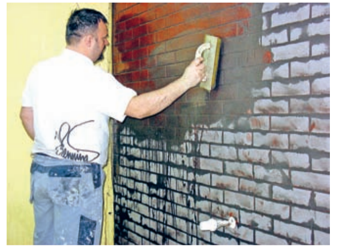
Prace remontowo-budowlane w czytelnicy BP

Trwa realizacja zadania Modernizacja Biblioteki Publicznej w Środzie Śląskiej w ramach Programu Wieloletniego Kultura+, Priorytet „Biblioteka+. Infrastruktura bibliotek.”