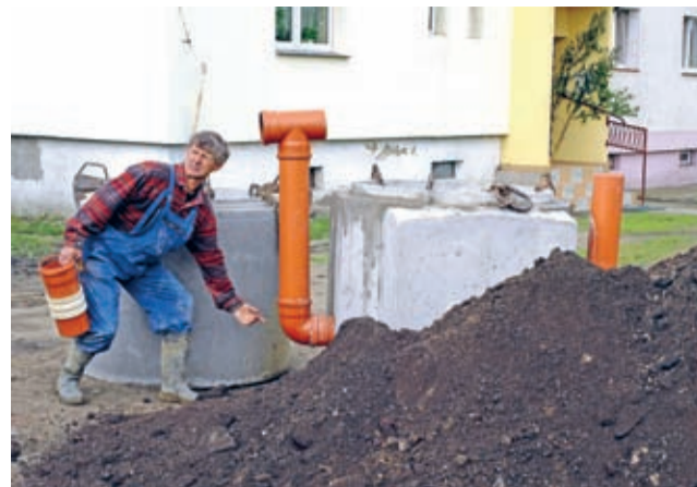
Jastrzębce - odbiory końcowe właśnie tam trwają (fot. z etapu prac ziemnych).

Na zakończenie przedstawiamy krótką historię kanalizacji gminy Środa Śląska. W roku 2010 stan skanalizowania gminy obliczany na podstawie ilości mieszkańców gminy przyłączonych do sieci kanalizacyjnej wyniósł około 63%.