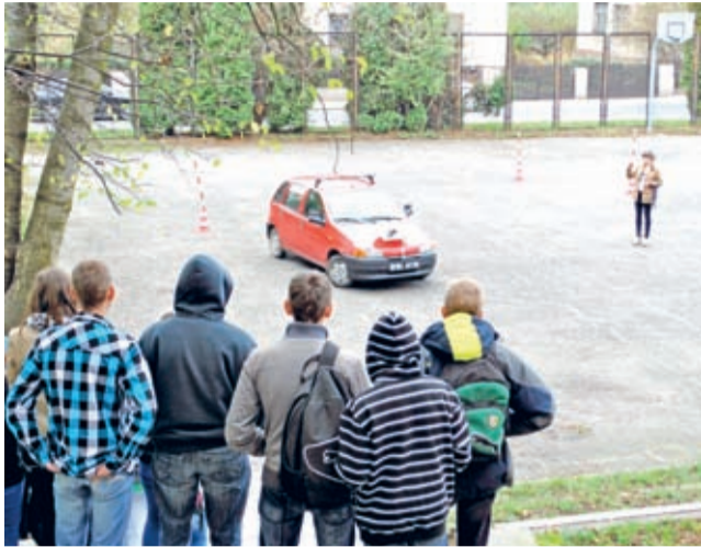
Konkurs bezpiecznej jazdy

Bardzo ciekawie wypadł Dzień Otwarty zorganizowany w Powiatowym Zespole Szkół Ponadgimnazjalnych nr 2 w Środzie Śląskiej.