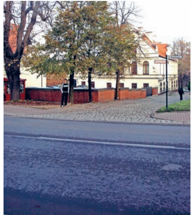
Kanalizacja na odcinku ul. Wrocławskiej sąsiadującym z nieruchomością zajmowaną przez tutejszą prokuraturę – temat doczekał się zadowalającego dla wszystkich rozwiązania.

Podobnie jak przy okazji sesji samorządu powiatowego, także na sesji gminnej przedstawiciele Młodzieżowej Rady Powiatu sprzedawali domowe ciasta-cegiełki. W ramach akcji „Adopcja na odległość” młodzieżowi radni kolejny rok wspierają jedną ze szkół na Madagaskarze. W średzkim magistracie udało im się zebrać kwotę 208 zł. (prg)