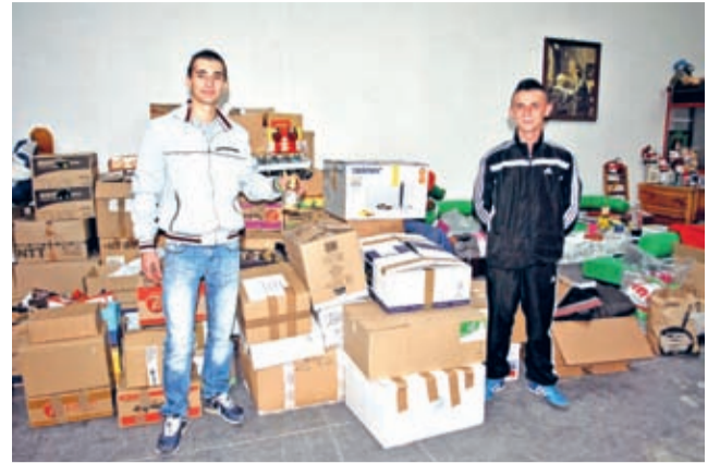
Każdy znicz to dowód naszej pamięci o naszych rodakach

szkołach oraz średzkim starostwie. Mimo, że akcja trwała tylko tydzień udało się zebrać ponad 2 tys. zniczy! Lublin, którym zawieziono je do Wrocławia był załadowany po dach. – To jak dotychczas największa dostawa – stwierdzono w TVP Wrocław.