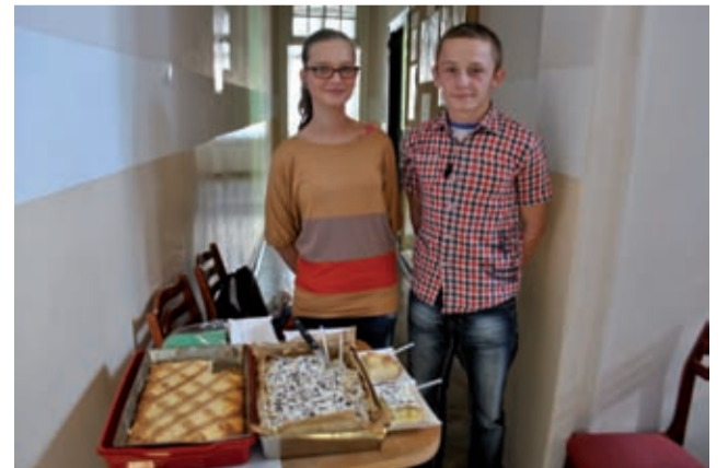
Młodzi radni z PZSP nr 2.

Ciasta sprzedawano podczas przerw w obradach rady powiatu oraz rady miejskiej. Dzięki hojności radnych i innych uczestników sesji udało się zebrać 554 zł. Środki te zostaną przeznaczone m.in. na akcję „Adopcja na odległość”, której celem jest pomoc dzieciom z miejscowości Manazary na Madagaskarze. - Domowe ciasta umiliły obrady, a nam pomogły w zebraniu