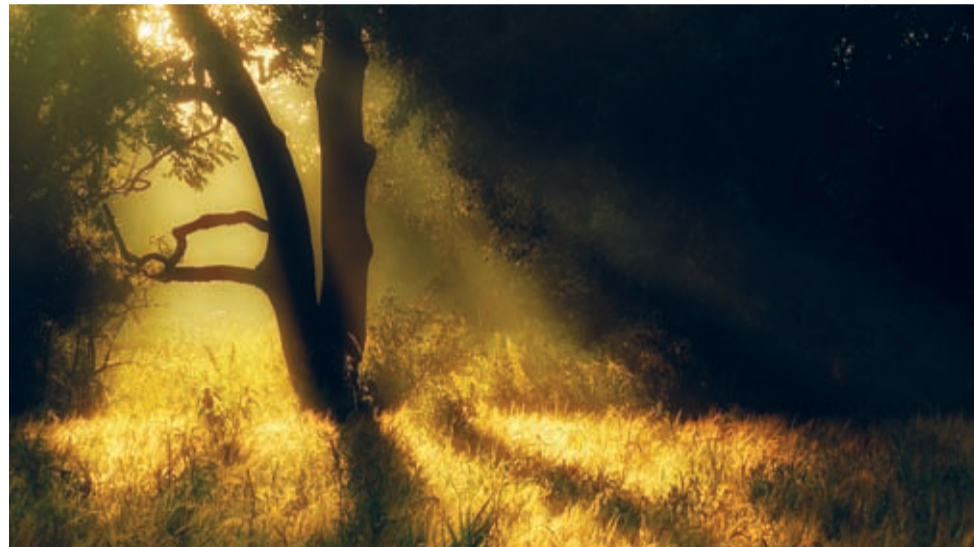
Krzysztof Bednarczyk „W lesie”