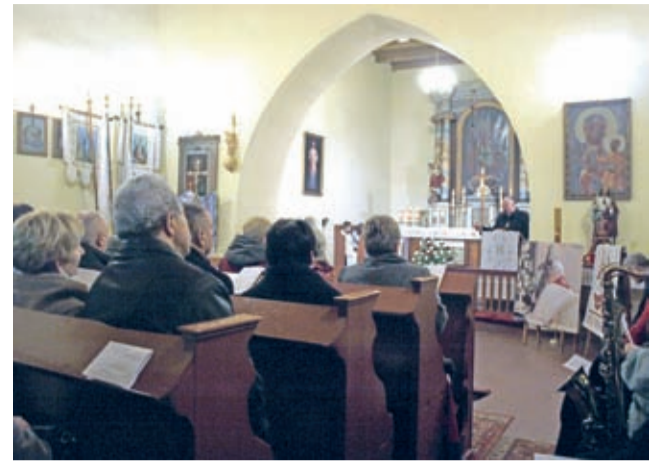
Bogu dziękowano w kościele...

– Normalnie, firma, której zleceno by wykonanie wszystkich prac wystawiłaby rachunek na przynajmniej 100 tys. zł. Dzięki pieniądзом z „Aktywnych...”, dzięki sponsorom i samym