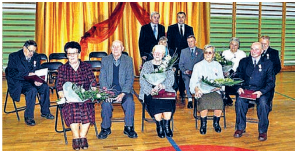
Jubileusz Par Matżeńskich - Lutynia