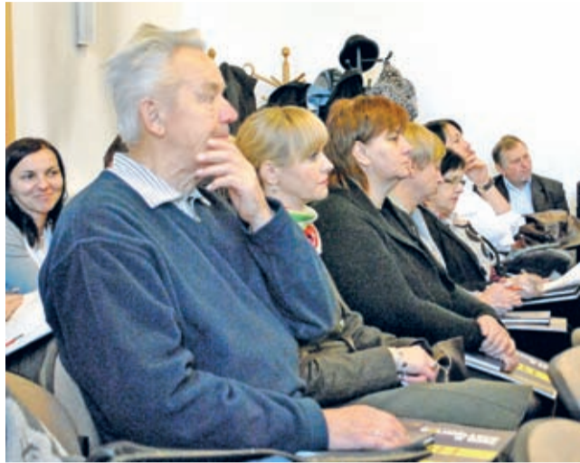
Powiat Średzki podobnie, jak wiele innych, dolnośląskich samorządów, skorzystał w ostatnich latach na dofinansowaniach ze