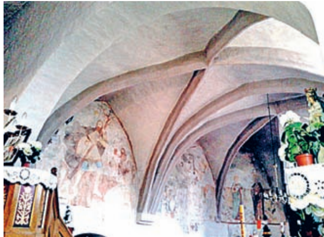
Malowidła na sklepieniu

W powiecie średzkim w ostatnim czasie zrealizowano kilka tego typu prac, na przykład w Osieku, Wichrowie, czy też w Wilkowie Średzkim. I to właśnie w tej ostatniej miejscowości doszło do odkrycia fragmentu