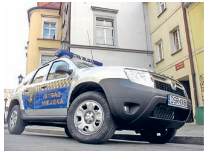
DD – w barwa średzkiej straży miejskiej.

I stało się. Wysłuzony, znający chyba wszystkie drogi i bezdroża gminy, citroen berlingo, po blisko siedmiu latach intensywnej służby w barwach straży miejskiej przeszedł na zasłużony wypoczynek.