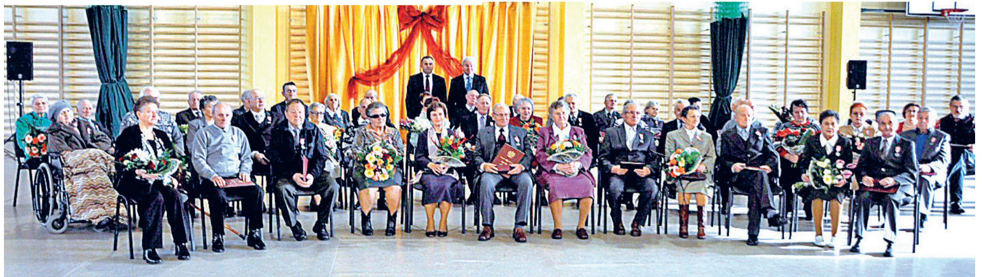
Jubileusz Par Matżeńskich - Miękinia

Złotym Jubilatam jeszcze raz składamy najserdeczniejsze gratulacje oraz życzenia wszelkiej pomyślności, zdrowia i szczęścia na dalsze lata życia!