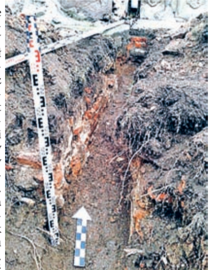
Wykop pod rurę odprowadzającą wodę z widokiem na fragment odkrytego grobowca

Kościół w Wilkowie Średzkim jest budowlą bardzo urokliwą. W dużej mierze zachował on typową, średniowieczną bryłę. Oprócz wspomnianych płyt nagrobnych, ciekawe jest jego wewnętrzne wyposażenie, między innymi gotycka herma Madonny z Dzieciątkiem z połowy XV w. i, również gotycka, drewniana rzeźba św. Anny Samotrzeć z końca XV w. Największe wrażenie robią chyba jednak malowidła na sklepieniu gotyckiego prezbiterium. Warto specjalnie wybrać się na wycieczkę, by na własne oczy zobaczyć tę perełkę.