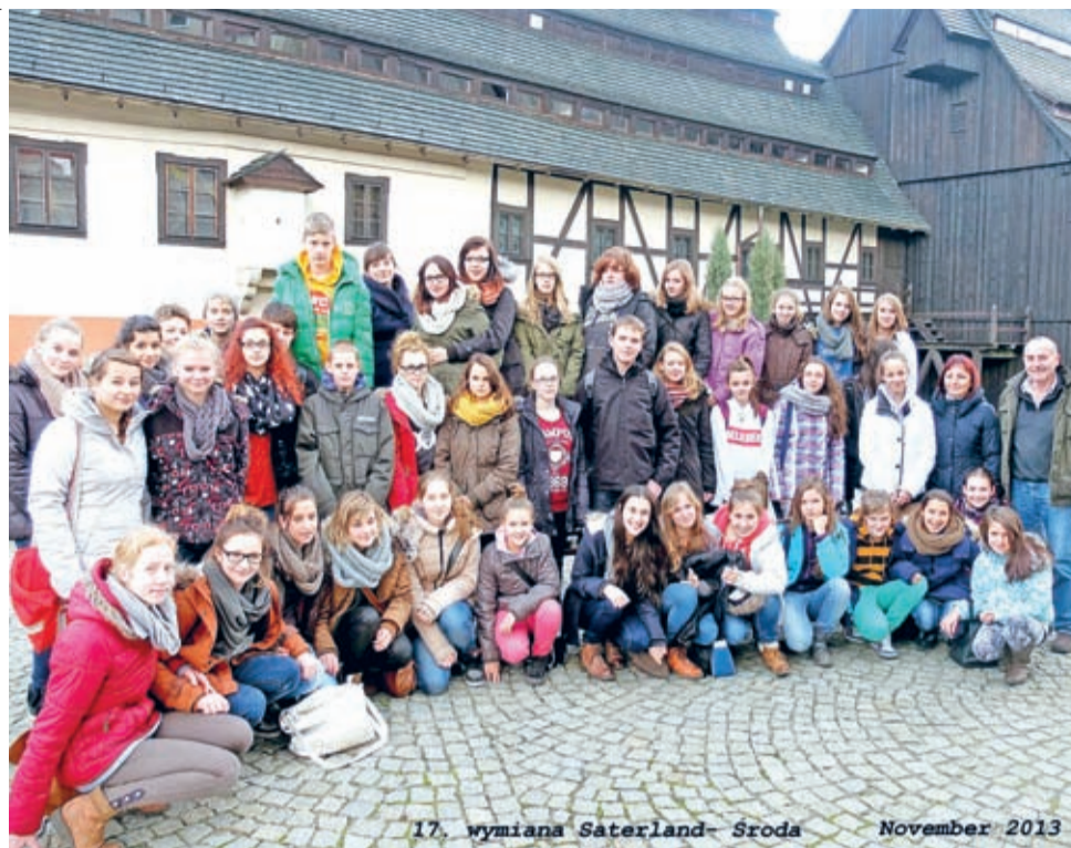
Uczestnicy listopadowej wymiany przed Muzeum Papiernictwa w Dusznikach Zdroju.

Uczestnicy wymiany bardzo chętnie organizowali sobie spotkania w domach, poza programem, gdzie za pomocą języka niemieckiego lub angielskiego starali się od siebie jak najwięcej dowiedzieć i siebie nawzajem jak najlepiej poznać – mówi ko-