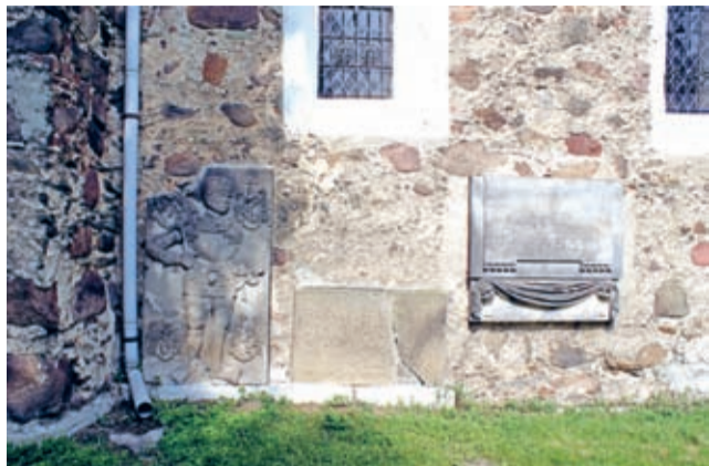
Tablice nagrobne na południowej elewacji kościoła

Współcześnie w Polsce prowadzi się liczne prace konserwatorskie przy niewielkich wiejskich kościołkach. Realizowane są one przez lokalne społeczności, nierzadko przy wsparciu środkami zewnętrznymi.