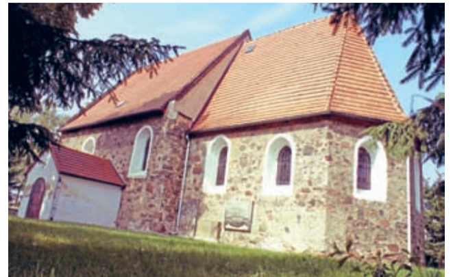
Kościół w Wilkowie Średzkim