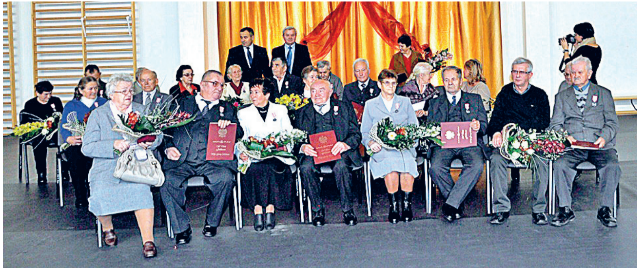
Jubileusz Par Matżeńskich-Pisarzowice