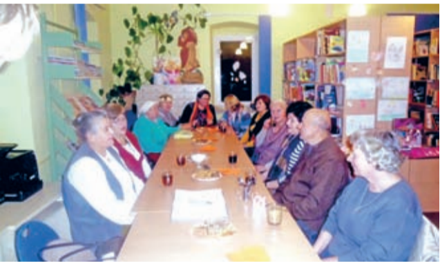
Biblioteczny Dzień Seniora w Ciechowie.

21 listopada w filii średzkiej Biblioteki Publicznej w Ciechowie odbyła się impreza czytelnicza z okazji Dnia Seniora.