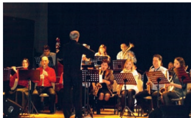
Średzka Orkiestra Dęta.

Z górnego C rozpoczęła Średzka Orkiestra Dęta działająca przy parafii św. Andrzeja Apo-