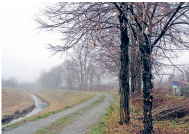
Średzka Woda i droga wzdłuż średzkich działek – trasa lubiana nie tylko przez działkowców.

łów i śmieci, jakie się tam nagromadziły, usunięto dziko rosnące krzewy i inne sztuczne przegrody powodujące erozję dna i brzegów