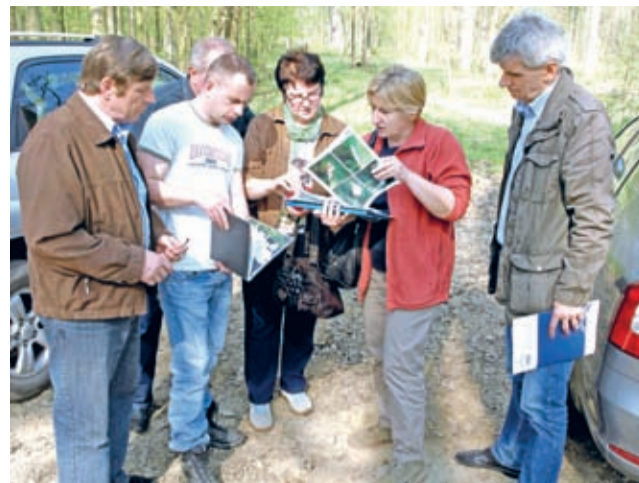
Kolejna kontrola stanu wałów na terenie gminy Środa Śląska z udziałem zainteresowanych stron - średzkiego samorządu, UMWD i DZMiUW.

To jednak nie wszystko. Do końca marca br. ma być gotowa dokumentacja projektowa na odwodnienie zawala na podstawie której będą realizowane prace na odcinku od Rzeczycy do Brzegu Dolnego. Ma ona także uwzględ-