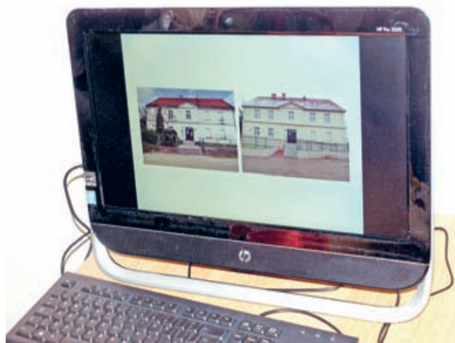
Krynicy „wczoraj i dziś” na nowym sprzęcie w filii BP

do wiedzy, kultury oraz ośrodki życia społecznego, a także wprowadzenie systemu certyfikującego dla bibliotek. (rw/bp)