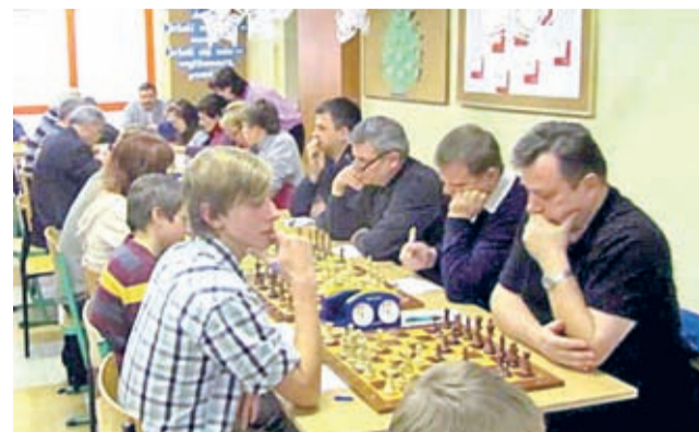
Średzianie w drodze na pozycje piątą.

Pierwszy turniej XI edycji Międzypowiatowej Ligi Szachowej rozegrano 26 stycznia w Żarowie.