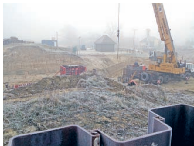
Na placu budowy stopnia wodnego w Rzeczycy.