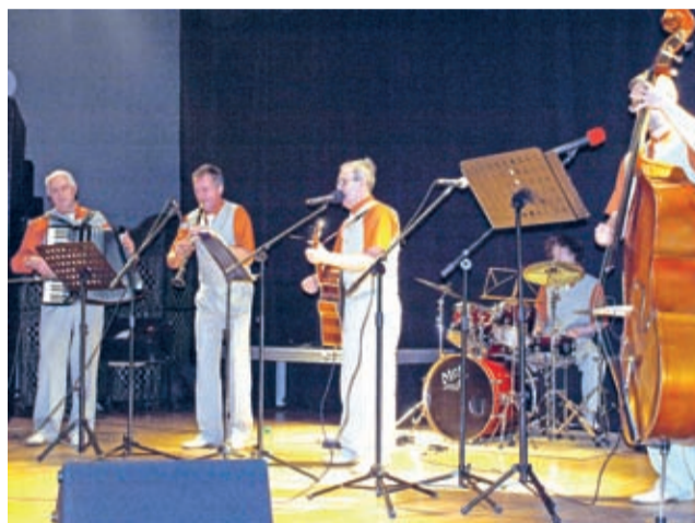
Kapela Podwórkowa BIESIADNI.