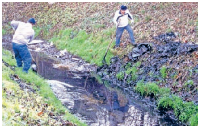
Prace porządkowe na starym korycie „Średzianki”.

Nie czekając na wiosnę kalendarzową i wykorzystując sprzyjającą aurę, Gmina Środa Śląska na przełomie roku 2013 i 2014 przeprowadziła prace porządkowe na rzece Średzka Woda i na jej starym korycie w obrębie miasta.