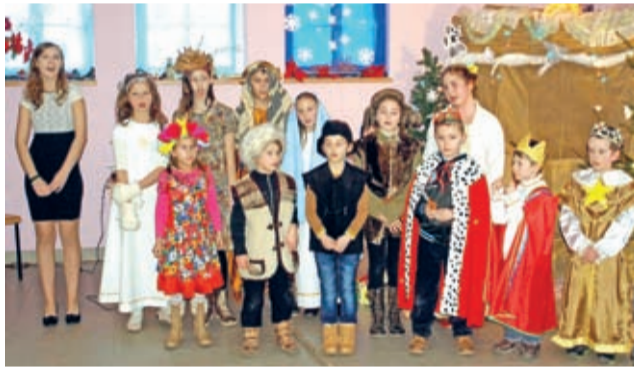
W Brodnie chwile wzruszeń i chwile radości.

A jasełka były rzeczywiście ciekawe. Co ważne szczególnie, powstały z udziałem zarówno dzieci, tych mniejszych i większych, jak i młodzieży, a więc połączyły tym razem młode pokolenia.