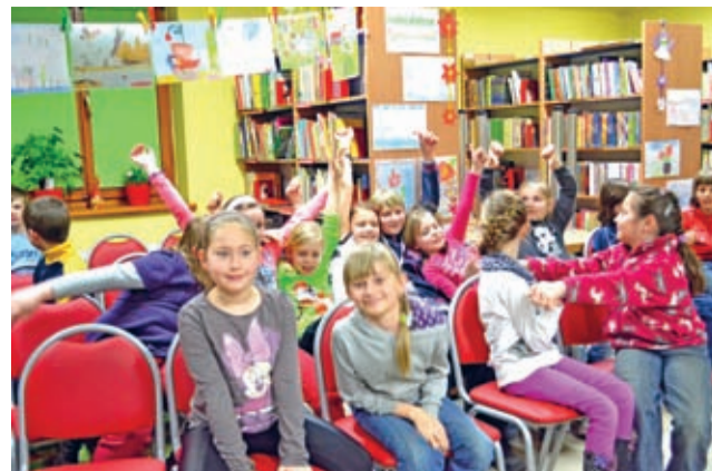
Noc z Andersenem AD 2013.

„Noc z Andersenem” to impreza o charakterze międzynarodowym, zainicjowana przez bibliotekarzy bibliotek czeskich dla wspierania czytelnictwa, propagowania systematycznego czytania i głośnego czytania dzieciom. Nazwa imprezy przypomina o święcie książki dziecięcej, które obchodzone jest na całym