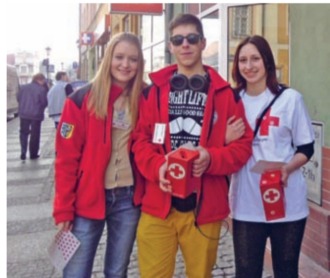
Wolontariusze na ulicach Środy Śląskiej 1 kwietnia.

przeć czerwonokrzką akcją w ten właśnie sposób, może to zrobić jeszcze dzisiaj. Dziękujemy i zapraszamy, bo dobrze jest pomagać. (prg)