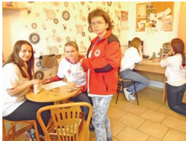
Nie mniej ważna część zbiórki – komisyjne liczenie datków w siedzibie średzkiego PCK.

Jak zawsze przed świętami Polski Czerwony Krzyż prowadzi zbiórki pieniędzy na wsparcie świąt dla osób najbardziej potrzebujących. Oddział Rejonowy PCK w Środzie Śląskiej także czynnie w akcjach tych uczestniczy.