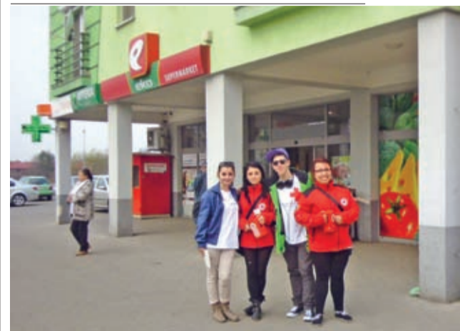
Wolontariusze na ulicach Środy Śląskiej.

Jak zawsze przed świętami Polski Czerwony Krzyż prowadzi zbiórki pieniędzy na wsparcie świąt dla osób najbardziej potrzebujących. Oddział Rejonowy PCK w Środzie Śląskiej także czynnie w akcjach tych uczestniczy.