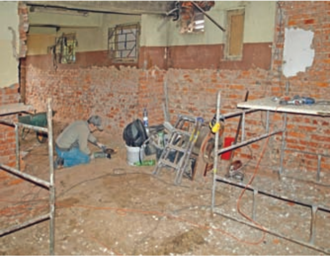
Aktualnie trwają prace w przyziemiu.

Nie jest to pierwszy etap modernizacji stadionowej infrastruktury. Warto przypomnieć, że w 2013 r. w ramach Programu „Dolny Śląsk dla Królowej Sportu” ogłoszonego przez Marszałka Województwa Dolnośląskiego wymieniono starą nawierzchnię bieżni na nawierzchnię tartanową. Natomiast jeszcze w tym roku modernizacja czeka zlokalizowany przy stadionie kort tenisowy. W niedalekiej przyszłości także trybuna wraz zadaszeniem ma się doczekać modernizacji. (prg)