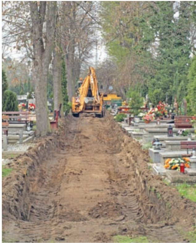
Cięższy sprzęt też się na cmentarzu przydaje.

W ostatnich dniach Gmina Środa Śląska rozpoczęła kolejny etap modernizacji średzkiego cmentarza komunalnego.