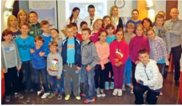
11. Noc z Andersenem w Środzie Śląskiej.

BP po raz jedenasty wzięła udział w akcji „Noc z Andersenem”. Imprezę o charakterze międzynarodowym, zainicjowali czescy bibliotekarze dla wspierania czytelnictwa, propagowania systematycznego czytania i głośnego czytania dzieciom.