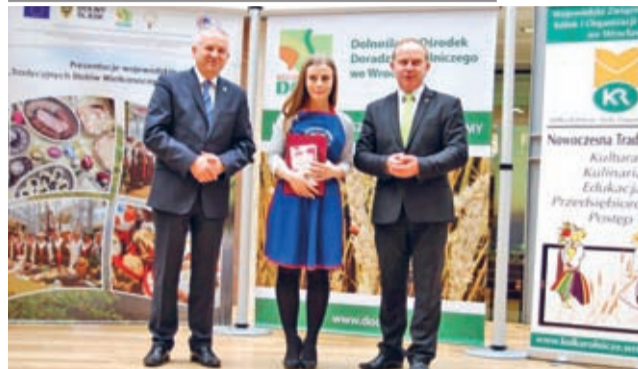
Pasaż Grunwaldzki już po raz trzeci był gospodarzem spotka-

W sobotę poprzedzającą Niedzielę Palmową, w Pasażu Grunwaldzkim można było spróbować tradycyjnych potraw wielkanocnych, zapoznać się z technikami malowania pisanek oraz posłuchać muzyki ludowej.