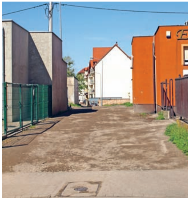
I ta część ul. Białoścórniczej już wkrótce zmieni wygląd i funkcjonalność.

Niedawno rozstrzygnięto natomiast przetargi na budowę dróg transportu rolnego. Te ważne ciągi komunikacyjne mają do maja powstać w Kulinie, Ciechowie i Jastrzębach. Za blisko 500 tys. zł na potrzeby transportu rolnego, przebudowanych zostanie tam łącznie blisko 1000 m dróg. (prg)