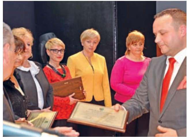
Za 15 lat pracy na rzecz powiatu podziękowano również dyrektorom jednostek organizacyjnych powiatu

– Cieszę się, że tak wiele osób razem z nami świętowało. Sala była pełna, a atmosfera bardzo przyjemna. Będę to interpretował jako dowód sympatii i uznania dla jubilata – podsumował obchody starosta Burdzy.