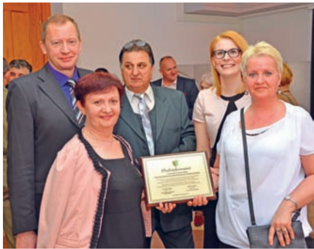
Dyrektor i pracownicy średzkiej placówki opiekuńczo – wychowawczej

W tym roku mija 15 lat od reaktywowania samorządu powiatowego w Polsce. Uroczystość z okazji powstania Powiatu Średzkiego odbyła się 3 kwietnia w Domu Kultury w Środzie Śląskiej.