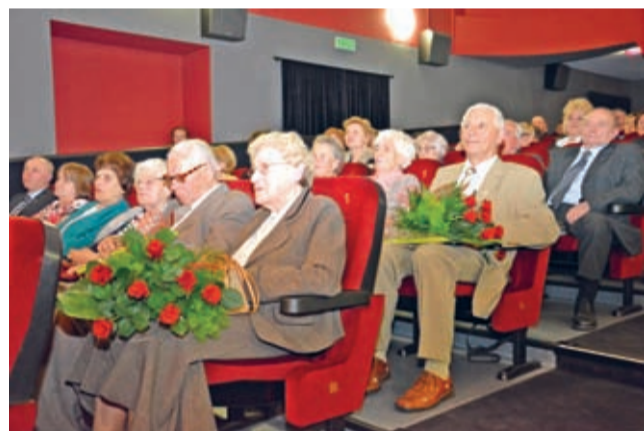
Zasłużeni dla Powiatu Średzkiego...

– Z okazji 10-lecia powiatu odbyła się uroczysta sesja z udziałem radnych wszystkich kadencji. W tym roku impreza miała charakter uroczystej gali. Zaprosiliśmy na nią wszystkich wcześniejszych władarzy powiatu, radnych, a także pracowników, którzy od 15 lat są związani z naszym samorządem. Chcieliśmy w ten sposób docenić ich