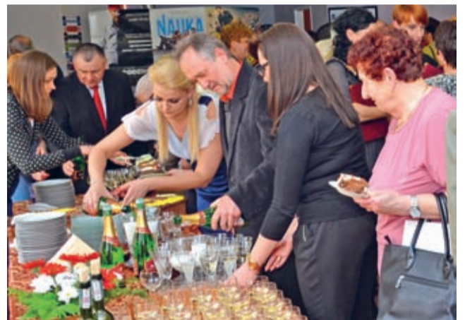
Na jubileuszu nie mogło zabraknąć lampki szampana