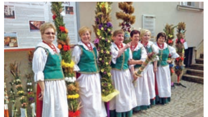
Kulinianie - wielkanocnie w Ząbkowicach Śląskich.

Na zaproszenie Ząbkowickiego Ośrodka Kultury w sobotę 12 kwietnia Kapela Ludowa „Kulinianie” uczestniczyła na ząbkowickim Rynku w festynie pod nazwą „Tradycje i obrzędy wielkanocne”.