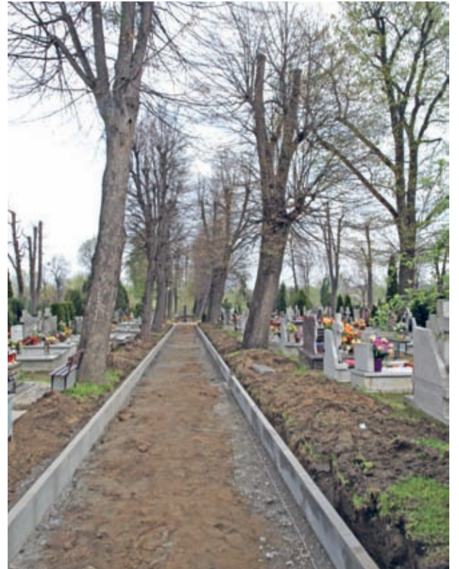
Trwają prace na alejkach wokół głównej części obiektu.

W tym celu wykonano na centralnych alejkach - od wspomnianego wejścia przy ul. Górnej i od wejścia głównego (ul. Cmentarna) wraz z placikiem przed kaplicą.