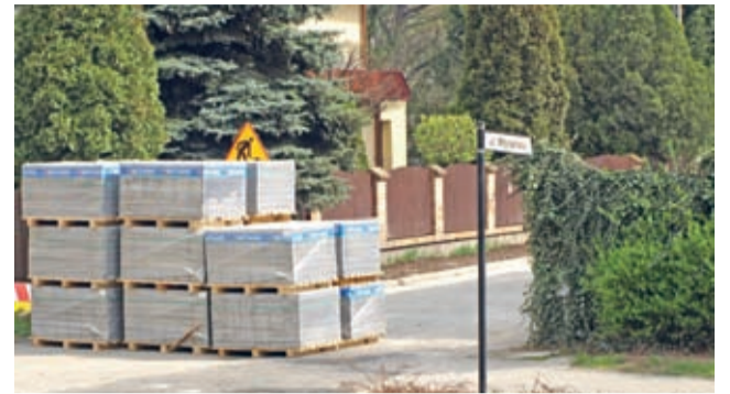
Ul. Młynarska - Gmina Środa Śląska inwestuje nie tylko w główne ciągi komunikacyjne.

Dobiega końca kolejna inwestycja na terenie Środy Śląskiej. Tym razem dotyczyła infrastruktury drogowej i ciągów komunikacyjnych.