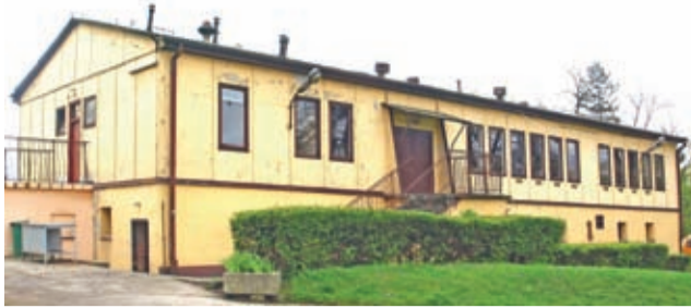
Pawilon przy stadionie miejskim - docelowo ma być gruntownie przebudowany i zmodernizowany.

szatnie i salę sportową na piętrze ma być gruntownie przebudowany i zmodernizowany. Obecnie