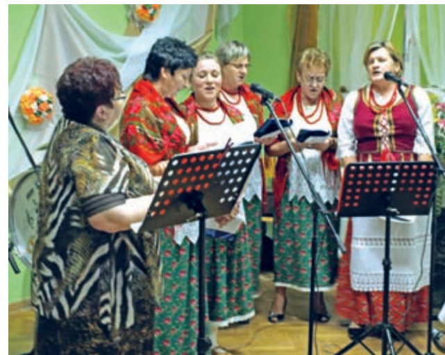
Rozśpiewane Gospodynie z Wrocisławic.

Swojego rodzaju nagrodą za lata działań w różnych dziedzinach życia miejscowości i gminy, było urodzinowe spotkanie, na które do Wrocisławic dotarli mieszkańcy, zaprzyjaźnione koła gospodyń