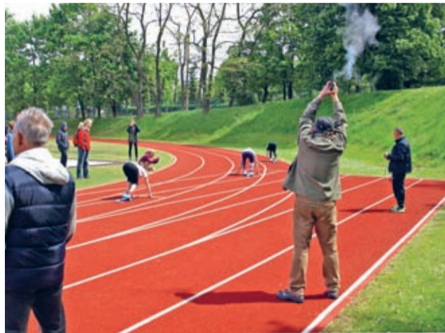
Nowa bieżnia już cieszy i służy sportowcom.

towych ze sztuczną nawierzchnią i zapleczem sanitarnym, w tym także boisko typu „biały orlik”, w sezonie zimowym pełniące rolę lodowiska. – Wniosek o dofinansowanie tej inwestycji złożyliśmy w lutym do Programu Rozwoju Bazy Sportowej województwa dolnośląskiego na lata 2014-2015 i z zadowoleniem możemy powiedzieć, że otrzymaliśmy wsparcie w wysokości półtora mi-