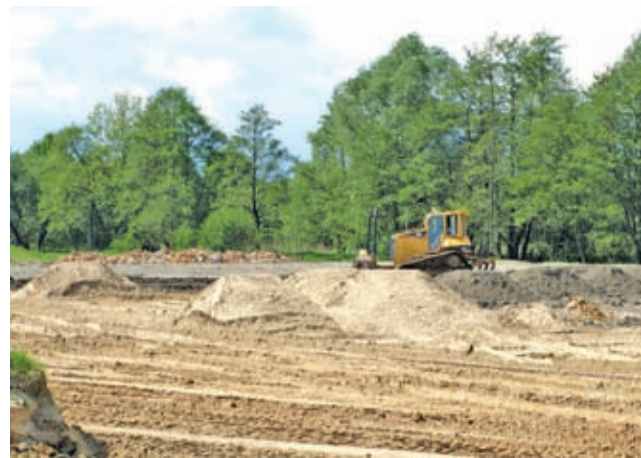
W Ciechowie praca wre.