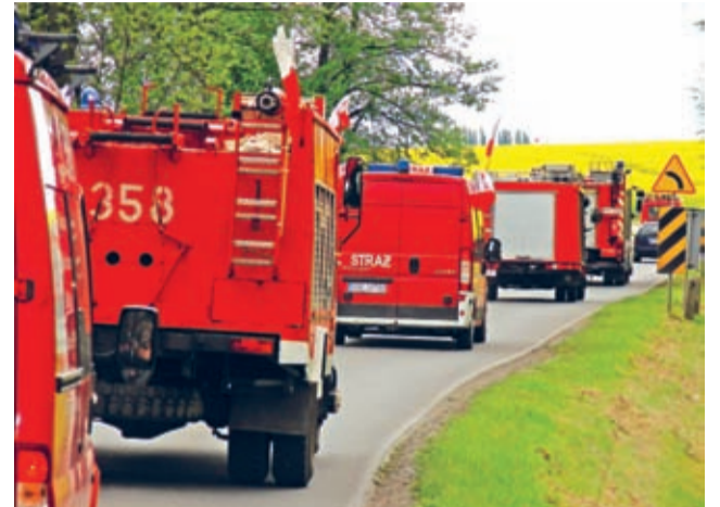
W drodze ze Środy Śląskiej do Bukówka.

11 maja w kościele Świętego Krzyża w Środzie Śląskiej odprawiono mszę świętą w intencji strażaków ochotników powiatu średzkiego i ich rodzin.