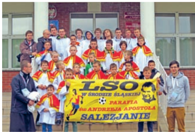
Średzka Służba Liturgiczna na PIMie - dobra kondycja, duża wiedza.

Około pięciuset przedstawicieli parafii z różnych stron kraju, skupionych w blisko trzydziestu drużynach, czynnie uczestniczyło m.in. w rozgrywkach sportowych, zajęciach sprawnościowo-zręcznościowych, a także konkursach wiedzy. Rywalizowano w czterech kategoriach wiekowych (klasy 1-3 i 4-6 szkół podstawowych, gimnazja i licea). Po raz kolejny młodzi średzianie pokazali się z najlepszej strony. Drugi rok z rzędu stanęli bowiem na podium rozgrywek sporto-