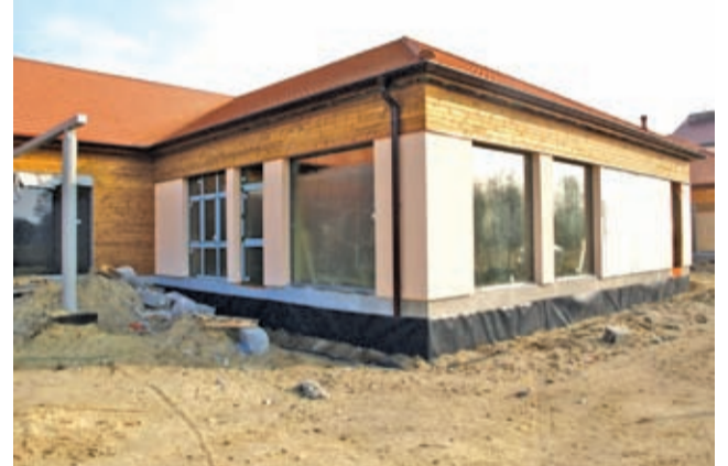
Lokalne Centrum Aktywności Wiejskiej w Szczepanowie

Z przyjemnością i nieskrywaną satysfakcją informujemy, że żłobek budowany w ramach Lokalnego Centrum Aktywności Wiejskiej w Szczepanowie po raz drugi otrzymał wsparcie finansowe z Programu Ministerstwa Pracy i Polityki Społecznej MALUCH.