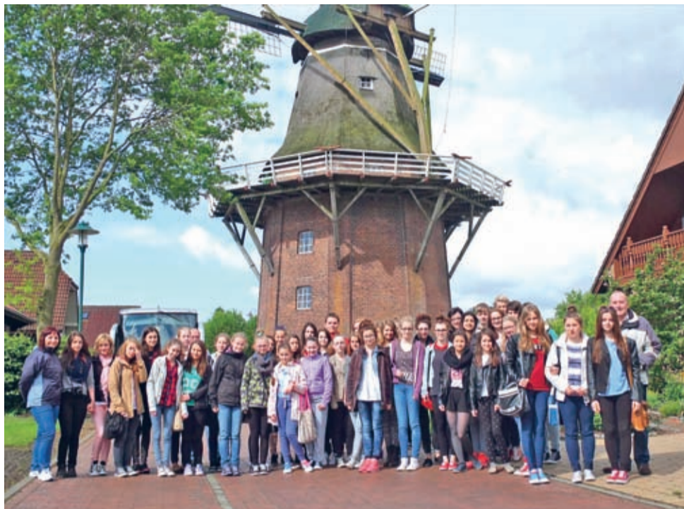
Zabytkowy młyn w Scharrel.

– Podczas kolejnych dni naszego pobytu w Niemczech, nikt nie narzekał na brak rozrywki! Zwiedziliśmy szkołę w Saterlandzie, która zdumiała nas swoją nowoczesnością, odwiedziliśmy zabytkowy młyn w Scharrel, pływaliśmy po rzece Ems w Leer,