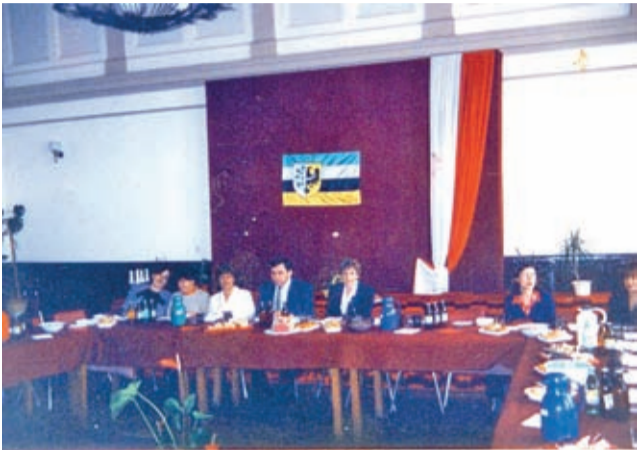
Sala obrad rady powiatu przed remontem.

Zgodnie z zapowiedzią przybliżamy kolejną część książki „15 lat Powiatu Średzkiego. Urodzinowe resume...”. Dziś fragment III rozdziału, zatytułowanego: Mieli wspólny sekretariat.