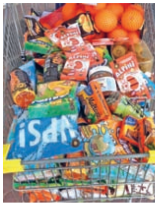
Nie takie znowu małe – co nieco na Dzień Dziecka.

Średzcy sympatycy i fani WKSu po raz kolejny dali o sobie znać i po raz kolejny pokazali, że hasło „w jedności siła” to nie tylko puste słowa. 1 czerwca, a więc w Dzień Dziecka, odwiedzili podopiecznych Placówki Opiekuńczo-Wychowawczej w Środzie Śląskiej. Wychowankom placówki nasi fani Śląska podarowali słodycze, owoce, a także smyczki Śląska i prawdziwą futbolówkę. - Zostaliśmy bardzo miło przyjęci i przez dzieci i przez