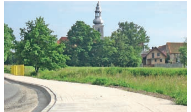
Nowy chodnik łączący Przedmoście i Święte (w tle).

Warto przypomnieć, że wzdłuż drogi łączącej obie miejscowości w roku 2012 Gmina zamontowała dziesięć hybrydowych lamp solarno-wiatrowych. (prg)