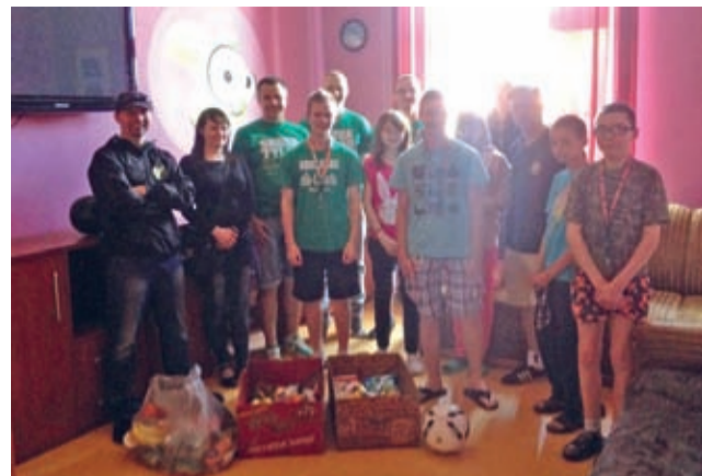
FC Środa Śląska i młodzi znajomi z Placówki.

wychowawców – mówią przedstawiciele FC Środa Śląska. – A znamy się nie od dziś. Dzieciaki miały już okazję być z nami na meczu przyjaźni Śląsk Wrocław -