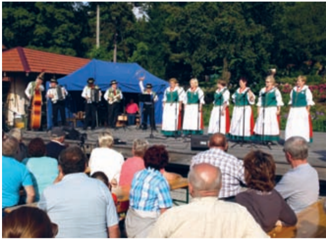
Kulinianie w Arboretum.

Ponad dwadzieścia kapel ludowych, zespołów śpiewaczych i tanecznych można było zobaczyć i wysłuchać w Wojsławicach, w niedzielę 1 czerwca.