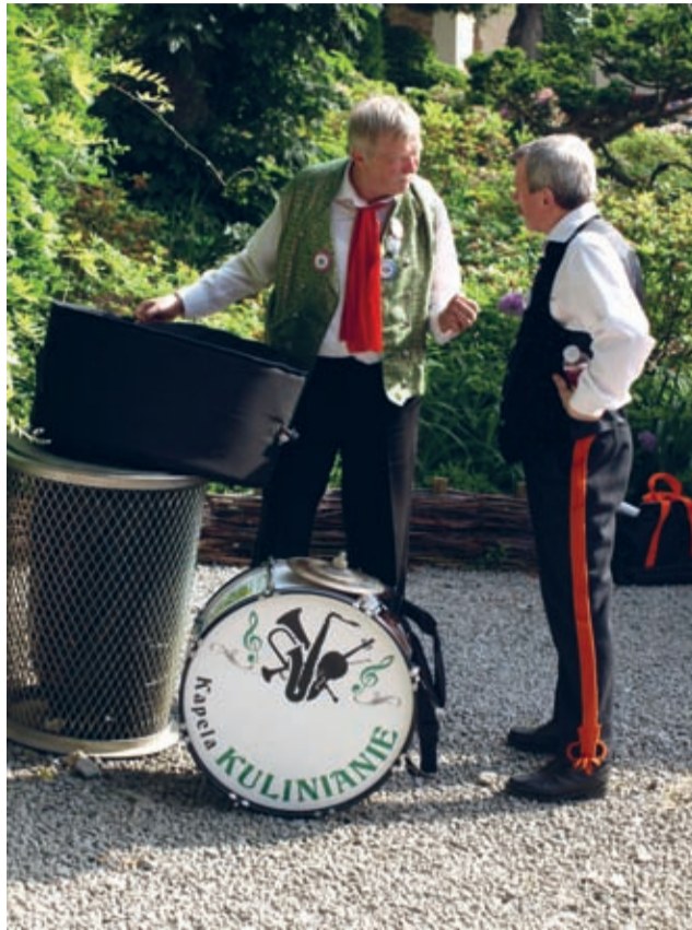
Brażnowa wymiana doświadczeń – gdzie, jak nie na przeglądzie kapel?

- Tyle razy słyszałem was w radiu, a teraz, w końcu, mogę was zobaczyć – nie krył radości jeden z miłośników kultury ludowej.