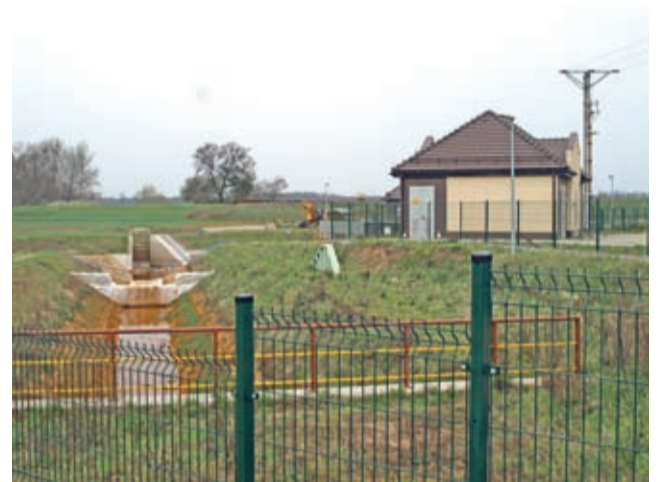
Część infrastruktury powstającego stopnia wodnego „Malczyce” w Rzeczy.

Projekt budowlany uwzględniający m.in. przebudowę systemów melioracyjnych i obwałowania lewostronnego Odry ma być opracowany do końca września br. Natomiast ochrona przed powodzią ze strony rzek Średzka Woda i Jeziora, które zagrażają wsiom Brodno i Rzeczyca oraz obiektom stopnia wodnego Mal-