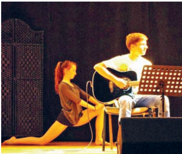
Na scenie DK działo się 12 czerwca dużo i dobrze.