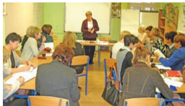
Warsztaty dla dyrektorów szkół i przedszkoli

Łącznie w tym roku szkolnym zrealizowano 207 godz. warsztatów, 42 godz. wykładów i 42 godz. konsultacji. Nauczyciele mieli również możliwość wymiany doświadczeń podczas 25 spotkań w 5 sieciach współpracy i samokształcenia (SWS) tj. dyrektorów, pomocy psychologiczno-pedagogicznej, pracy z nowoczesnymi technologiami TIK, nauczycieli przedmiotów matematyczno-