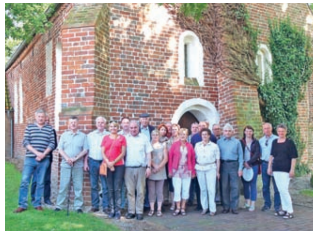
Pamiątkowe zdjęcie przy kaplicy Joannitów

Gospodarze pokazali też miejscowość uzdrowiskową – kurort w Bad Zwischenahn, pełen kuracjuszy o tej porze roku.