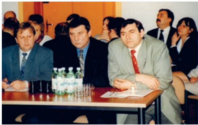
Sesja rady powiatu w wyremontowanej Sali konferencyjnej – 3 kwietnia 2000 r.

Przybliżamy kolejną część książki „15 lat Powiatu Średzkiego. Urodzinowe resume...”. Dziś fragment IV rozdziału pt. „Pamiętasz? Była jesień...”.