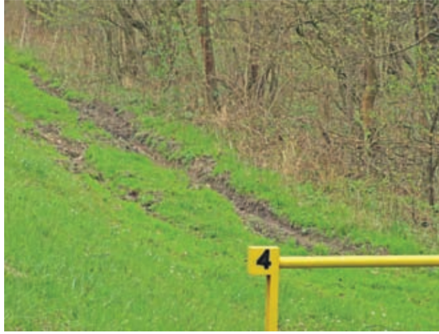
Koleiny u podstawy wału.

To jednak nie wszystko. W roku bieżącym DZMiUW planuje także konserwację rzek i cieków: Jeziorka, Nowy Rów,