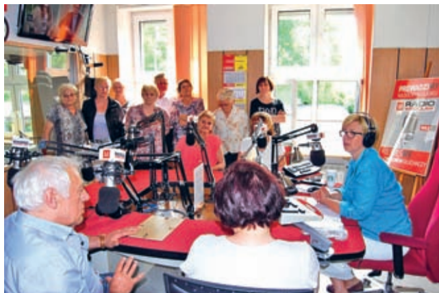
znac, że „Radośni” medialnie radzą sobie coraz lepiej.