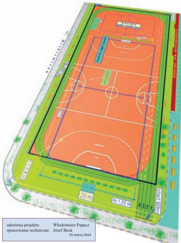
założenia projektu: Włodzimierz Papacz opracowanie techniczne: Józef Bock 25 marca 2014

Nowe i zmodernizowane obiekty cieszyć będą nie tylko gimnazjalistów. Mają być bowiem dostępne także dla ogółu mieszkańców. Warto przypomnieć, że w momencie, kiedy do skutku dojdzie budowa w Środzie Śląskiej nowego gimnazjum, jego