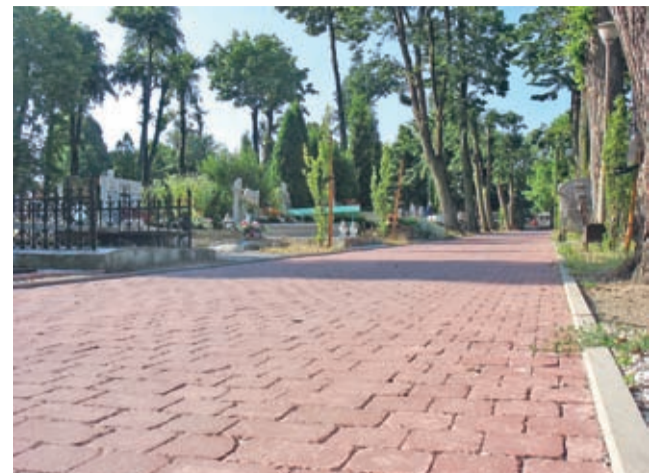
Nowe krawężniki i nawierzchnię z kostki otrzymało łącznie blisko 300 m ciągu komunikacyjnego.

Zakończył się kolejny etap modernizacji średzkiego cmentarza komunalnego.