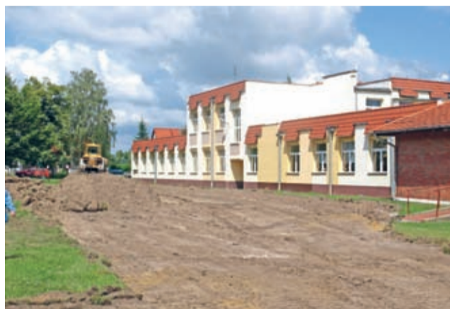
Orlik w Szczepanowie

nych remontów i modernizacji w gminnych placówkach edukacyjnych. Obecnie trwają już prace związane z wymianą szklenia i odnowieniem elewacji sali gimnastycznej w Zespole Szkół w Ciechowie oraz wymianą ogrodzenia i chodnika przy