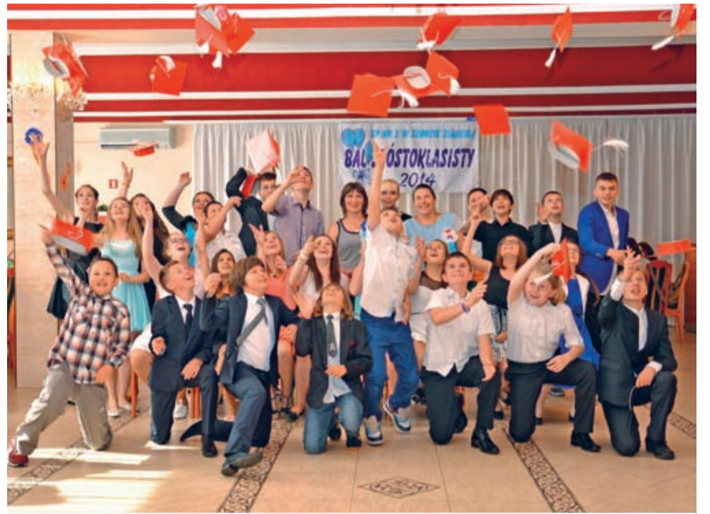
Czapki z głów i w górę – jak pożegnanie, to pożegnanie – kl. VI B przechodzi do historii.

Po sześciu latach nauki mury Tysiąclatki uczniowie klas VI (od A do E) żegnali na Balu Szóstoklasisty w Hotelu Hellon (po raz pierwszy w historii poza murami szkoły). - Co jak co, ale tym razem frekwencji można było pozazdrościć – z zadowoleniem podsumowują Rodzice Współorganizujący Bal. – Dopisali także nauczyciele i o to nam właśnie chodziło.