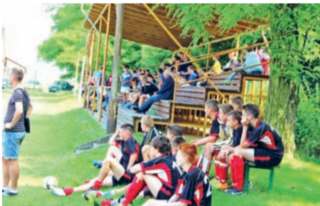
II MIEJSCE KĄTY BYSTRZYCA WROCŁAWSKIE.