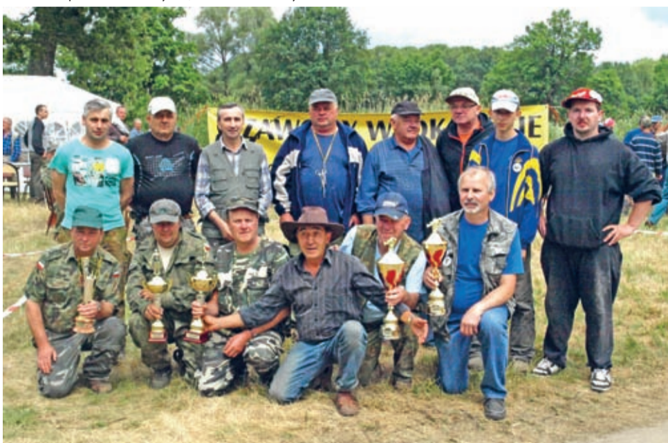
Zwycięskie Koło PZW Środa Śląska z przedstawicielem Koła PZW Malczyce.