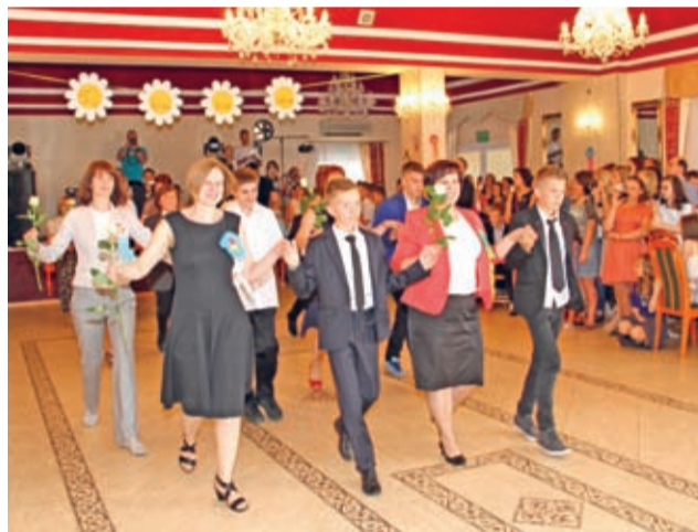
Dostojny chodzony z dyrekcją i gronem pedagogicznym.