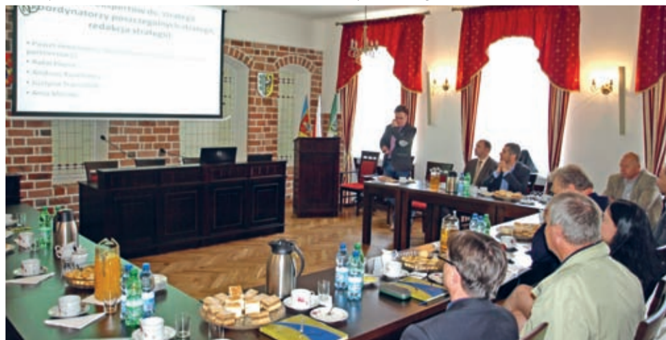
konwent Burmistrzów, Wójtów i Starostów