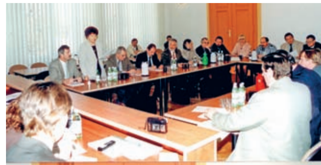
Sesja rady powiatu I kadencji - 3 kwietnia 2000 r.

Motto: Nie zalety ciała i majątku dają szczęście, lecz prawność charakteru i zalety umysłu. Hobby: myślistwo, ulubiony zespół - Maanam.