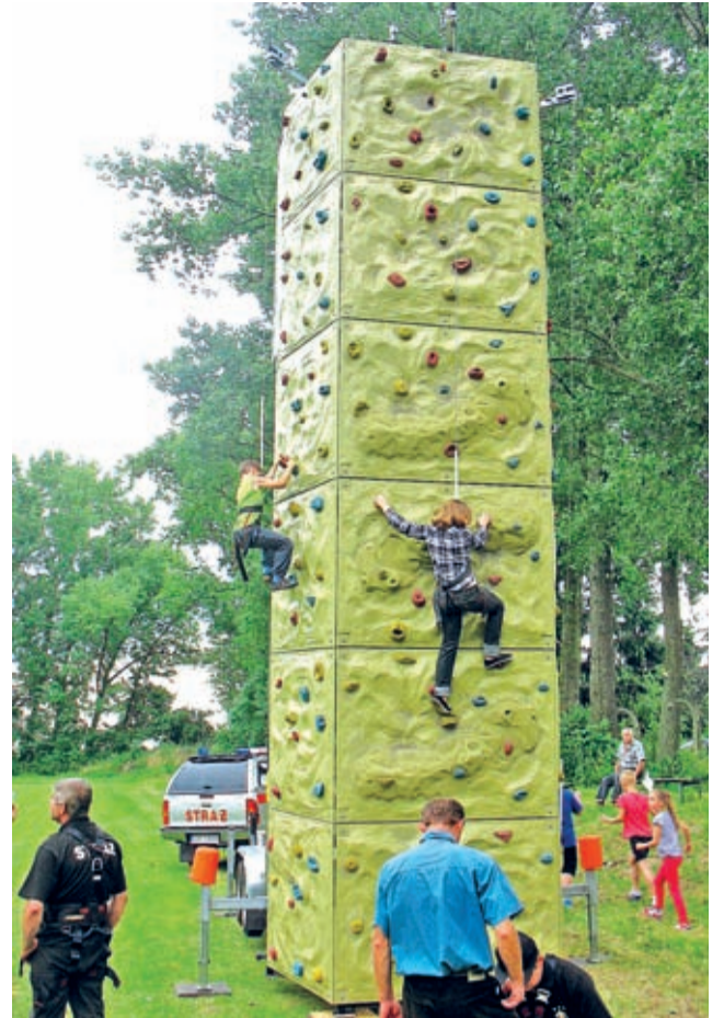
Ścianka wspinaczkowa kusila i dużych i mniejszych.

Przyjdź z całą rodziną i baw się dobrze – tym hasłem OSP Bukówek zapraszała do zabawy. Kto przyszedł, ten się nie zawiódł. Podobno niektórzy już teraz pytali o dokładną datę pikniku przyszłorocznego... (red)