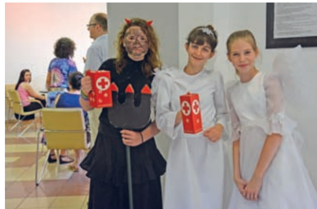
Nie ma rzeczy niemożliwych. Dla słusznej sprawy siły połączą nawet Niebo i Piekło.