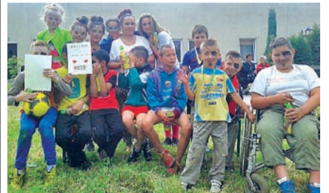
Piknik integracyjny na Lipowej