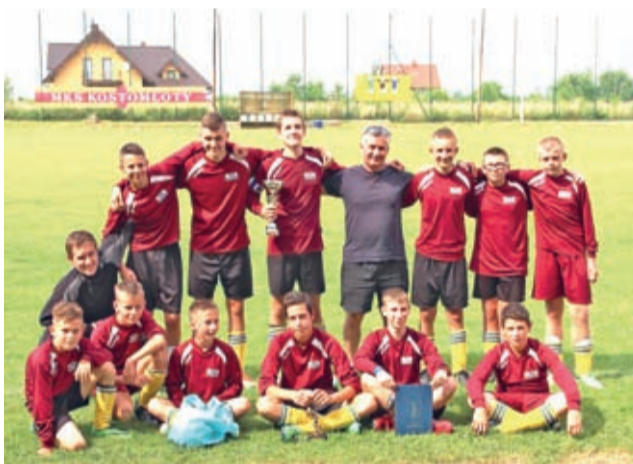
I MIEJSCE MIETKÓW.