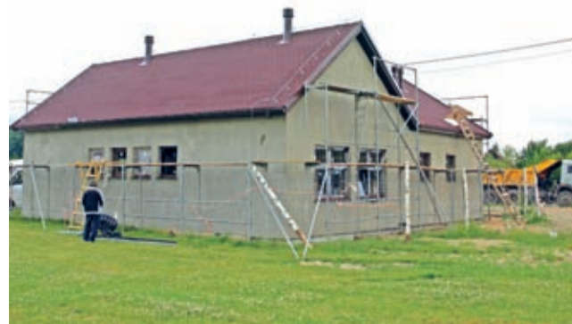
Budowa świetlicy wiejskiej w Komornikach

W Komornikach w nowo budowanej świetlicy zakończono wykonanie pokrycia dachowego, zamontowano stolarkę okienną i wykonano elewację ze styropianu. Obecnie trwają