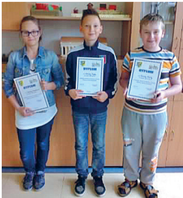
Laureaci konkursu wiedzy o Środzie Śląskiej

Co wiem na temat Środy Śląskiej? Poznajemy nowe, fascynujące miejsca, jeździmy w dalekie podróże, zwiedzamy cały świat, a nie znamy najbliższego otoczenia. Wszędzie szukamy piękna, często zapominając, że mamy je w zasięgu ręki.