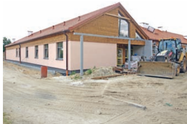
LCAW w Szczepanowie

Już wkrótce z kompleksowego remontu świetlicy wiejskiej będą się cieszyć również mieszkańcy Kulina. Obejmie on budowę