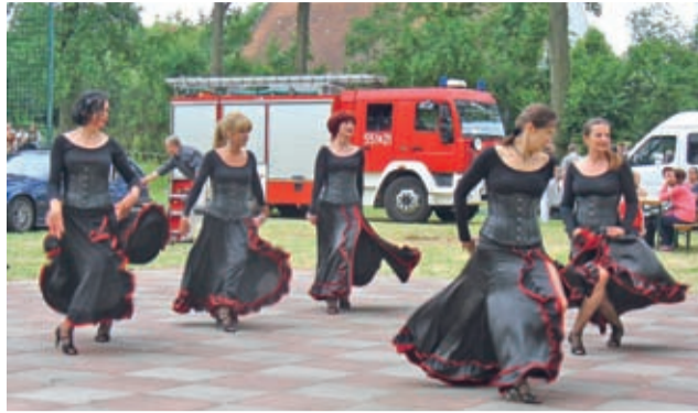
Ladies Extra Crew

Wszystkich atrakcji wliczyć nie sposób: strażacki grill, domowe wypieki made in KGW Bukowianki, napoje zimne i zimniejsze, pokazy sprzętu i sprawności strażackiej dla wszystkich, dla najmłodszych darmowe dmuchańce i ścianka wspinaczkowa (ta także dla dużych).