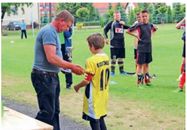
III MIEJSCE MKS KOSTOMŁOTY