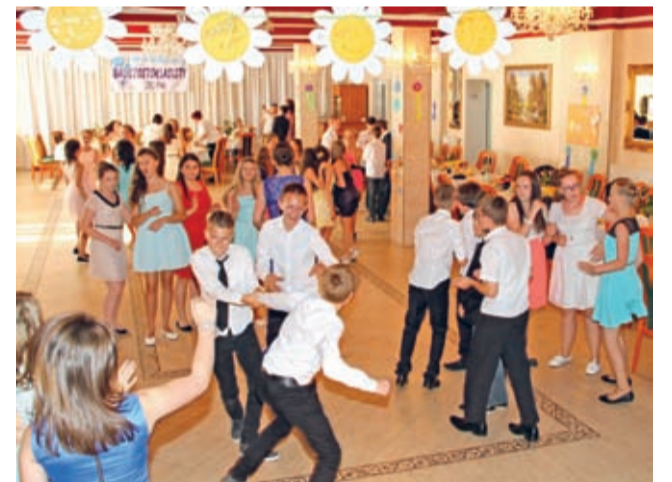
Tańce luźne (przedłużone na wniosek samych tańczących o całą godzinę).

Jak wylczyli szkolni matematycy, rocznik 2001 spędził w szkolnych ławach „Trójki” 6 720