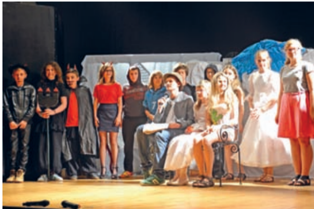
Grupa teatralna SP3 – finał spektaklu.

Nieczęsto na jednej widowni zasiadają dorośli i dzieci, a tak właśnie było w Domu Kultury w Środzie Śląskiej. Tym razem okazją była „Misja specjalna”.