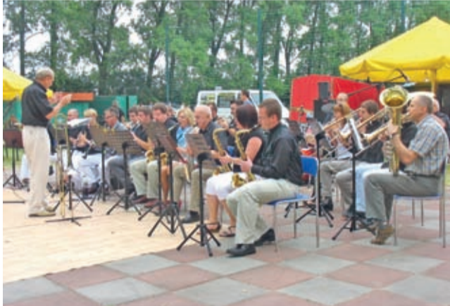
Średzka Orkiestra Dęta na V jubileuszowym.

W Bukówku odbył się Rodzinny Piknik Strażacki. Druhowie z tutejszej jednostki Ochotniczej Straży Pożarnej po raz piąty skrzyknęli się i wraz z zaprzyjaźnionymi jednostkami OSP, przy wsparciu Gminy Środa Śląska i średzkiego Domu Kultury, sfinalizowali piątą edycję imprezy lubianej nie tylko przez mieszkańców Bukówka.