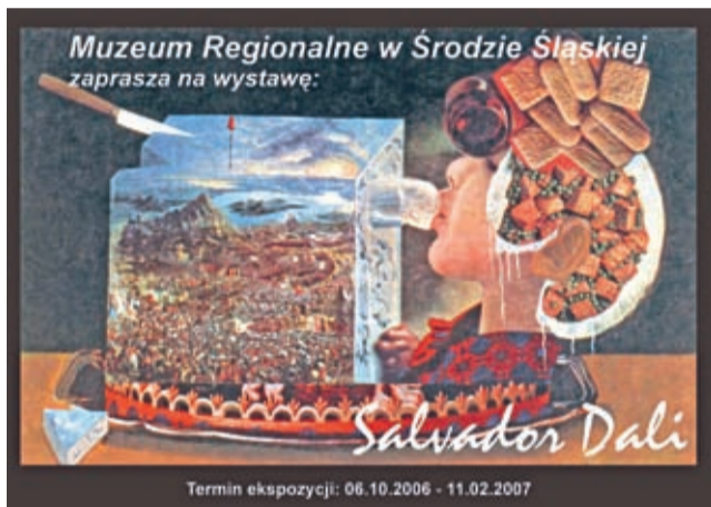
Niezwykła wystawa doczekała się okolicznościowej pocztówki...

W kontekście działalności wystawienniczej muzeum warto wspomnieć o czterech szczególnie ważnych ekspozycjach. W 2004 r. wspólnie z Eulenburg Museum Rinteln koło Hanoweru w Niemczech przygotowano wystawę pt.: „Wypędzenia – Verteibungen.