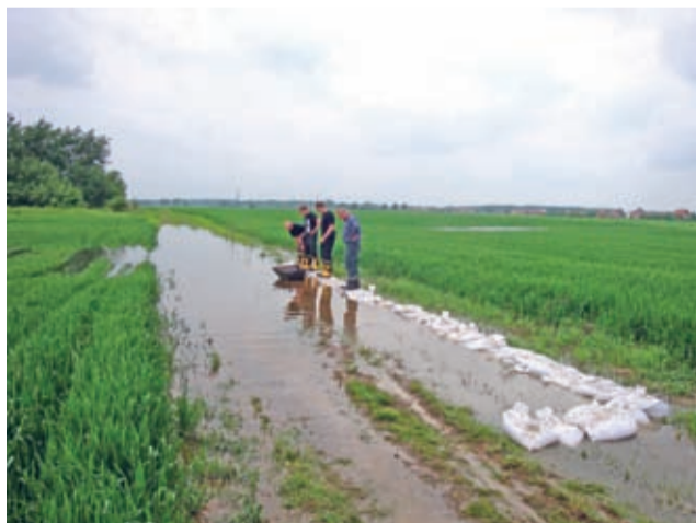
Nieregulowana sytuacja wału Średzkiej Wody skutkuje m.in. takimi wystąpieniami wód cofkowych.