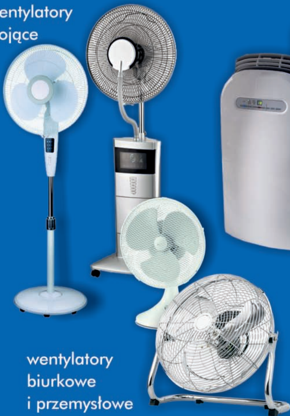
wentylatory biurkowe i przemysłowe