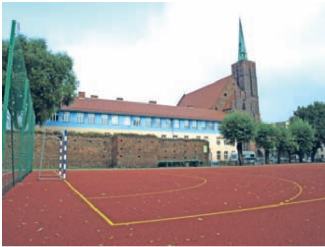
Marzenie właśnie się spełniło...

Nowe i zmodernizowane obiekty cieszyć będą nie tylko gimnazjalistów. Mają być bowiem dostępne dla ogółu mieszkańców. Warto przypomnieć, że