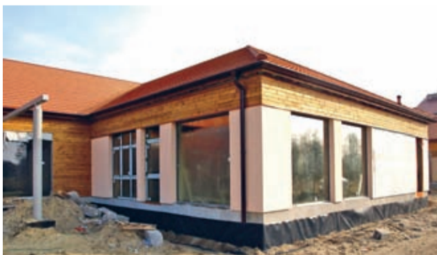
LCAW Szczepanów - prace dobiegają końca.

Nabór potrwa jeszcze do najbliższej środy. Pobrać i złożyć wniosek wraz z załącznikami