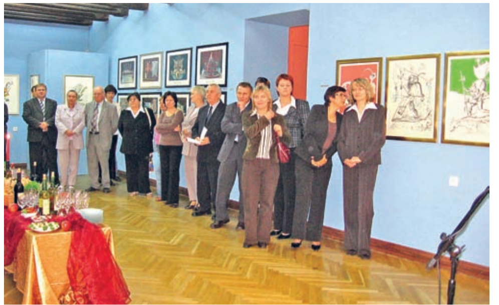
Otwarcie wystawy grafik Salvadora Dali – 6 października 2006 r.