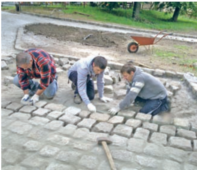
Aktywny Bukówek w akcji...

Informacja o drugim wyróżnieniu dla Bukówka wpłynęła z biura LGD „Kraina Łęgów Odrzańskich”. Tam Bukówek wziął udział w konkursie na „Inicjatywę Partnerstwa Krainy Łęgów Odrzańskich 2013”. Pod ocenę komisji konkursowej poddano wykonanie chodnika przy ko-