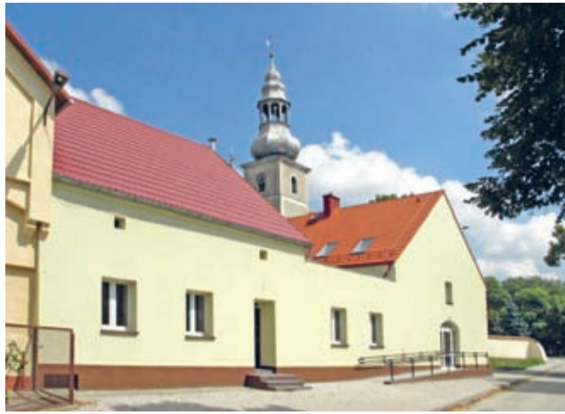
Świetlica w Świątem.

W ostatnich dniach zakończono prace w świetlicy w Świątem, gdzie