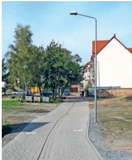
Nowa nawierzchnia od skrzyżowania z ul. Świdnicką do skrzyżowania z ul. Kościelną.