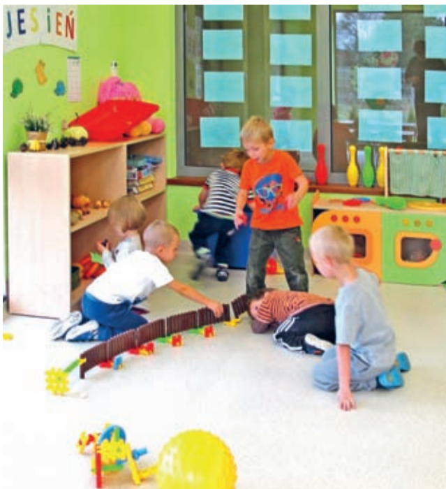
Od godzin rannych do popołudniowych Centrum należy do najmłodszych.