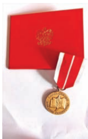
Medal Komisji Edukacji Narodowej dla Środy i Saterlandu