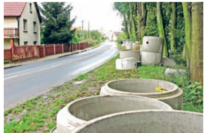
Zbliżają się do półmetka prace przy budowie kanalizacji sanitarnych w Cesarzowicach i Juszczyźnie.

Warto także przypomnieć, że trwają prace projektowe kanalizacji sanitarnej dla Ogrodniczy, Lipnicy, Wojczyc i Wrocisławic, a także dla ulic Miłosa i Ogrodniczkiej w Środzie Śląskiej oraz Kasztanowej w Szczepanowie. (prg)