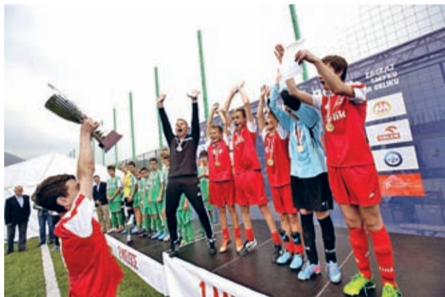
Prawdziwa radość z prawdziwego sukcesu.