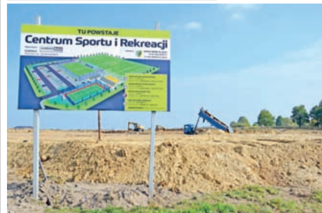
Aktualnie trwają prace ziemne.

Plac budowy inwestorowi przekazano w sierpniu. Od kilku tygodni coraz bardziej widoczny jest postęp prac na budowie Centrum Sportu i Rekreacji w sąsiedztwie Średzkiego Parku Wodnego (akwen „Kajaki”).