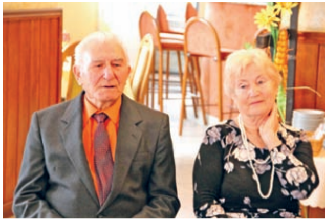
W swoich wystąpieniach odnieśli się do wartości symbolu wierności i miłości rodzinnej, które są dowodem wzajemne-