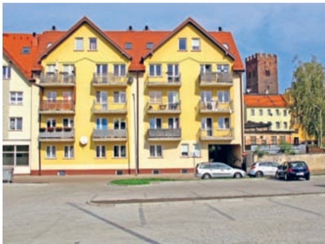
Nowy parking z czterdziestoma miejscami.

Ku zadowoleniu inwestora (gmina Środa Śląska), ale przede wszystkim mieszkańców i osób odwiedzających Środę Śląską, zakończyła się kolejna inwestycja mająca ułatwić życie ludziom i poprawić estetykę miasta.