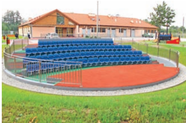
LCAW – amfiteatr.

dwadzieścia cztery miejsca żłobkowe, a dwadzieścia pięć miejsc mają do dyspozycji przedszkolaki – trzy- i czterolatki. Jedne i drugie oprócz nowoczesnych i przestronnych wnętrz mają do dyspozycji nie mniej przestronny