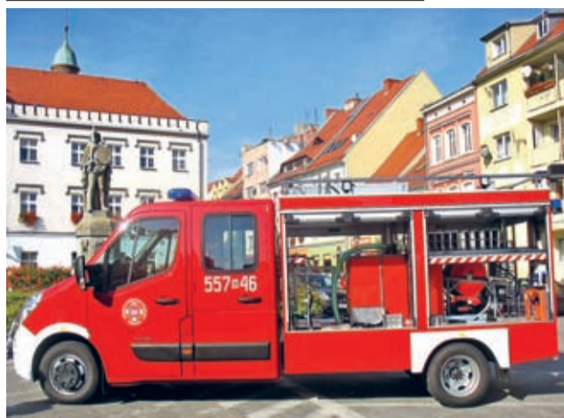
Od 13 października nowy ratowniczo-gaśniczy wóz bojowy posiada na stanie OSP Rakoszyce.

Nie od dziś przy wielu okazjach burmistrz Środy Śląskiej i gminny samorząd deklarują szerokie wsparcie dla strażaków ochotników. I nie są to czcze obietnice.