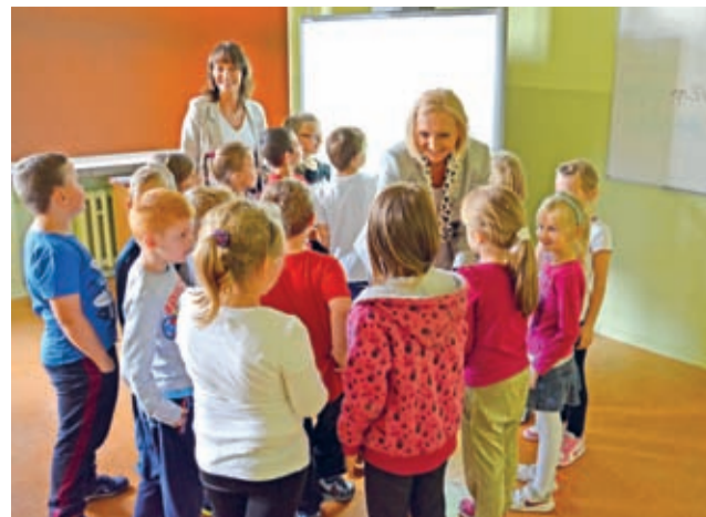
Mimo napiętego planu wizyty pani Kurator spotkała się także z uczniami i średzkiej SP3.

Podczas spotkania poruszono chyba wszystkie istotne dla gminnej oświaty zagadnienia, począw-