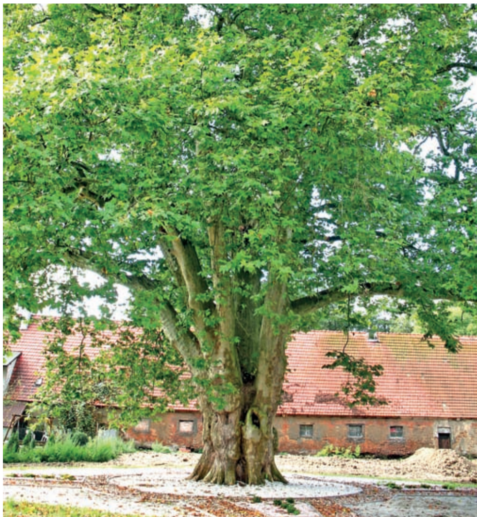
Platan w Cesarzowicach.