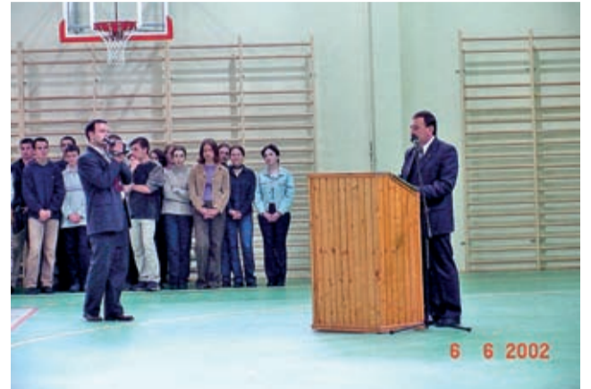
Otwarcie sali sportowej – 7 czerwca 2002 r