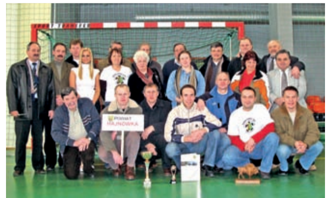
V mistrzostwa Radnych Dolnego Śląska – 17-17 lutego 2008 r.