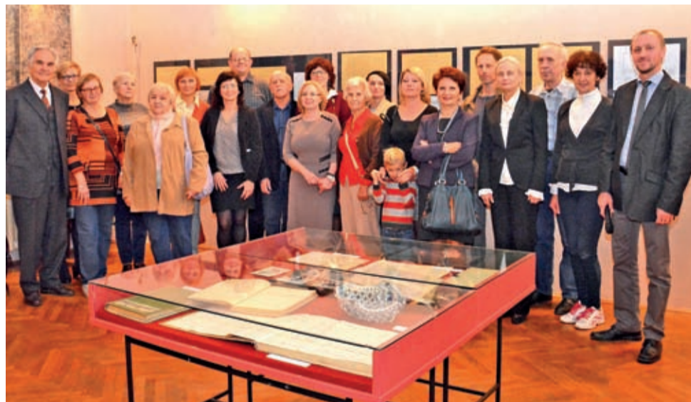
Wspólna fotografia byłych i obecnych pracowników placówki

placówki i na pomysły, które się tutaj rodzą. Dziękuję pracownikom za ich pracę i zaangażowanie - podkreślił starosta.