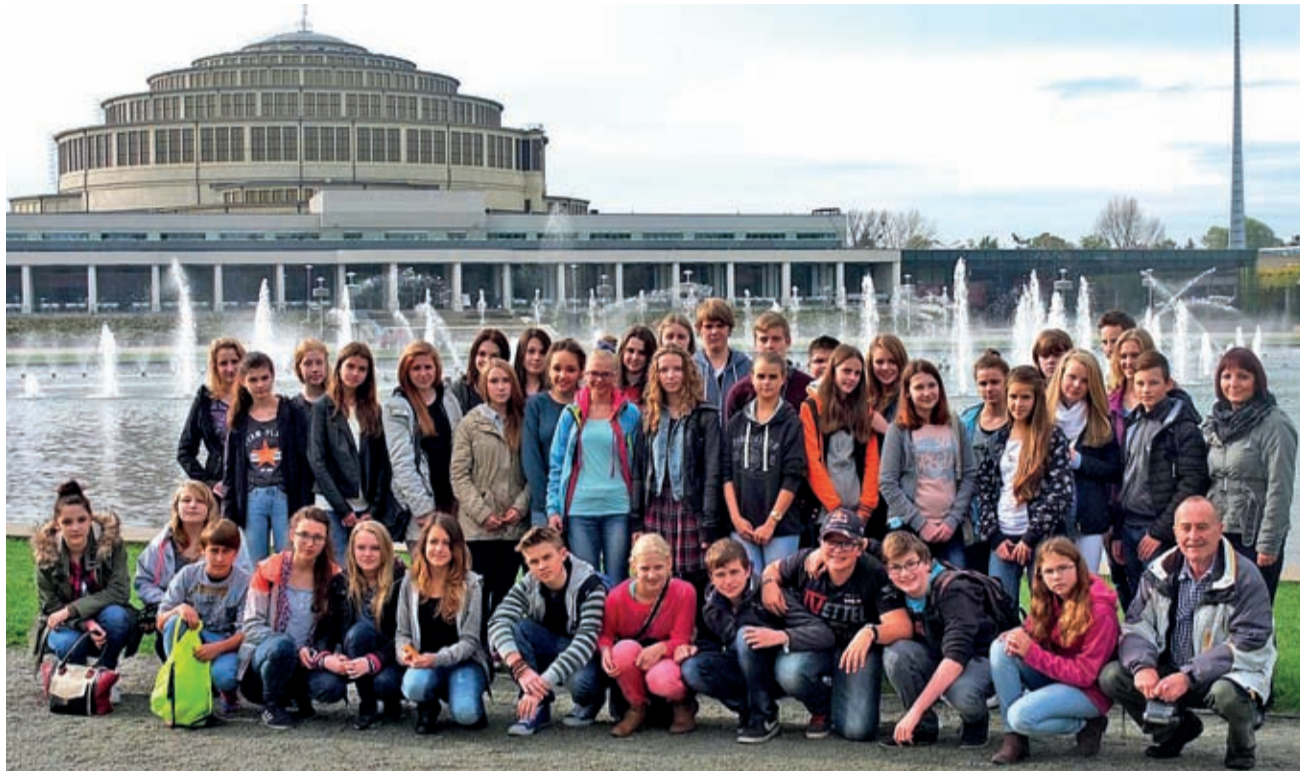
Uczestnicy wymiany pod Halą Ludową (czy jak kto woli – Halą Stulecia).