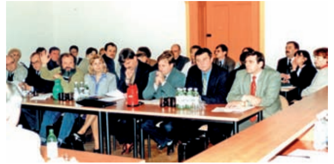
Sesja rady powiatu II kadencji – 3 kwietnia 2000 r.

Kończymy publikację fragmentów książki „15 lat Powiatu Średzkiego. Urodzinowe resume...”. W ostatniej jej części znalazła się fotogaleria, z której prezentujemy dziś kilka zdjęć.