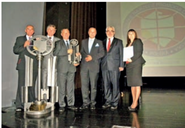
Dolnośląski Klucz Sukcesu dla Powiatu Średzkiego – 15 września 2011 r.