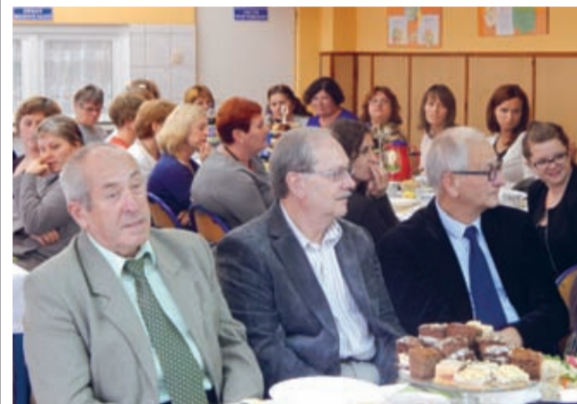
Trudno o lepszą okazję do spotkania pracowników szkoły niż Święto Edukacji Narodowej.

Spotkanie uświetniły dzieci. Piosenkami, wierszami i włożoną w przygotowanie pokazu pracą, przekazały nauczycielom i wychowawcom swoje najlepsze życzenia. (prg)