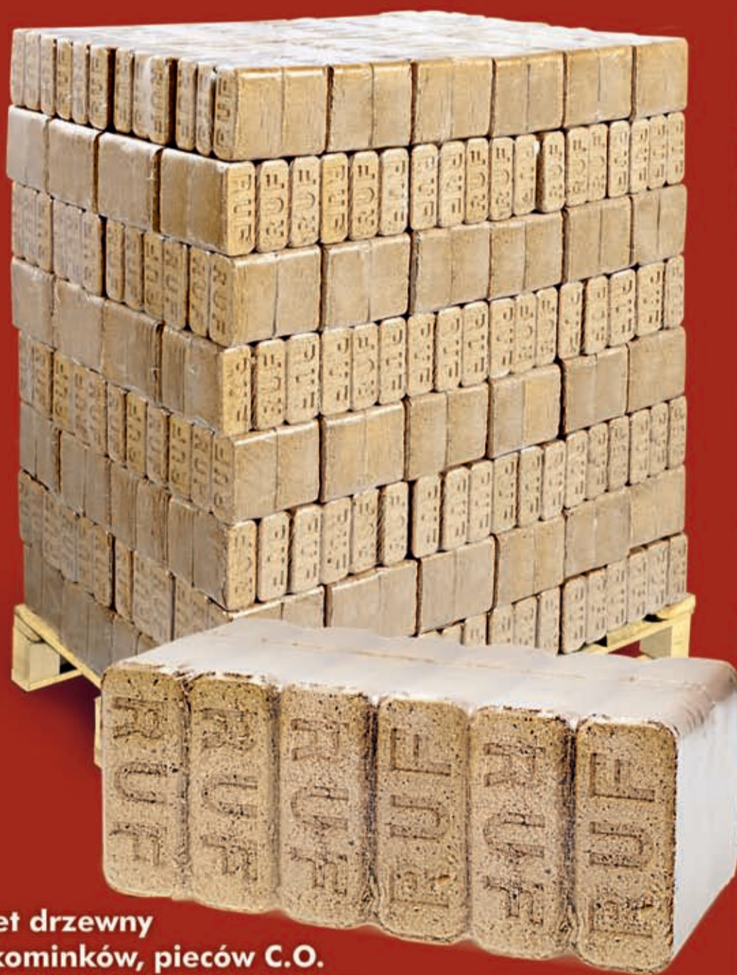
Brykiet drzewny * do kominków, pieców C.O. palenisk, kotłów grzewczych

MOŻLIWOŚĆ ZAPARKOWANIA SAMOCHODEM I ODBIÓR TOWARU