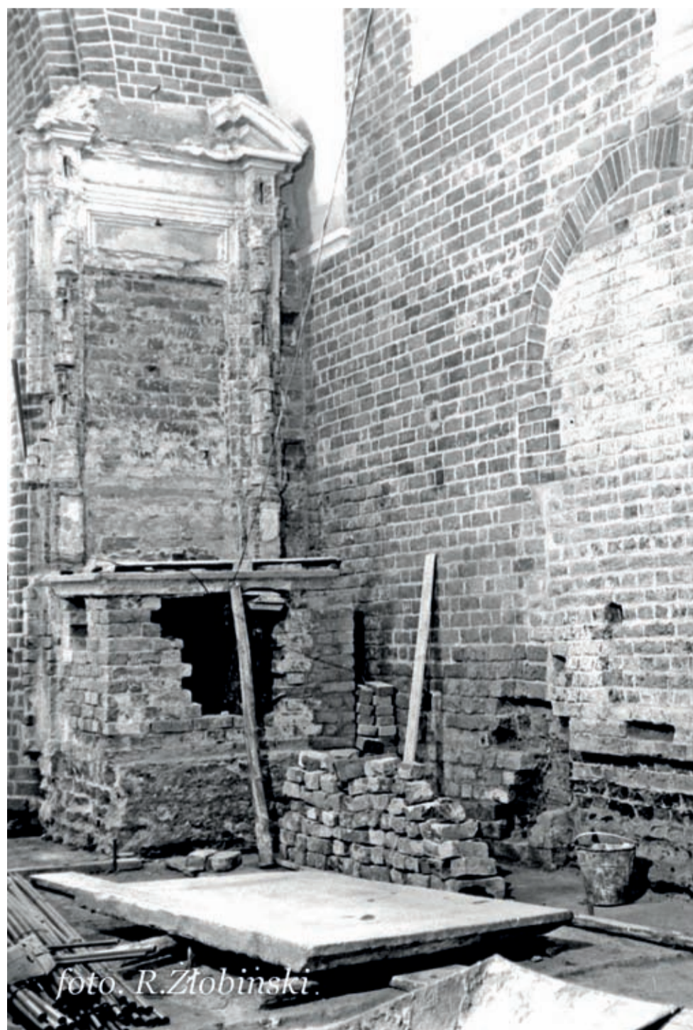
Nie tylko troska o miejsce kultu, ale też o kilkusetletnią perełkę architektoniczną, doprowadziły do decyzji o remoncie.