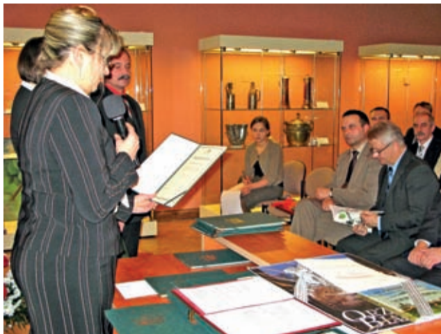
Uroczysta sesja z okazji 10. rocznicy reaktywowania powiatów – 30 stycznia 2009 r