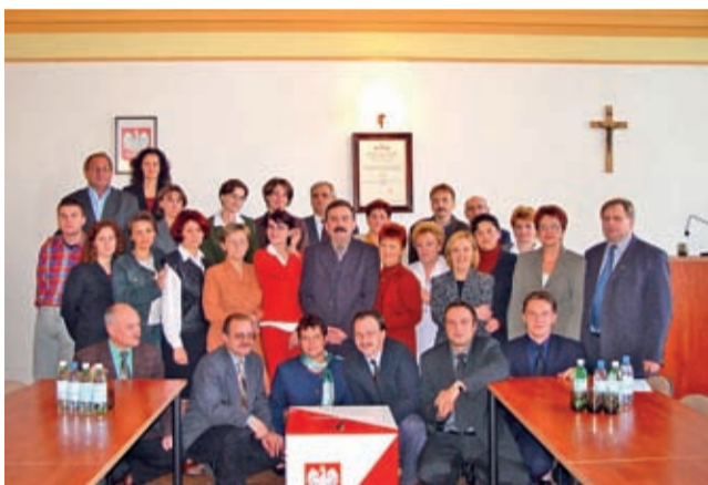
Pracownicy starostwa – listopad 2002 r.