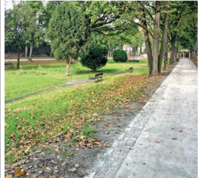
Już wkrótce rozpocznie się modernizacja i gruntowna przebudowa także dolnych alejek tej części parku.

W połowie października zakończył się kolejny (i nie ostatni) etap rewitalizacji parku miejskiego w Środzie Śląskiej.