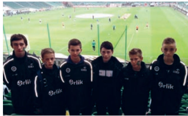
Średzkie OrleTA – drużyna na 5!

drużyny ze Świerzawy, Polanicy i Milicza, a upragniony awans do Wielkiego Finału Ogólnopolskiego zapewnił sobie po bardzo wyrównanym finale i zwycięstwie nad rówieśnikami z Bolesławca 1:0.