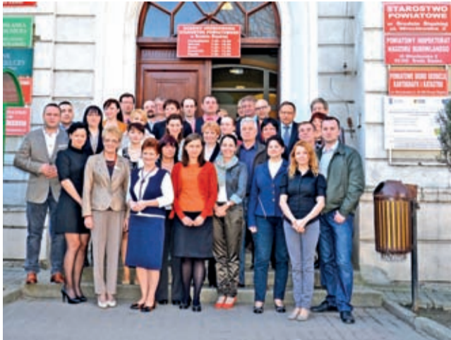
Pracownicy średzkiego starostwa, którzy 21 marca 2014 r. znaleźli czas na wspólne zdjęcie...