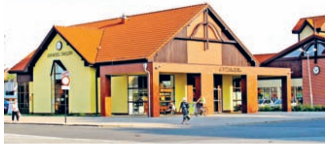
Środa Śląska - jeden z nielicznych w kraju wybudowany przez samorząd dworzec autobusowy.

Blisko pięćdziesiąt sesji, sto pięćdziesiąt posiedzeń komisji stałych, czy prawie czterysta podjętych uchwał tak przedstawia się liczbowy obraz kończącej się właśnie kadencji Rady Miejskiej w Środzie Śląskiej.