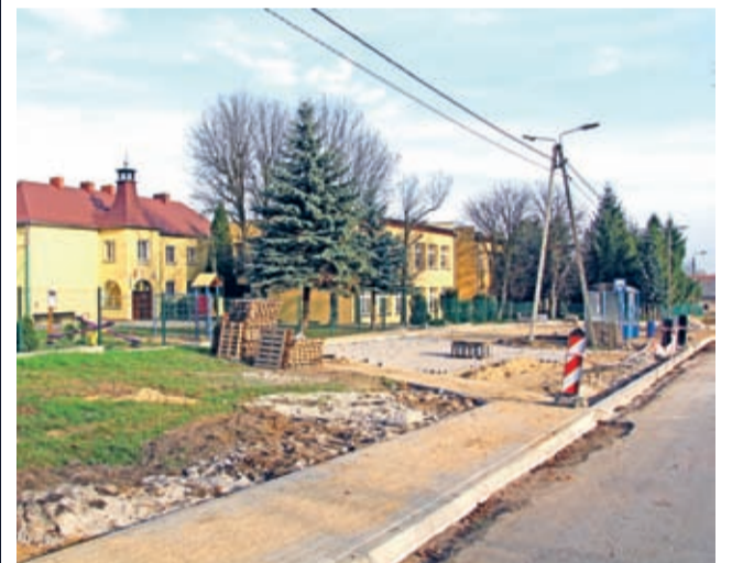
Już wkrótce nowe chodniki i m.in. miejsce do zawracania szkolnego autobusu zostaną ukończone w Rakoszycach na odcinku od skrzyżowania z drogą wojewódzką do ostatnich zabudowań w stronę Kulina.

Dobra i konstruktywna współpraca Gminy Środa Śląska form ma wiele. Jedną z nich jest partycypacja jednego samorządu w kosztach inwestycji, które wykonuje drugi.