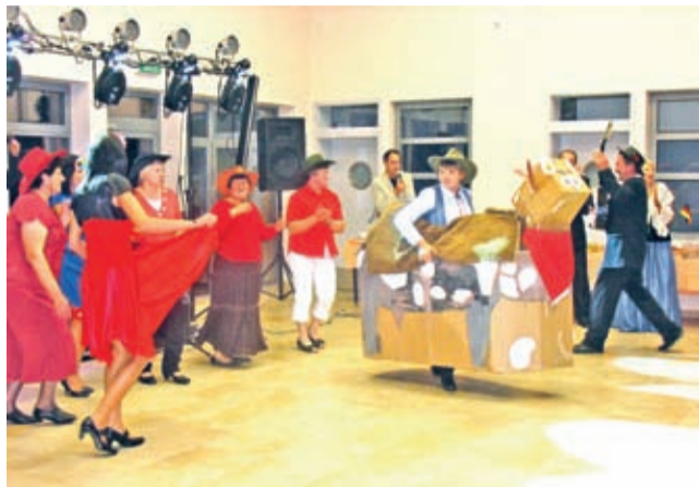
Corrida made in Lipnica.

Juliusz Verne udowodnił, że świat da się objechać w osiemdziesiąt dni. Po ponad stuleciu rekord ten pobili koła gospodyń wiejskich gminy Środa Śląska.