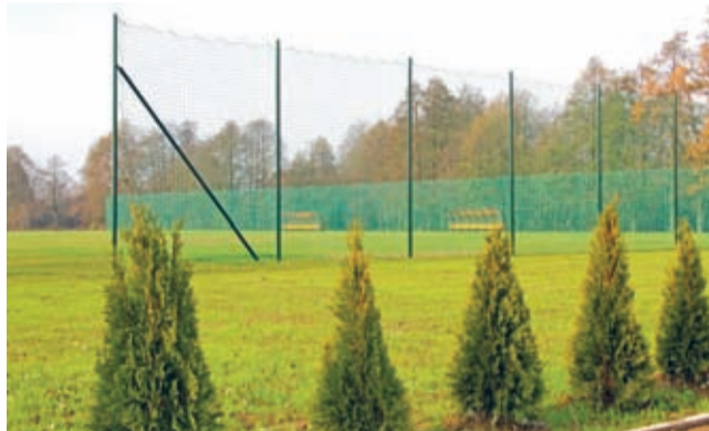
Nowy obiekt w Ciechowie to pierwszy etap większej inwestycji.

Zakończyła się budowa boiska sportowego w Ciechowie. W ramach wartej ponad 800 tys. zł inwestycji przy ciechowskim zespole szkół powstało trawiaste boisko o wymiarach 105 x 70 m, z bramkami i trybuną dla widzów.