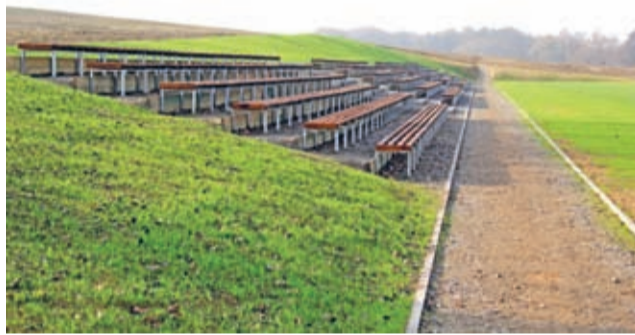
Ciechów – nowe trybuny przy nowym boisku.

Boiskowa infrastruktura to też drogi dojazdowe i parkingi z miejscami także dla autobusów i miejscem do zawracania dla autobusu szkolnego. Obiekt wy-