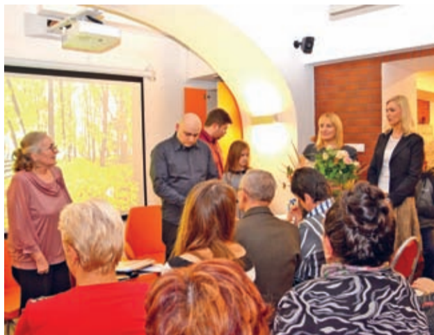
Poetycko-artystyczne spotkanie w toku.