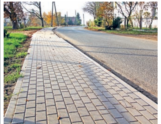
Gotowy chodnik w Kobylnikach, w których po otwarciu pobliskiego mostu na Odrze znacznie wzrosło natężenie ruchu kołowego.

- Tym razem wspólnie z powiatem podnosimy estetykę ziemi średzkiej, ale przede wszystkim zwiększamy bezpieczeństwo ludzi – mówi burmistrz Środy Śląskiej Bogusław Krasucki. – Ma to znaczenie szczególne np. w przypadku Kobylnik, w których po otwarciu pobliskiego mostu na Odrze znacznie wzrosło natężenie ruchu kołowego czy Rakoszych, gdzie bezpieczną drogę do i ze szkoły zapewnimy uczniom tamtejszego zespołu szkół. (prg)