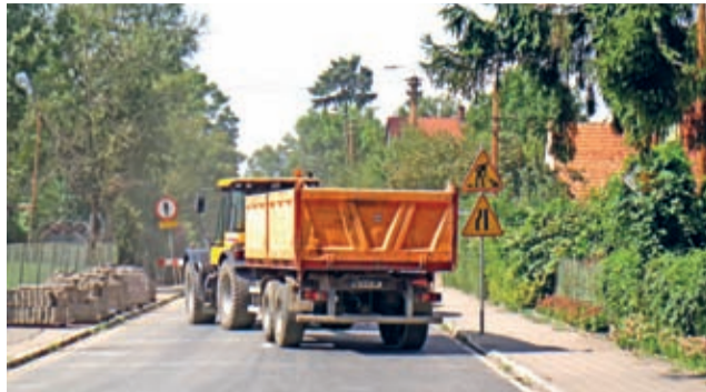
Inwestycja dotyczy m.in. remontu nawierzchni ul. Kolejowej w Środzie Śląskiej na odcinku od skrzyżowania z ul. Sikorskiego do skrzyżowania z ul. Malczycką.

Jak już wspomniano będzie to kolejna (szósta – przyp. aut.) „schetyńówka” Gminy Środa