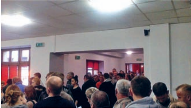
Na miasto poszły plakaty, zadziałała „poczta pantoflowa” i media społecznościowe - efekt przerósł najśmielsze oczekiwania.

Jak przystało na fanów z prawdziwego zdarzenia, kibice wrocławskiego WKS-u skupieni w FC Środa Śląska nie tylko wspierają swoją drużynę, ale nie żałują pomocy dla koleżanek i kolegów po szalu.