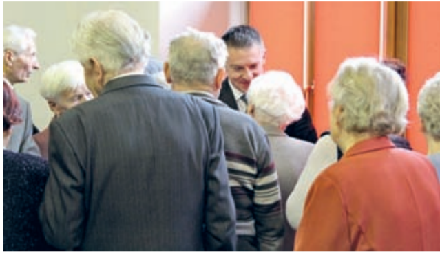
Wspólne koledowanie, opłatek, barszcz z uszkami... – było swojsko i sympatycznie.

Wyrazy szacunku, zapewnienia o dalszym wsparciu, ale przede wszystkim najlepsze życzenia świąteczno-noworoczne, a wszystko podczas spotkania opłatkowego środowisk kombatanckich z władzami samorządowymi gminy Środa Śląska.