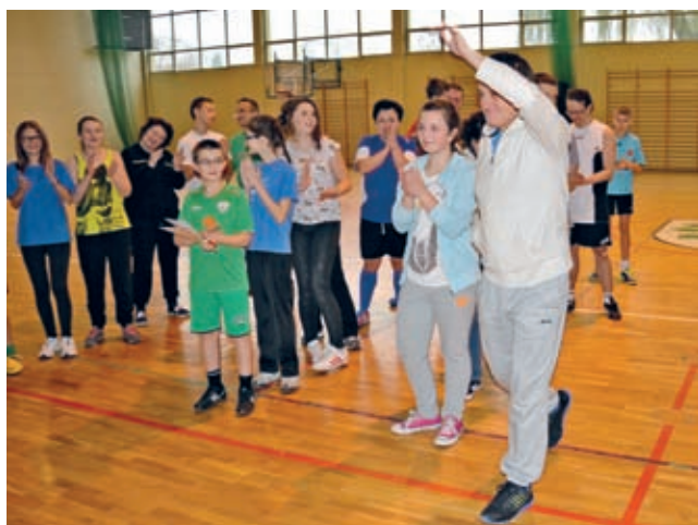
Dyrektor szkoły okazał się również dobrym bramkarzem