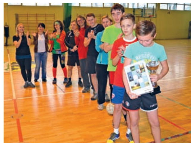
Zadowolone, i już mniej groźne, Czarne Smoki