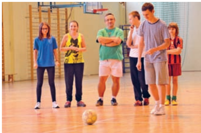
Rzuty karne – pełne skupienie...

W grudniu uczniowie kl. Ia średzkiego gimnazjum, ich nauczyciele oraz rodzice spotkali się na Mikołajowym Integracyjnym Turnieju Piłkarskim.