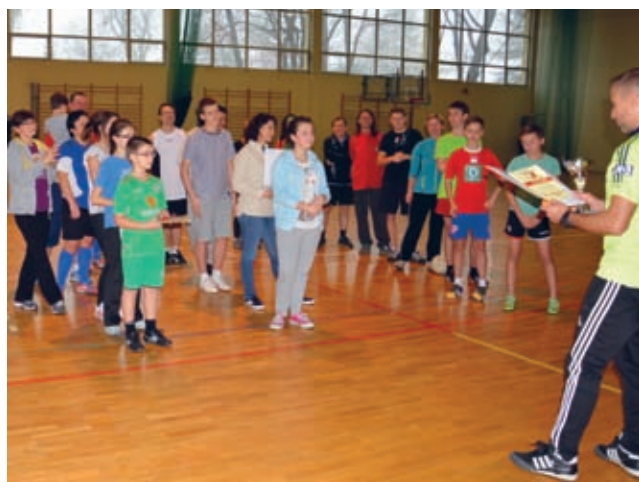
Sędzią głównym turnieju był Sławomir Samiec-Talar