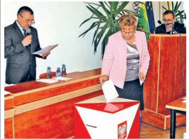
Głosowanie na wiceprzewodniczącego