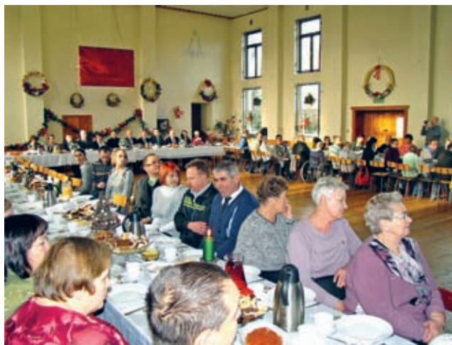
Przedświąteczne spotkanie dostarczyło wszystkim wielu wzruszeń i radości.