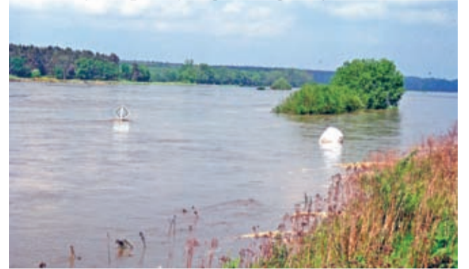
Odra – bywa i taka.

Rozpoczęły się w grudniu roku ubiegłego i potrwać do 22 czerwca roku bieżącego. Konsultacje społeczne opracowywanych Planów Zarządzania Ryzykiem Powodziowym – bo o nich mowa – powinny być i są dla Gminy Środa Śląska sprawą wagi szczególnej.