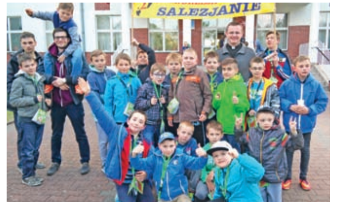
Nasi od św. Andrzeja w Twardogórze – PIM 2015