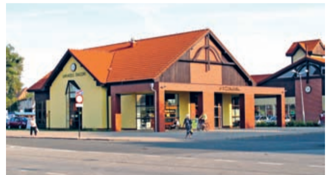
Już w dniach na średzkim dworcu autobusowym zostanie otwarty posterunek straży miejskiej.

Grafik pracy posterunku będzie weryfikowany na bieżąco, po jego uruchomieniu, uwzględnia-