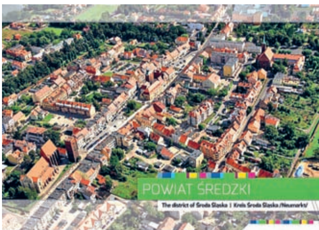
Mocną stroną folderu są zdjęcia. Te na okładkę wykonał i użyczył Grzegorz Kilian

Folder informacyjny i koszulki - na takie materiały promocyjne postawił w tym roku Powiat Średzki.