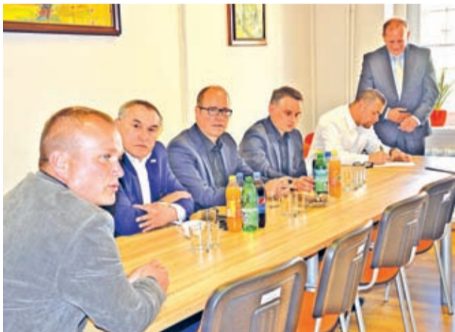
Vorwerk i Gotec od wielu lat angażują się w działania szkoły