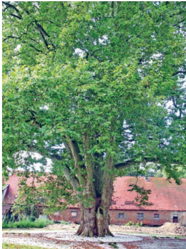
Platan w Ceszowicach – jedno z szesnastu najpiękniejszych w tym roku drzew w kraju.

Platan wspomniany wyżej to właśnie cesarzowicki Cesarz. Wiele wskazuje na to, że pod nim swego czasu miał możliwość