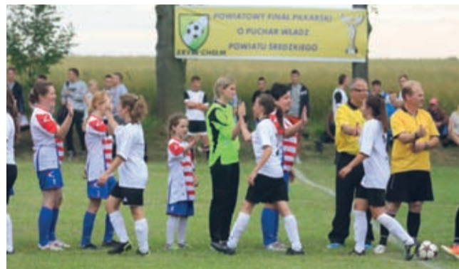
Fot. Łukasz Harażny. Finał 2014 - Chelm

Wyjątkowo ciekawie zapowiada się turniej piłkarski, który odbędzie się 22 sierpnia w Budziszowie.