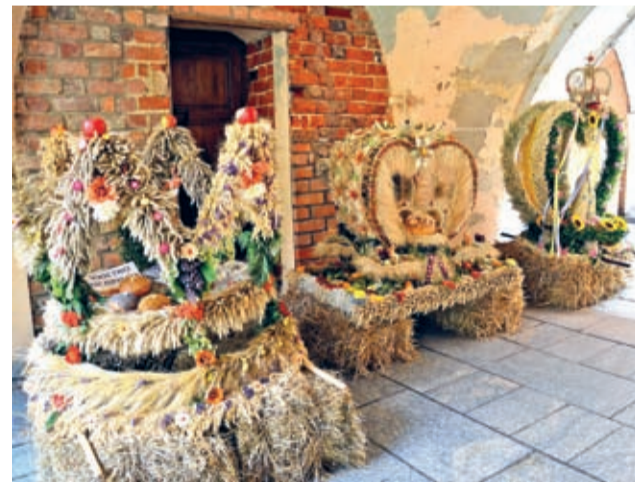
Z lewej wieniec Szczepanowa, w środku zwycięzca z Osieka

Zgłoszenia wieńców dokonują gminy powiatu i mają na to czas do poniedziałku 7 września. Dzień później wieńce powinny znaleźć się na dziedzińcu mu-