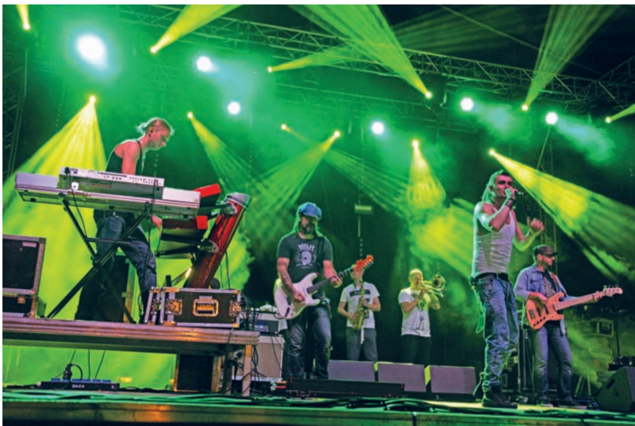
Koncert Kamila Bednarka na średnim rynku 12 września