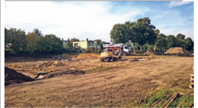
Plac budowy średzkiego żłobka

1 września to nie tylko 76. rocznica rozpoczęcia II wojny światowej. Dla Środy Śląskiej to także data rozpoczęcia budowy nowego, nowoczesnego żłobka u zbiegu ul. Wierzbowej z ul. Wrocławską.