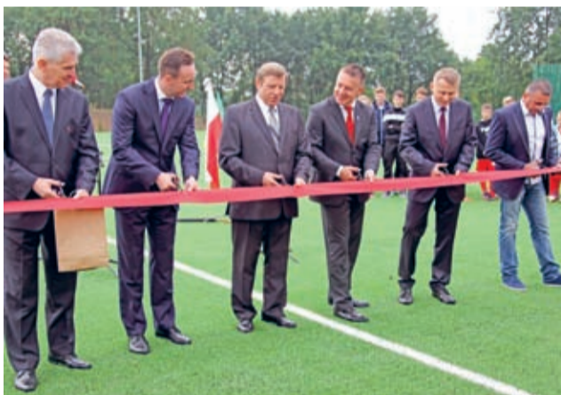
Otwarcie Średzkiego Centrum Sportu i Rekreacji 11 września

11 września 2015 roku zapisze się w historii Środy Śląskiej jako Dzień Sportu. Wszystko za sprawą długo oczekiwanego otwarcia jednego z największych wielofunkcyjnych obiektów sportowych w naszym subregionie – Centrum Sportu i Rekreacji przy Średzkim Parku Wodnym. ► 9