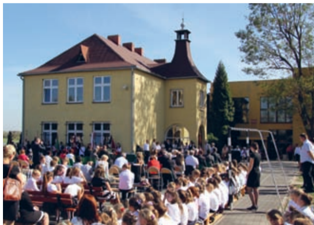
Bohaterami dnia byli Sybiracy ziemi Średzkiej i społeczność szkolna Zespołu Szkół.

zwłaszcza jeśli to imię tak bardzo związane jest z historią najnowszej naszego kraju. To powód do dumy, ale też duże wyzwanie i temu wyzwaniu uczniowie i nauczyciele Zespołu Szkół imienia Sybiraków w Rakoszycach umieją sprostać. (prg)