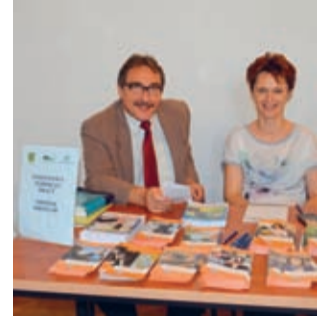
Targi Pracy - wiosenna edycja