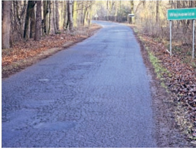
W gminie Miękinia wyremontowanych zostanie 5,5 km odcinek drogi

W styczniu 2016 roku zostanie rozpisany przetarg na realizację inwestycji. Szacunkowy koszt wykonania robót na obu odcin-