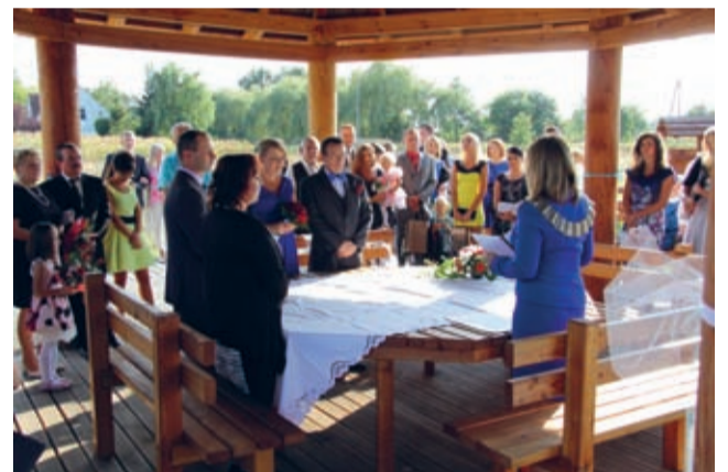
Ścieżka edukacyjno-przyrodnicza w Brodninie - idealne miejsce także na plenerowy ślub.

Drużyna wzięła ślub w jednym z hoteli w Środzie Śląskiej. Obie, za ślub poza USC zapłaciły 1000 zł, gdyż takie warunki dyktuje ustawodawca. Podkreśla także, że ślub może się odbyć, jeśli „wskazane we wniosku miejsce zachowanie uroczystej formy zawarcia oraz bezpieczeń-