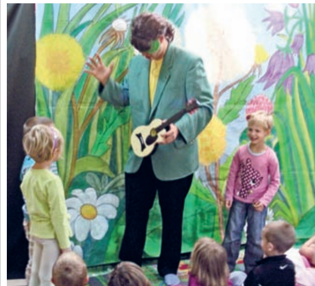
Teatr DUET w naszej gminie.