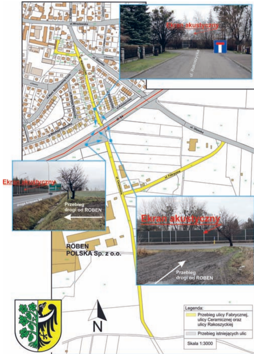
Wizualizacja przebiegu nowo nazwanych ulic Ceramicznej i Fabrycznej.

O ile ww. uchwały radni podejmowali jednogłośnie, to nie było zgody co do zmiany nazwy części ul. Rakoszyckiej. Składa się ona z dwóch odcinków od-