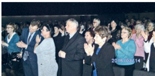
Koncert wraz z Misterium odbył się 14 marca we Wrocławiu, w Klubie 4 Regionalnej Bazy Logistycznej.

Z okazji zbliżających się Świąt Wielkanocnych Urząd Marszałkowski Województwa Dolnośląskiego - Departament Zdrowia i Promocji Województwa oraz Platforma Wiedzy i Wymiany Doświadczeń Dolnośląskich Seniorów zorganizowali Koncert Pieśni Wielkopostnych w wykonaniu Chóru Piastuny i Zespołu Radość oraz Misterium Męki Pańskiej wystawione przez Seniorów z Miękińskiego UTW.