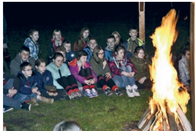
Z HARCERSKIM POZDROWIENIEM CZUWAJ!