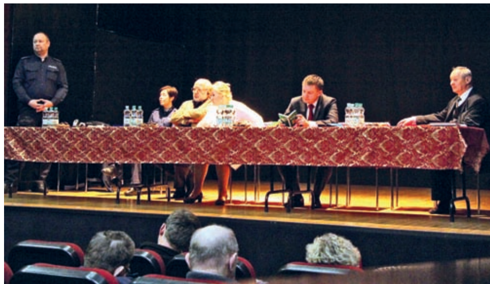
Podczas sobotniego walnego zebrania PZD w Środzie Śląskiej dyskutowano także o bezpieczeństwie.

Więcej informacji na temat działalności ROD, a także wolnych terenów pod dzierżawę ogródków działkowych udziela Zarząd w swojej siedzibie przy ul. Białoskórnicej 1a w Środzie Śląskiej, we wtorki w godz. 11.00-13.00 oraz w czwartki w godz. 15.00-17.00.