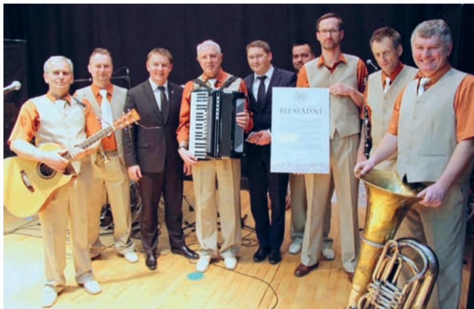
„Biesiadni” podczas jubileuszu odebrali gratulacje i życzenia m.in. od władz Środy Śląskiej.

Nostalgicznie, zabawnie i z przytupem – tak było na muzycznym jubileuszu kapeli podwórkowej „Biesiadni” ze Środy Śląskiej. 8 kwietnia w średzkim Domu Kultury zespół wraz z muzycznymi przyjaciółmi i licznie zgromadzonymi gośćmi oficjalnie świętował 10-lecie swojej działalności artystycznej.