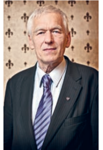
Marszałek Senior RP, Kornel Morawiecki.

Marszałek Senior Sejmu RP, poseł ziemi wrocławskiej Kornel Morawiecki, gościł 7 kwietnia w Średzkim Urzędzie Miejskim. Tematem rozmów z burmistrzem, jego zastępcą i przewodniczącym Rady Miejskiej była m.in. kwestia odwołanej przez GDDKiA budowy sygnalizacji świetlnej na skrzyżowaniu z drogą krajową 94.