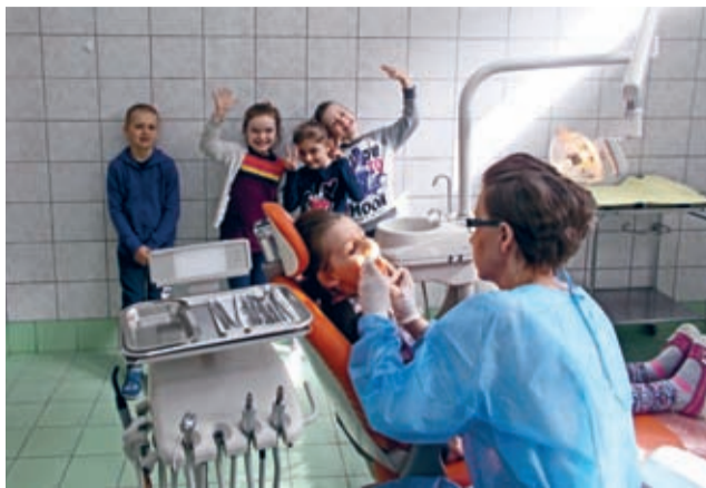
ortodontycznej lub dodatkowego leczenia.

Wszystkie dzieci, których rodzice wyrazili stosowną zgodę, będą miały zrobiony przegląd zębów i zapisane zalecenia, co do ewentualnej konsultacji