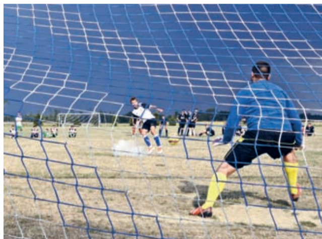
W 2015 roku puchar starosty zdobyła drużyna Czarni Białków, która w rzutach karnych pokonała Tęcze Kwietno

Trzy dni później - 3 maja na boisku w Proszkowie będzie można obejrzeć sportowe zma-