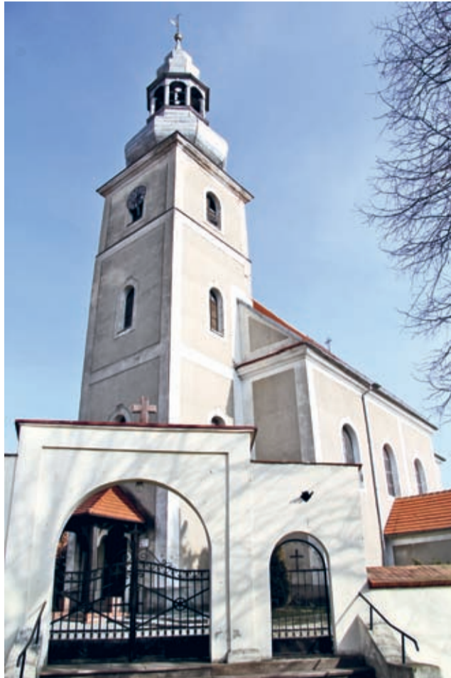
Święte - kościół parafialny.

Parafia w Kulinie dotację z Urzędu Marszałkowskiego Województwa Dolnośląskiego