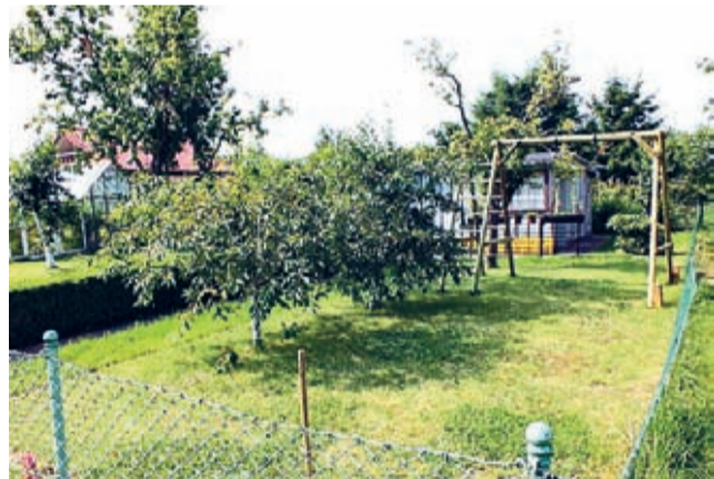
Działka w ROD - rekreacja i satysfakcja.

Wszelkie niezbędne informacje można uzyskać i formalności dopełnić w biurze Zarządu przy ul. Białoskórniczej 1a w Środzie Śląskiej, we wtorki i czwartki, w godz. 15:00-17:00. Zapraszamy, bo warto. (j.l.)