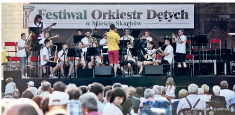
Orkiestry bez trudu zdobyły serca słuchaczy.

Była więc i Maja, i Chałupy, i Bach. Był świetny kontakt z publicznością i morze braw z jej strony.