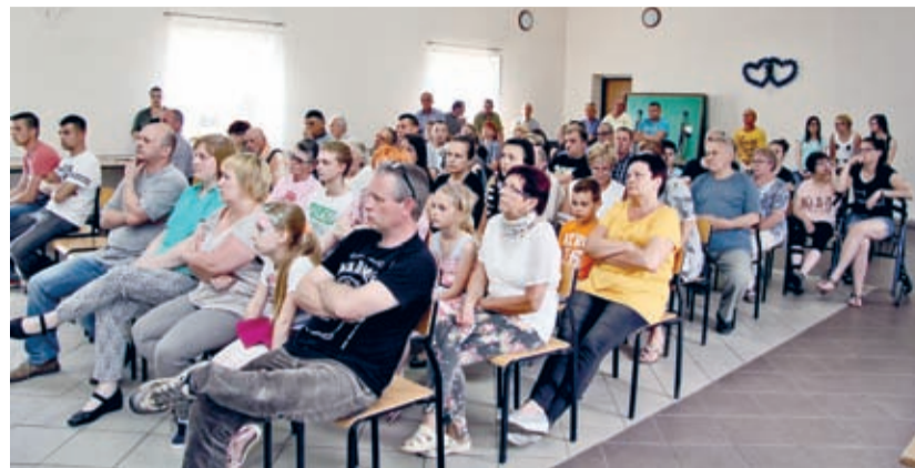
W sobotnie popołudnie na zebraniu wiejskim w Zakrzowie pojawiło się aż 61 mieszkańców.

Blisko połowa uprawnionych do głosowania mieszkańców wsi Zakrzów pojawiła się w świetlicy 28 maja na zebraniu wiejskim. Powodem był wniosek grupy mieszkańców o odwołanie sołtysa miejscowości.