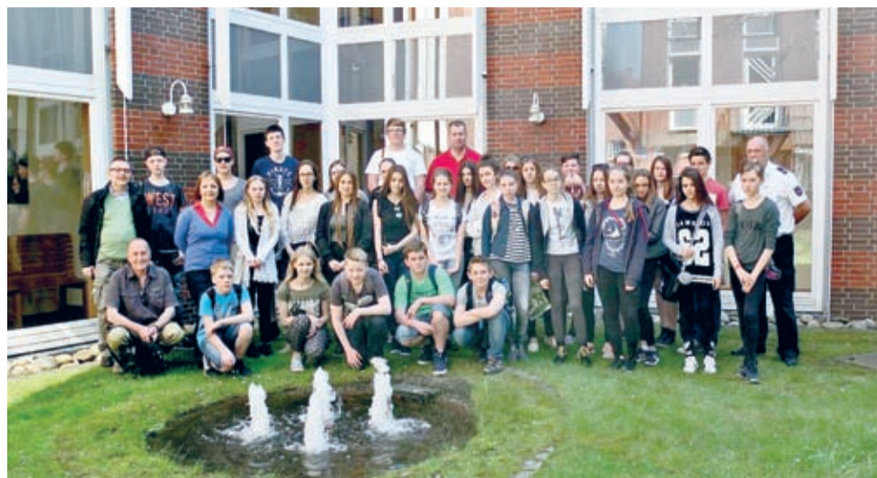
Saterland - pamiątkowe zdjęcie pod ratuszem.