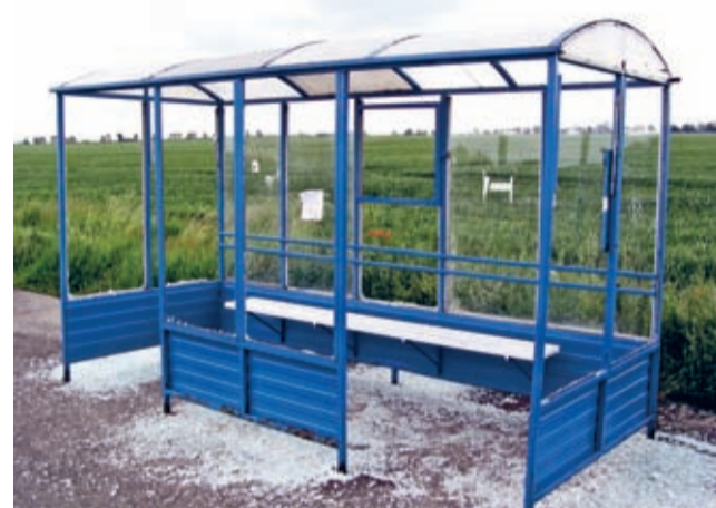
Jak widać, ktoś bardzo się starał...

A swoją drogą, należy mieć nadzieję, że akty tak tępej agresji