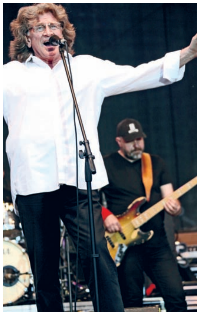
Zbigniew Wodecki - po blisko dwudziestu latach ponownie w Środzie Śląskiej.

Orkiestry bez trudu zdobyły serca słuchaczy. Po raz kolejny, zgodnie ze starą jak historia muzycznych ansambli maksymą,