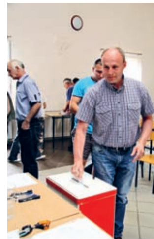
Mieszkańcy głosowali w sposób tajny i zdecydowali: Pani sołtys zostaje na swoim stanowisku.