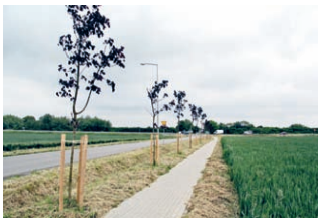
Nowe wiosenne nasadzenie - tu przy drodze do Juszczyna.

Do myślenia dają wyniki badań Światowej Organizacji Zdrowia. Raport WHO jest miazdzący dla Polski. 33 z 50 najbardziej zanieczyszczonych miast UE leży w naszym kraju. To jednak nie wszystkie złe wiadomości. Badania Europejskiej Agencji Środowiska wskazują, że w Polsce