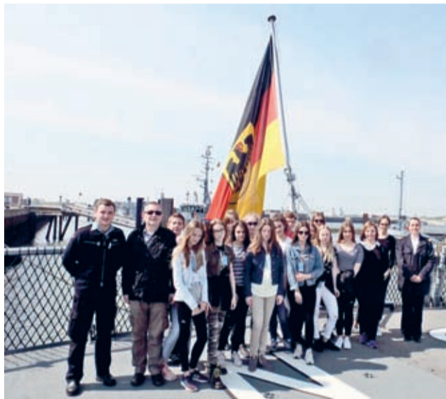
Na fregacie „Sachsen” w porcie marynarki wojennej w Wilhelmshaven.

tu jest przywrócenie tożsamości anonimowym ofiarom terroru. Wyjazd do Niemiec był drugim etapem projektu. Etap pierwszy miał miejsce w listopadzie 2015 r., kiedy to młodzież z Saterlandu przebywała w Środzie Śląskiej.