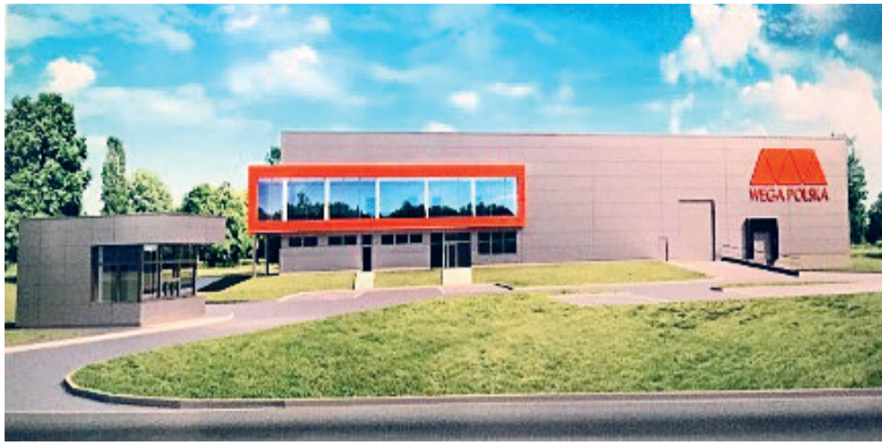
Wizualizacja nowej fabryki Wega Polska w Komornikach.

Rozmowy z włoskim inwestorem trwały kilka miesięcy, a ich ukoronowaniem było pod-