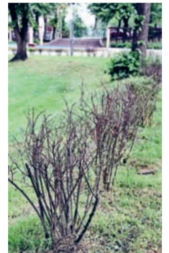
Miało być ładnie i przyjemnie, ale nie do końca wyszło.

A gdyby tak więcej wyobraźni i wiadomości, że park jest nie tylko dla nas? Jak zapewnia średzka Straż Miejska, dzięki planowanej rozbudowie systemu monitoringu, w przyszłości tym i podobnym tematom można będzie przyrzeć się dokładniej - dosłownie i w przenośni.