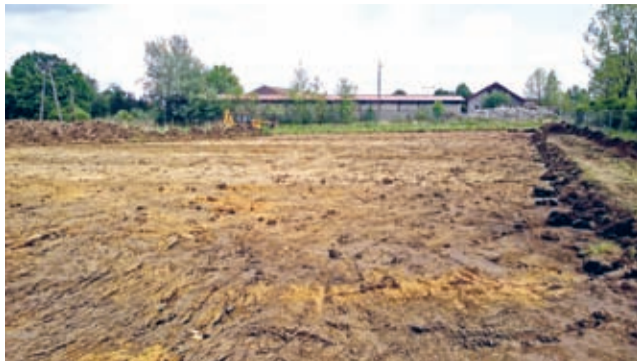
Środa Śląska, ul. Wiejska - aktualnie na miejscu inwestycji trwają prace ziemne.

27 kwietnia przekazano wykonawcy plac budowy. Na terenie gminnym przy ul. Wiejskiej w Środzie Śląskiej (za obwodnicą) Wałbrzyskie Konsorcjum Budowlane sp. z o.o. wybuduje osiedle budynków socjalnych.