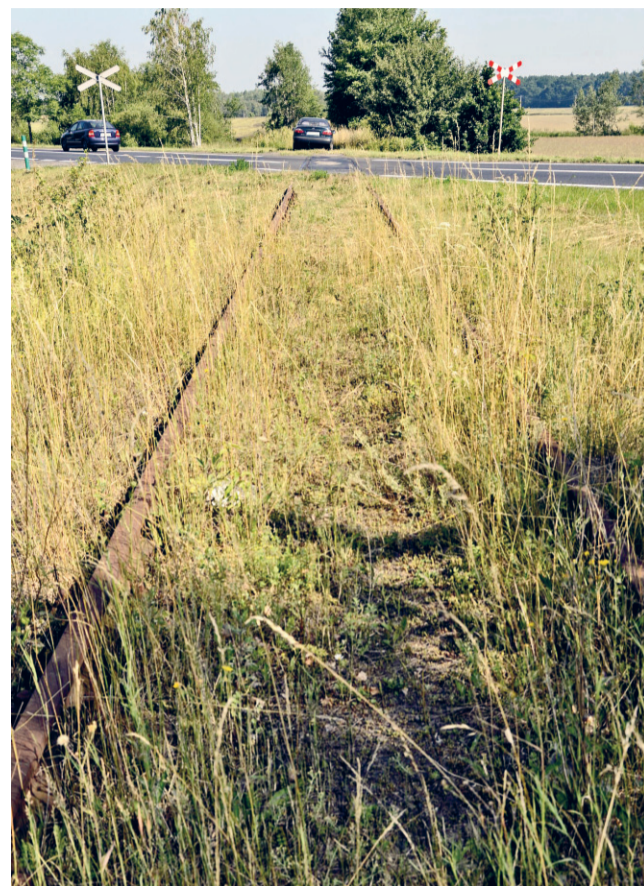
Krzyżówka z drogą krajową 94

Takie właśnie pismo otrzymała w ostatnim czasie spółka PKP Polskie Linie Kolejowe. Założenia ministerstwa znalazły też odbicie w polityce Urzędu Marszałkowskiego Województwa Dolnośląskiego. – W tej sytuacji