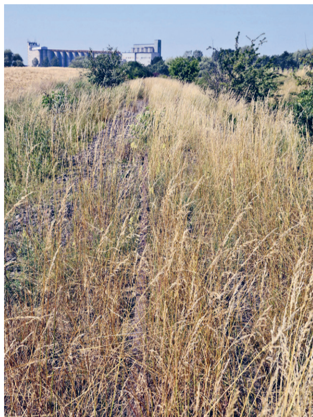
Okolice Ujazdu Dolnego

Choć wszyscy uczestnicy spotkania pozytywnie ocenili pomysł ścieżki i zadeklarowali swoją pomoc, sytuacja nie jest