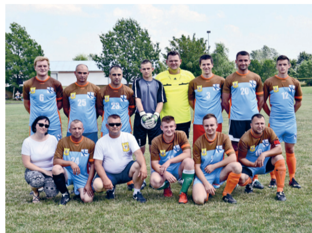
II miejsce TĘCZA KWIETNO

Turniej zakończył się wspólnym oglądaniem meczu Polska-Niemcy.