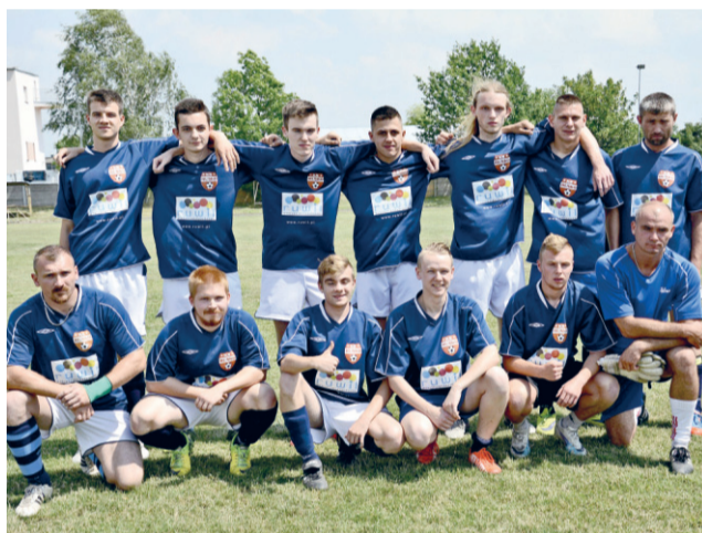
Zwycięzcy KS RUSKO

Ze względu na upał postanowiono, że turniej zostanie rozegrany systemem pucharowym.