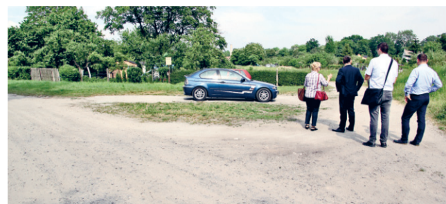
Podczas wizji lokalnej wspólnie ustalono najpilniejsze potrzeby ROD.

Wskazano na nim najważniejsze działania, jakie mają być podjęte przez Zarząd ROD jeszcze w tym roku. Należą do