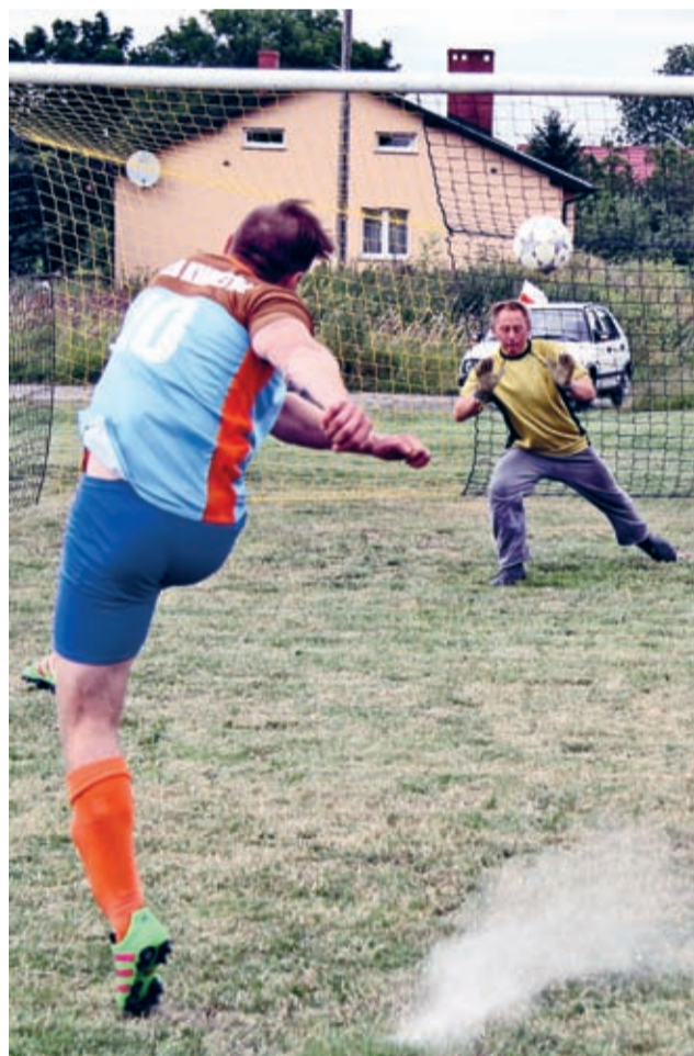
Tak się strzela karne jubileuszowe.

Sześćdziesiąt lat istnienia lokalnej drużyny to dobra okazja do gratulacji i podziękowań. W gronie dziękujących znaleźli się m.in. samorządowcy gminy, powiatu i przedstawiciele PSSPN. Podziękowania od prezesa klubu dostali zawodnicy, dzięki którym kilka tygodni wcześniej Tęcza