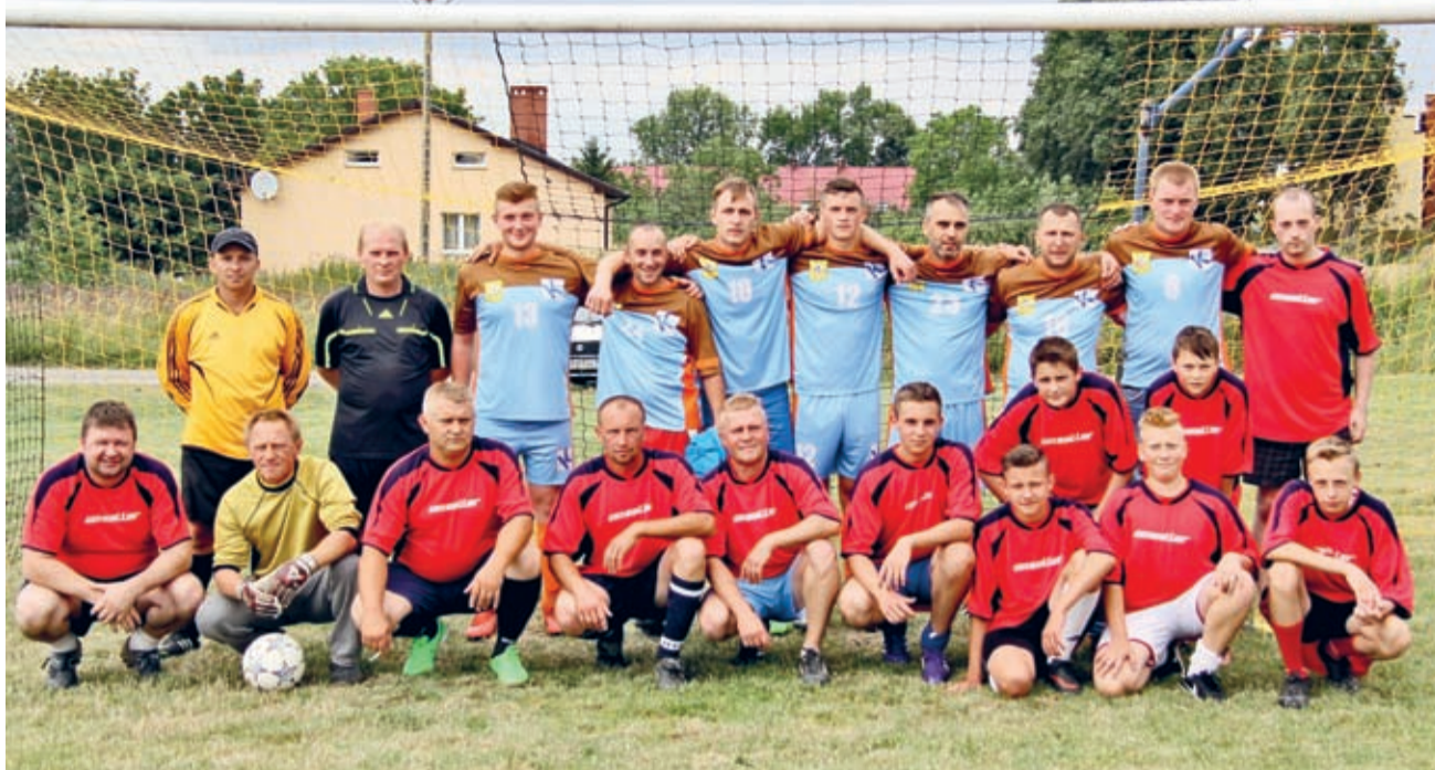
Po meczu towarzyskim i serii towarzyskich karnych - dwie Tęcze na jednym boisku.

Sportowy Dzień Rodziny – organizatorzy gier i zabaw