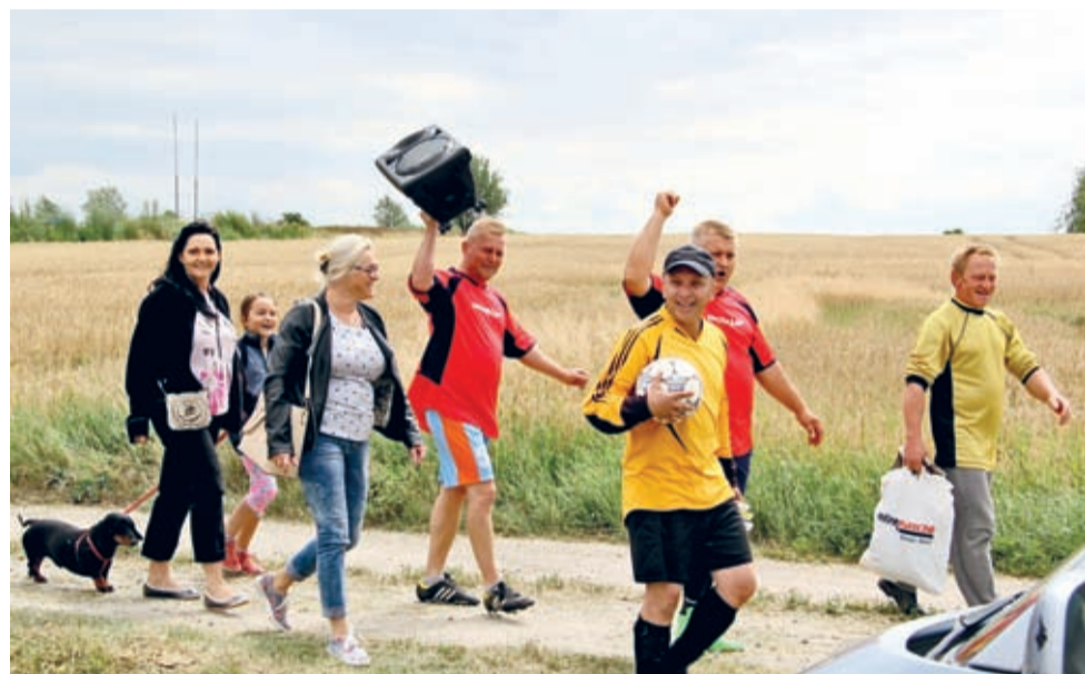
W drodze - gdzieś pomiędzy meczem, a grami i zabawami.

W pierwszym B-klasowym meczu, już 21 sierpnia, Tęcza podejmie na swoim boisku Błyskawicę Lenartowice. A w pierwszej połowie listopada zobaczymy pojedynek Tęczy Kwietno z Tęczą Pisarzowice. Już teraz trzymamy kciuki. (j.l.)