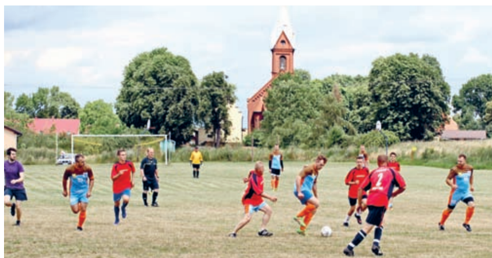
W pierwszym B-klasowym meczu, już 21 sierpnia, Tęcza podejmie na swoim boisku Błyskawicę Lenartowice.