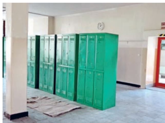
Wiele placówek wykorzystuje czas wakacyjny m.in. na malowanie klas i korytarzy.

Prace remontowe i inwestycyjne w szkołach, przedszkolach i żłobkach w Gminie Środa Śląska wkraczają w ostatnią fazę – do końca wakacji pozostały niespełna trzy tygodnie.