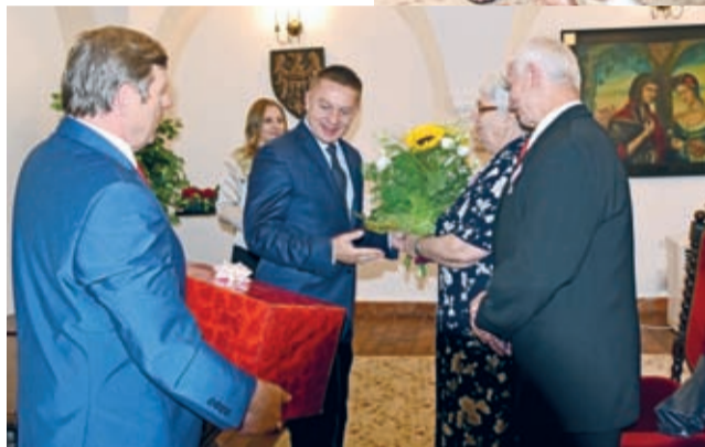
Jubileuszowy upominek od samorządu dla dostojnych jubilatów.