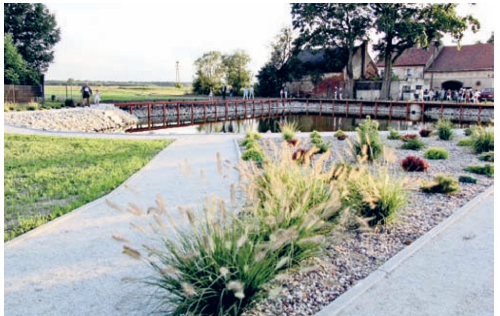
Centralnie położony staw w Jugowcu to teraz prawdziwa wizytówka miejscowości.

Uroczystości otwarty 6 sierpnia staw w Jugowcu to doskonały przykład efektywnej współpracy między mieszkańcami.