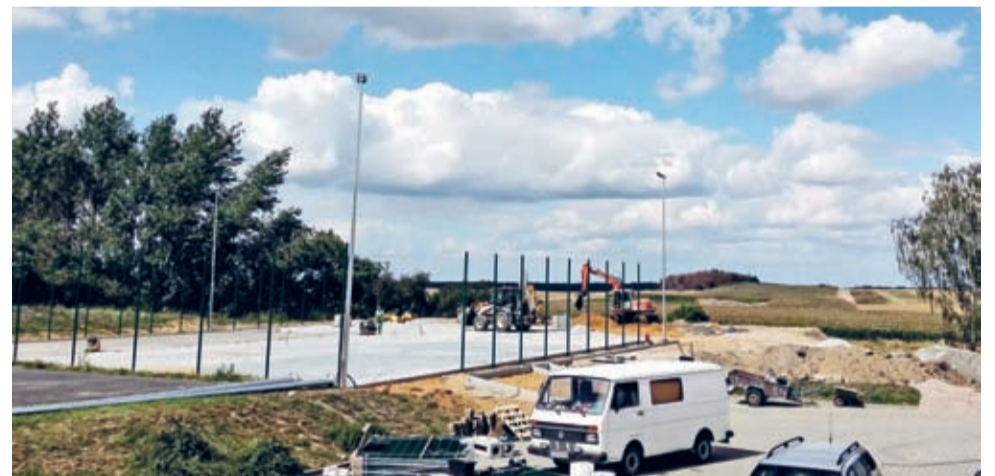
W Rakoszycach trwają prace przy budowie Orlika.

- Wartość tej inwestycji w Rakoszycach sięga 608 tys. zł. Pozyskaliśmy na ten cel w tym roku 140 tys. zł z Programu Rozwoju Bazy Sportowej Województwa Dolnośląskiego. Łącznie w szkołę w Rakoszycach zainwestujemy w tym roku prawie 750 tys. zł – mówi burmistrz Adam Ruciński.