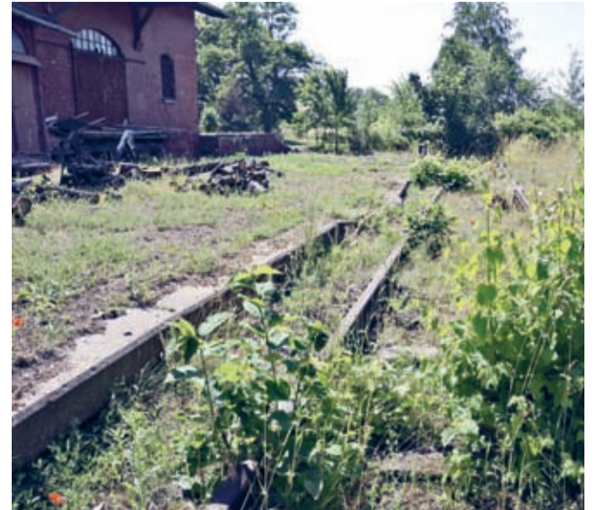
Tory kolejowe to już rzadkość...

– Nie składamy bronii. Podobna sytuacja miała miejsce na Pomorzu, i tam udało się zmienić niekorzystne rozstrzygnięcie. Obserwujemy sytuację