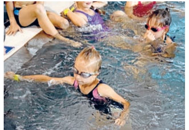
Piłce Nożnej. Organizatorem obu turniejów była Rada

W Centrum Sportu i Rekreacji od godz. 10:00 rozgrywane były Dolnośląski Finał LZS „Puchar Lata” – Orlik 2016, a od 14:00 I Średzkie Mistrzostwa Drużyn Mieszanych w