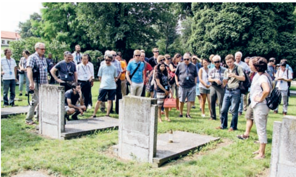
Przedstawiciele świata nauki z sześciu kontynentów na wojennym cmentarzu w Środzie Śląskiej.

Wizyta w Środzie Śląskiej przebiegała trzyetapowo. Goście zwiedzili Muzeum Regionalne z ekspozycją Skarbu Średzkiego - Skarbu Tysiąclecia, obejrżeli najciekawsze miejskie zabytki, a także weszli na wieżę kościoła św. Andrzeja, by na Dolny Śląsk popatrzeć z góry. Odwiedzili również cmentarz żołnierzy radzieckich poległych w ostatnich miesiącach II wojny światowej, czy to bezpośrednio w czasie walk z hitlerowcami, czy też