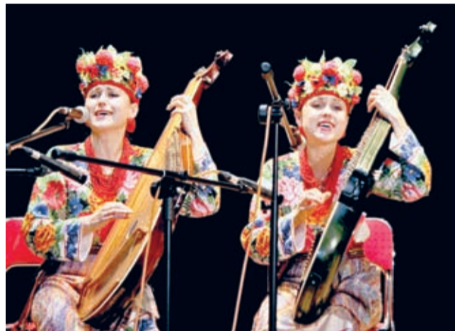
Duet bandurzystek zrobił na słuchaczach ogromne wrażenie.

słuchaczom ballady, polskie pieśni patriotyczne i znane przeboje.