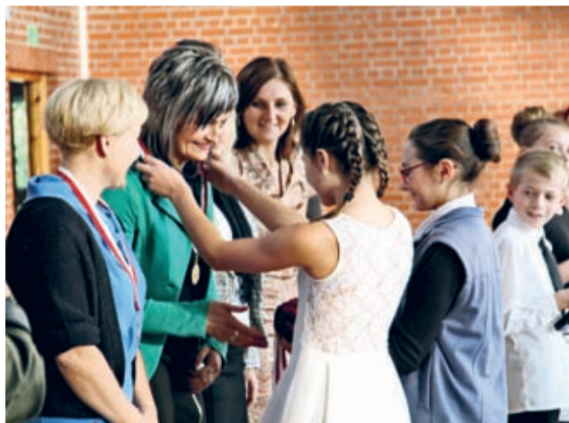
Nauczyciele ZS w Szczepanowie z dumą odbierali z rąk uczniów medale z napisem „Najlepszy Nauczyciel”.

Szkół im. Piastów Śląskich w Szczepanowie. Szóstoklasiści z humorem opowiedzieli o szkolnych przygodach, a następnie