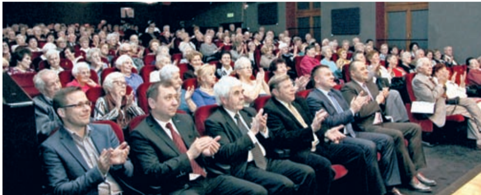
Dla wielu seniorów spotkanie w Domu Kultury było sentymentalną podróżą na Kresy.

„Bliźniaczki” z Równego (Ukraina), prezentując