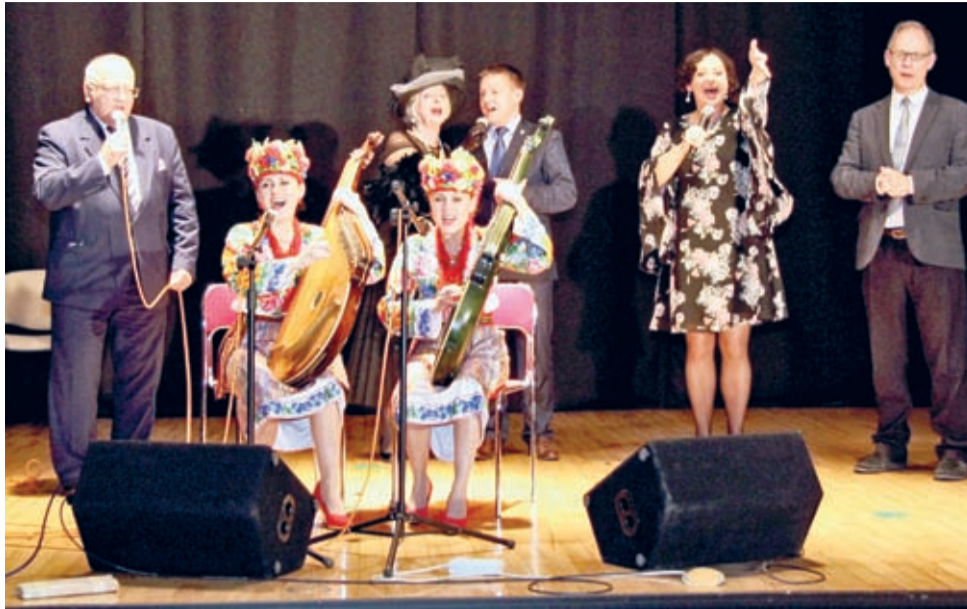
Artyści, zaproszeni goście oraz wszyscy zebrani wspólnie wykonali finałowy utwór „Hej sokoły!”.

Podczas obchodów Międzynarodowego Dnia Seniora w Środzie Śląskiej, 18 października, uczestnicy wybrali się w sentymentalną podróż na Kresy II Rzeczypospolitej. Stało się to za sprawą wyjątkowego koncertu wokalnoinstrumentalnego w ramach XV Legnickich Dni Kultury Kresowej.