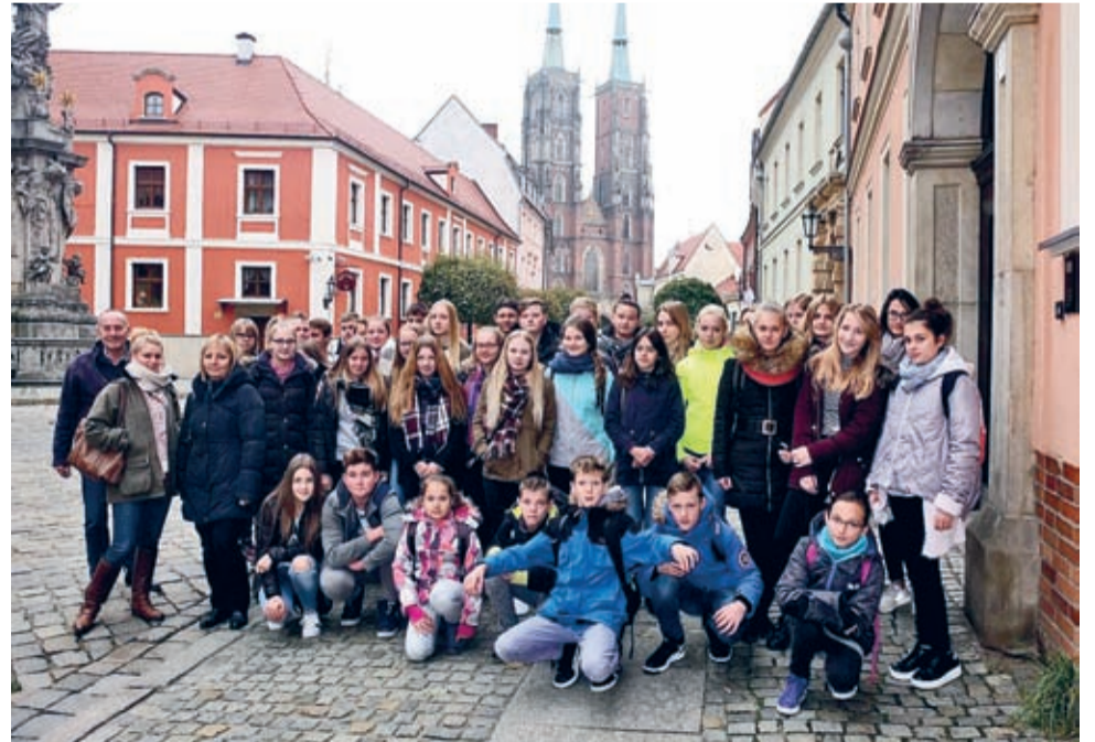
Podczas tygodniowego pobytu młodzież wspólnie zwiedzała m.in. nasze miasto i Wrocław.

Podczas realizacji projektu nieprzerwanie od 1996 roku uczestniczyło w nim ponad 900 uczniów z obydwu gmin. W tym czasie szkoły przeprowadziły także wiele innych projektów UE, które były bardzo dobrze przyjęte oraz zakończyły się naszym wspólnym sukcesem. Te projekty to min. Sokrates - Comenius, Comenius Regio, Marko Polo oraz projekt MSZ Niemiec Fundacji eVZ. Z pewnością wszystkie te projekty przysłużyły się temu, iż nasza gmina oraz szkoły na