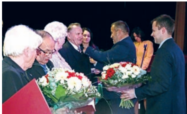
medale „Za długoletnie pożycie małżeńskie”.