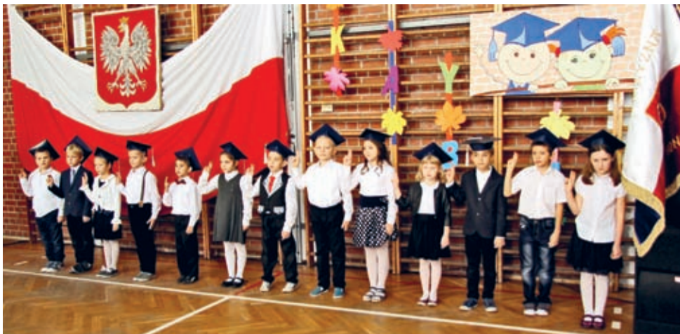
Uroczyste ślubowanie uczniów klasy pierwszej ZS w Szczepanowie.

Trzydziestu „pierwszaków” z Zespołu Szkół im. Piastów Śląskich w Szczepanowie stało się już pełnoprawnymi uczniami szkoły. Wszystko za sprawą uroczystego pasowania, które odbyło się w placówce 28 października.