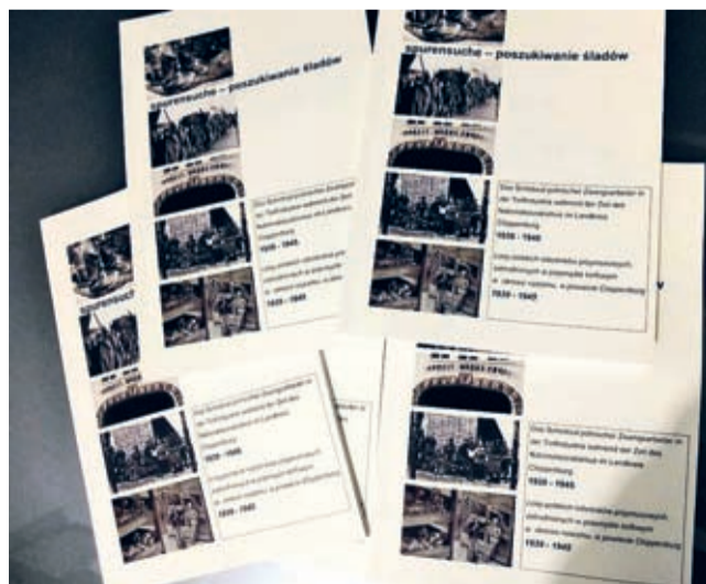
W bieżącym roku ukazała się publikacja dotycząca pracy przymusowej polskich robotników na terenie Saterlandu podczas II wojny światowej.