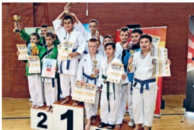
Zawody zorganizował pod patronatem Prezydenta Legnicy Klub Karate Shotokan „TORA” Legnica.

Znakomicie spisali się średzcy karatecy podczas XXVI Mistrzostwach Ziemi Legnickiej w Karate WKF. Tym razem ich udany start miał miejsce 29 października w Legnicy.