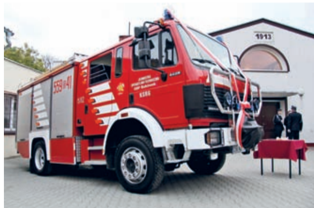
Mercedes Benz 1429 - nowy sprzęt w OSP Bukówek.