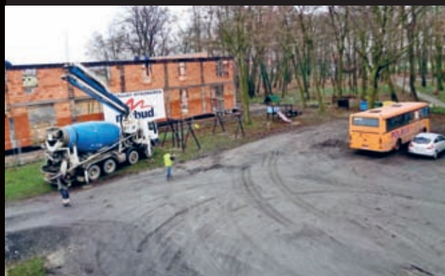
Foto-nowinki z budowy szkoły w Lutyni

Mimo niekorzystnych warunków atmosferycznych prace związane z budową zespołu szkolno-przedszkolnego w miejscowości Lutynia postępują zgodnie z harmonogramem.