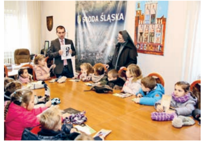
Żabki w gabinecie burmistrza.

Jeszcze nie opadły emocje po Dniu Pluszowego Misia w Bibliotece Publicznej, a już grupa Żabek z przedszkola sióstr Salezjanek w Środzie Śląskiej wyruszyła na kolejną miejską wyprawę. 28 listopada przedszkolaki złożyły wizytę w magistracie.