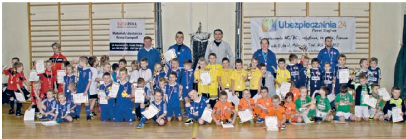
Dumni zawodnicy wraz z trenerami i organizatorami turnieju.