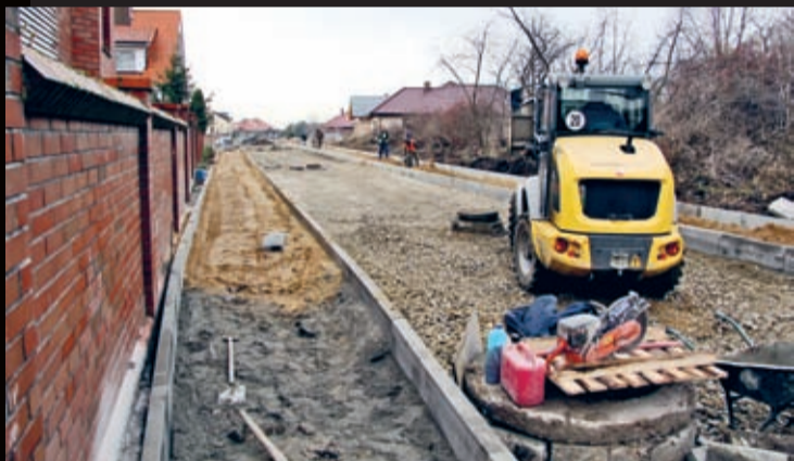
Wymiana nawierzchni na fragmentach ulic Probusa i Brodatego w Środzie Śląskiej