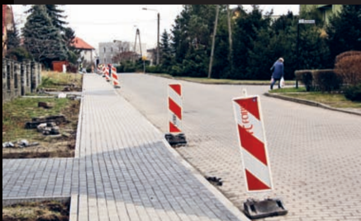
Przebudowa chodników przy ul. Szkolnej i Marii Curie - Skłodowskiej w Środzie Śląskiej

Łączna wartość realizowanych lub kończonych obecnie inwestycji wynosi ponad 4 mln zł. Poniżej prezentujemy zdjęcia wybranych zadań podczas realizacji.