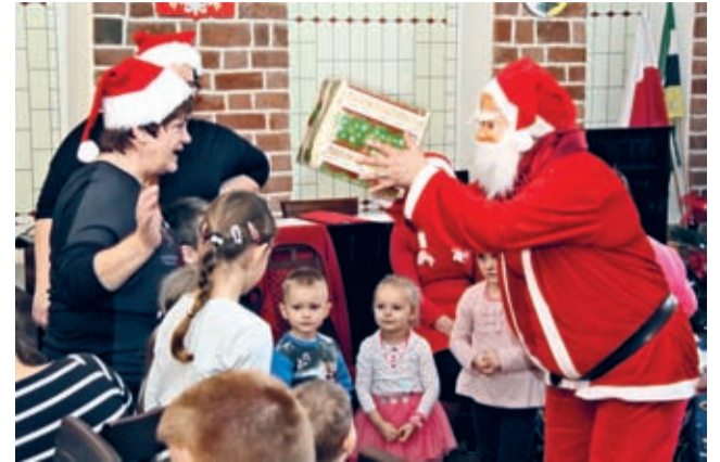
Na początku grudnia św. Mikołaj odwiedził także średzki ratusz.

Realizacja projektu to jedna z form integracji rodzin podopiecznych GOPS z pracownikami socjalnymi i kultywowanie