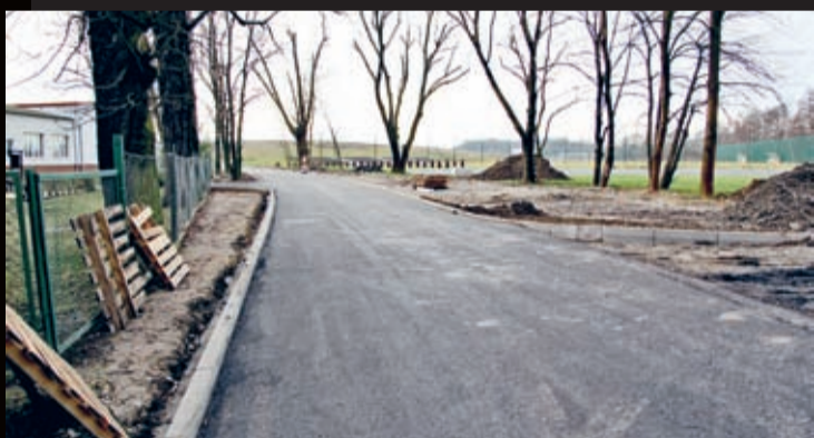
Wymiana nawierzchni na asfaltową na wjeździe i parkingu przy Zespole Szkół w Ciechowie