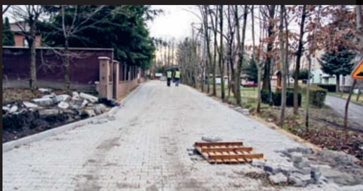
Modernizacja wjazdu na posesję przy ul. Mostowej 20 w Środzie Śląskiej