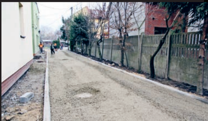
Modernizacja wjazdu na posesję przy ul. Malczyckiej 4 w Środzie Śląskiej