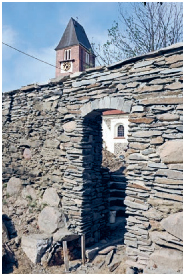
Nowa stara furta w murze - architektoniczna ciekawostka.

Prace wykonane do tej pory nie tylko pozwoliły na wzmocnienie i ustabilizowanie muru. Przyczyniły się także do swego rodzaju odkryć i ujawnienia zapomnianych ciekawostek.