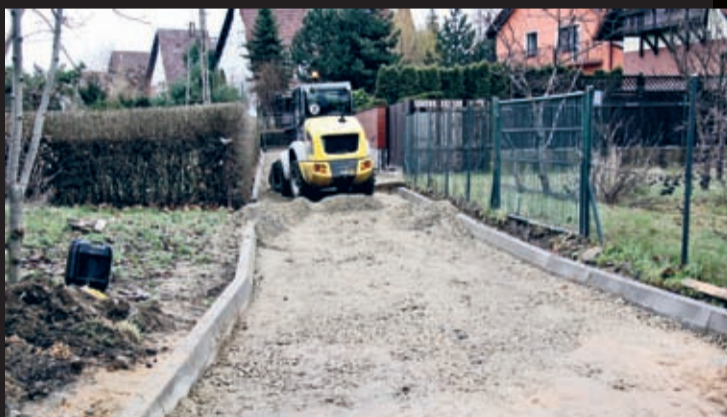
Przebudowa łącznika przy ul. Wierzbowej w Środzie Śląskiej