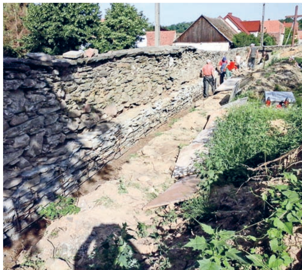
Cesarzowice - mur, który łączy.