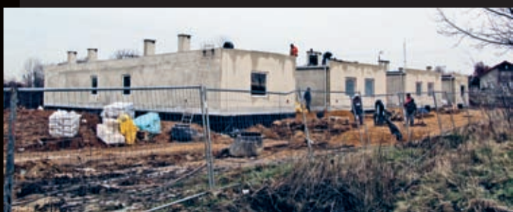
Prace przy pierwszym etapie budowy osiedla socjalnego przy ul. Wiejskiej w Środzie Śląskiej