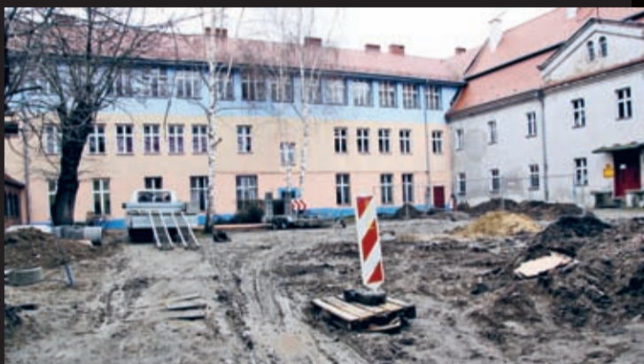
Przebudowa nawierzchni podwórka przy ul. Kościuszki 60 w Środzie Śląskiej