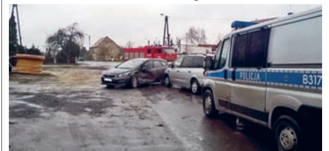
11 grudnia doszło do kolizji dwóch samochodów osobowych w miejscowości Chomiąży. Nikomu nic się nie stało. OSP Malczyce