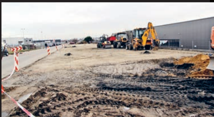
Budowa parkingu w podstrefie LSSE w Komornikach