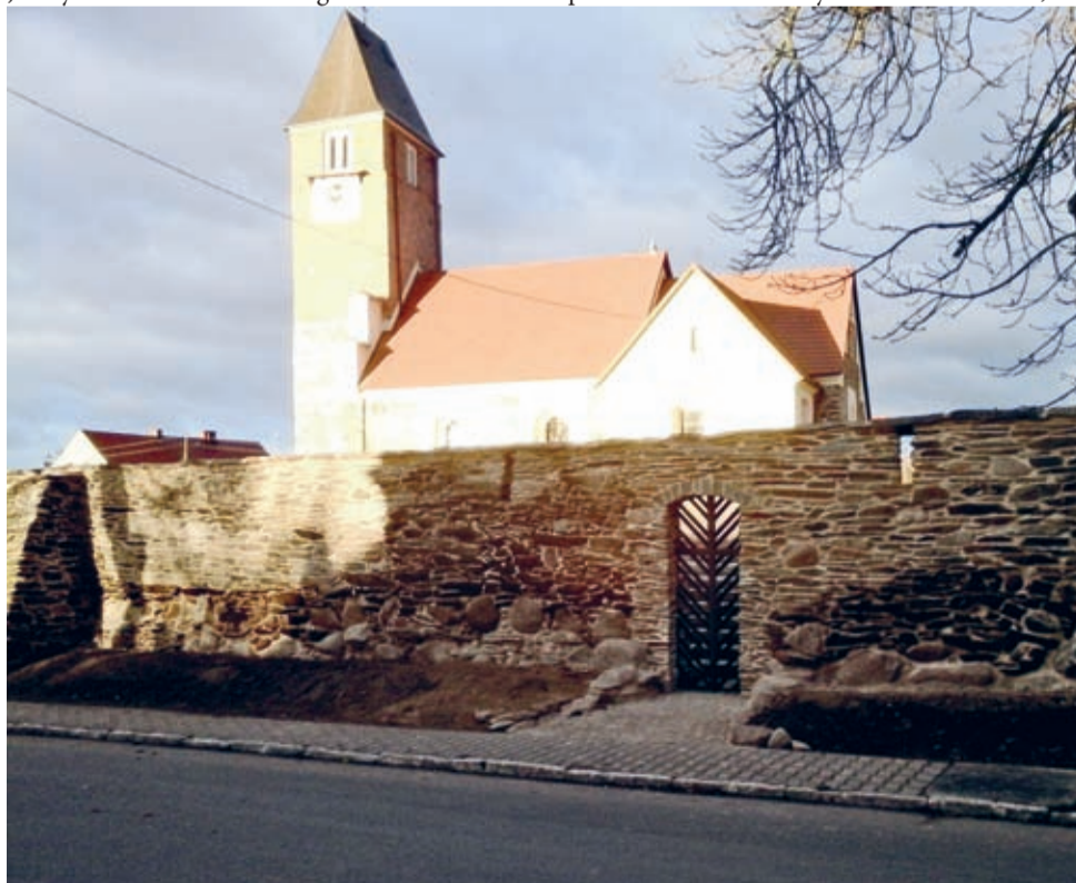
Kościół św. Marcina w jesienno-zimowym słońcu.

Jak wiemy z historii czy literatury mury często bywają symbolem czy powodem niezgody, kłótni, podziałów. Mur w Cesarzowicach łączy. Łączy ludzi, którzy chcą zrobić coś dla swojej małej ojczyzny. (j.l.)