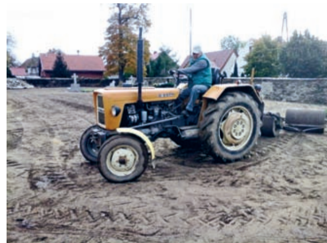
Dla wspólnej sprawy - mobilizacja sił i środków.

czasie chęć pomocy, będzie miał taką szansę. Z kronikarskiego obowiązku można jeszcze dodać, że w ostatnim czasie dzięki zaangażowaniu m.in. lokalnej społeczności udało się w kościele św. Marcina wykonać całkowitą