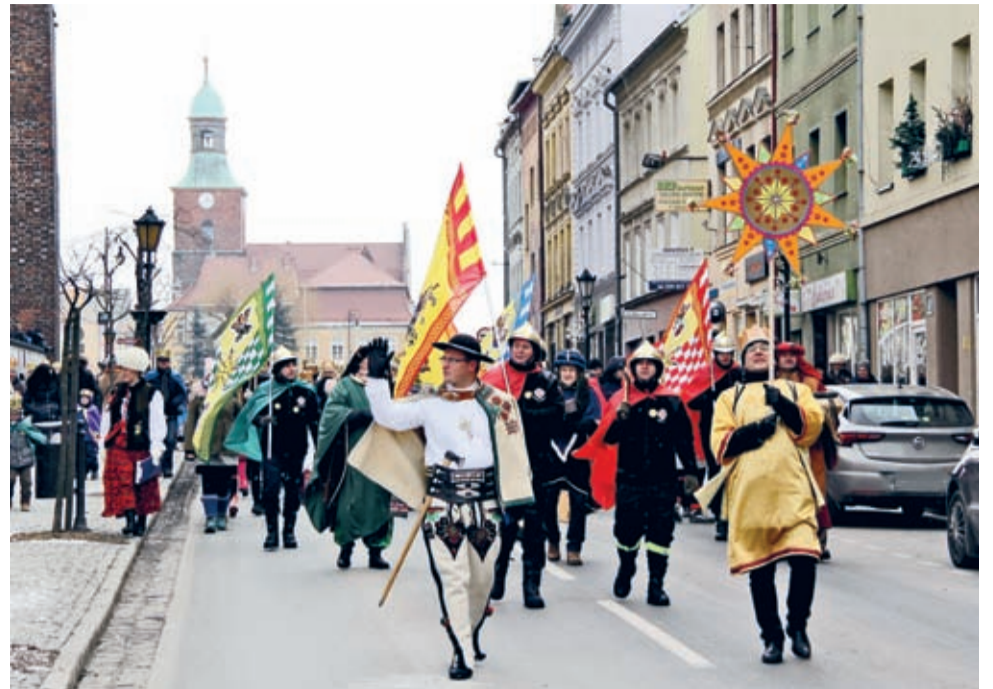
6 stycznia za gwiazdą betlejemską po raz pierwszy ruszyli także mieszkańcy Środy Śląskiej.

przemianowana została na OSP Betlejem. Tuż z nimi dostojnie kroczyli Trzej Królowie, a z kolei za Królami długie szeregi średzian, wierznych z obu średzkich parafii. Na trasie na uczestników czekały z występami anioły, czekali kolędnicy i przedszkolaki. Ku niebu płynęły koledy i pastorałki.