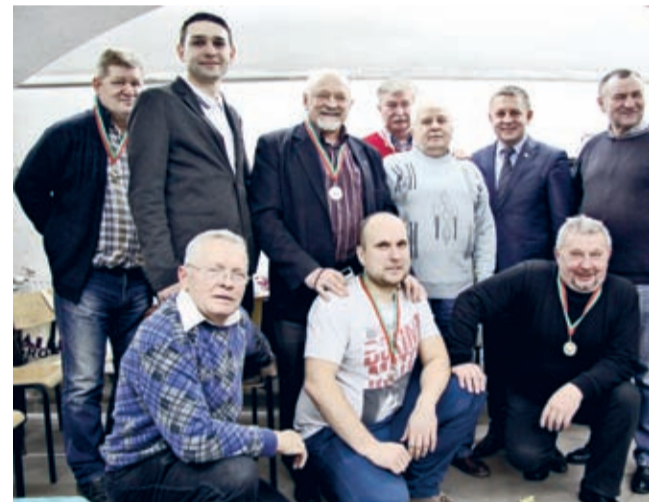
Dwudziestą trzecią edycję powiatowej brydżowej Grand Prix o zakończono i podsumowano.

Podsumowano dwudziestą trzecią już edycję brydżowej Grand Prix powiatu średzkiego. Brydżowa staż najwytrwalszych uczestników rozgrywek zamknął by się z pewnością w imponujących stuleciach. Dla wszystkich chyba piątkowe popołudnie to termin święty - respektowany przez rodziny i najbliższych. To się nazywa pasja.