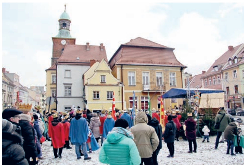
Finał Orszaku w centrum Środy.

ORSZAK TRZECH KRÓLI to: największe Jasełka na świecie, to: działania edukacyjne i kulturalne, to: przywracanie tradycji, to: oddolne inicjatywy lokalne, to: efekt działania zwykłych ludzi, to: „Kolos, który co roku budzi się 6 stycznia...”