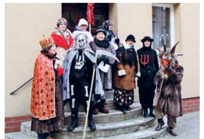
Kolędnicy na Kościuszki.

Na skwerze w centrum miasta odbył się finał Orszaku. W szopce czekała Święta