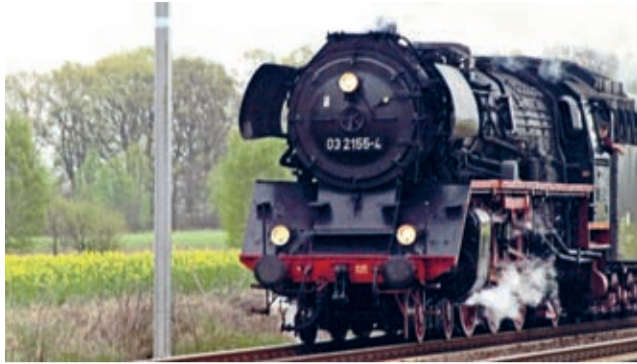
DB 03 2155-4 - pod parą w czasie wojny i pokoju. Także koło Środy.

MK to nie zawsze skrót nazwy kawy. To także skrót od określenia miłośnik kolei, a więc lokomotyw, wagonów, pociągów i całej kolejowej infrastruktury. Dużo powodów do zadowolenia dostarcza fanom kolejnictwa także przebiegająca koło Środy Śląskiej magistrała kolejowa - nowoczesna i międzynarodowa.