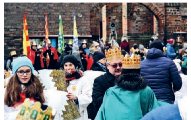
Orszak wyruszył spod wieży kościoła św. Andrzeja.

— Przygotowania rozpoczęły się w momencie zgłoszenia Środy do udziału w Orszaku, czyli już w październiku. Najpiękniejsze w takich inicjatywach jest