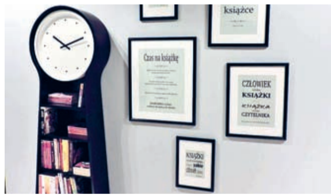
„Czas Na Książkę” w Środzie Śląskiej.

W styczniu wykonano prace remontowe w holu głównym Biblioteki Publicznej w Środzie Śląskiej.