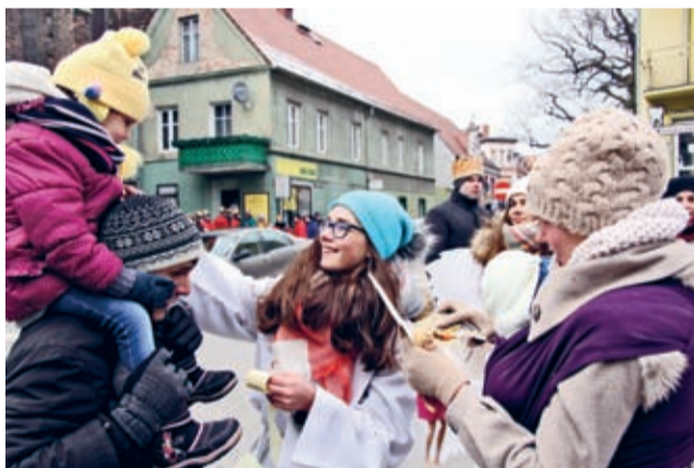
Wolontariusze - hej!

Przeszedł ulicami Legnicką, Żwirki i Wigury, Kościuszki i Korwina. Placem Wolności dotarł na skwer z fontanną. Za „Gwiazdorem” i gwiazdą szli chorążowie z orszakowymi sztandarami. W tej roli sprawdzili się druhowie z ochotniczej straży pożarnej. Co więcej, na czas Orszaku jednostka OSP Bukówek