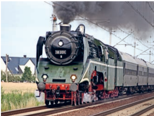
DR 18 201 - najszybszy parowóz świata złapany w kadr pod Środą Śląską.

Z tego co słychać tu i ówdzie, rok 2017 powinien być pod względem ciekawych przejazdów równie obiecujący co 2016. Sprawdźmy. (j.l.)