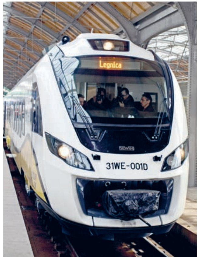
Pierwsze Impulsy z Newagu na trasie ze Wrocławia do Legnicy przez Środę Śląską pojawiły się 1 kwietnia 2013 r.

W trakcie spotkania, w ramach kampanii społecznej „czad i ogień – obudź czujność” przedstawiono zagadnienia związane z zagrożeniem pożarowym i zatruciem tlenkiem węgla w miejscu zamieszkania; omówiono zasady działania autonomicznych czujek tlenku węgla i dymu. Ponadto, w związku z trwającym okresem zimowym