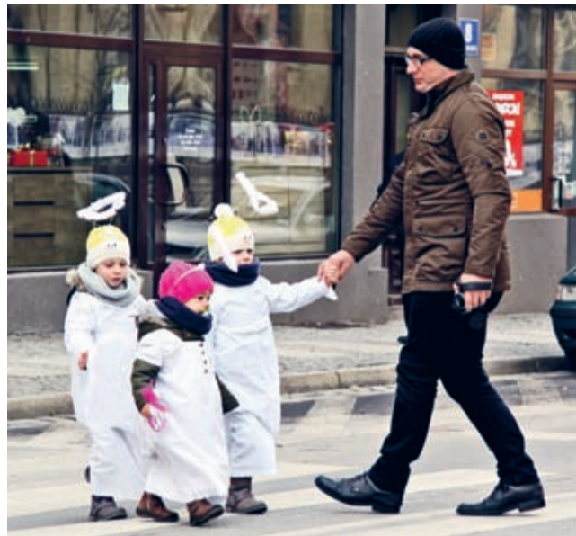
Just like a heaven - jest jak w niebie. Nieprawdaż?

Czy można zobaczyć gwiazdę w samo południe? Co więcej, czy można ruszyć za nią i cały czas być blisko? Niby nie, a jednak. W ponad 500 miastach, miasteczkach i mniejszych miejscowościach Polski 6 stycznia przeszły kolorowe, rozśpiewane Orszaki Trzech Króli.