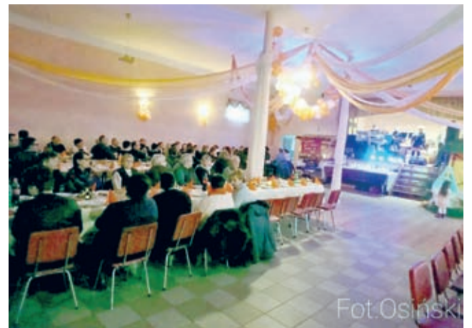
Kołędowanie w świetlicy w Brodnie

Świetlica wiejska w Brodnie wypełniła się w niedzielę, 22 stycznia, dźwiękami kolęd i zapachem domowych wypieków. Wszystko za sprawą zorganizowanego tu już po raz drugi świątecznego kołędowania.