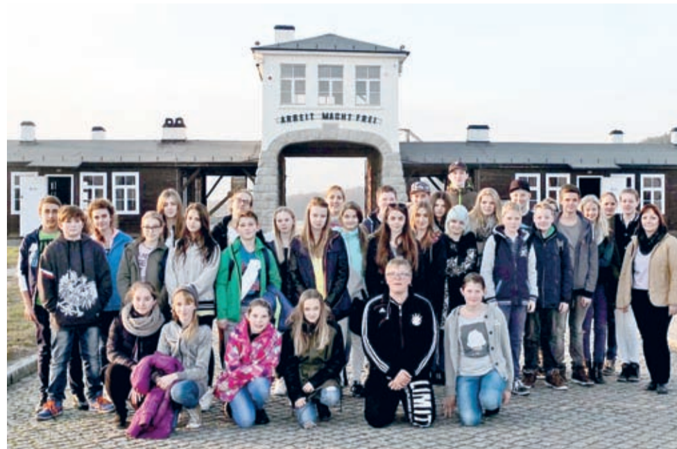
Rogoźnica - Gross Rosen. Cała polsko-niemiecka grupa uczniów biorących udział w projekcie EVZ, podczas pobytu w Polsce w listopadzie 2015 r.

Uczestnicy wymian młodzieży ale też dorośli (już ponad 900 osób - przyp. aut.) wielokrotnie odwiedzali i oglądali miejscowe atrakcje. Tym