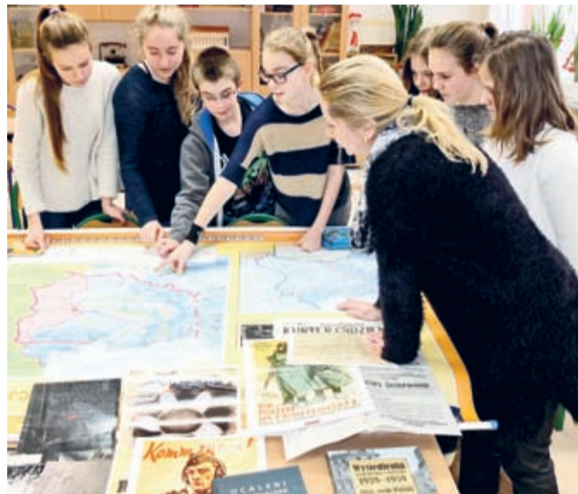
Uczniowie Szkoły Podstawowej nr 3 w Środzie Śląskiej podczas zajęć kółka historycznego, w ramach którego uczestniczyli w projekcie.

Sąsiada dobrze mieć - to wiadomo. Wiadomo też jednak, że nierzadko wzajemne stosunki bywają dalekie od dobrosąsiedzkich. Tego uczy np. historia Polski i Niemiec, bliskich sąsiadów i w wielowiekowej przeszłości często antagonistów.