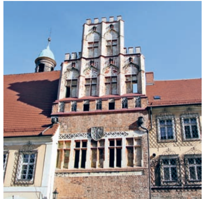
Elewacja frontowa średzkiego ratusza.

Zakres prac obejmuje przeprowadzenie robót budowlanych w całym zespole ośmiu budynków dawnego ratusza w Środzie Śląskiej. Będą to zarówno roboty izolacyjne, jak i blacharskie, malarskie, renowacyjne i impregnacyjne. Zamontowany zostanie podjazd dla osób niepełnosprawnych, renowację przejdą zegary na wieży oraz dziedzińiec. W projekcie ujęto także