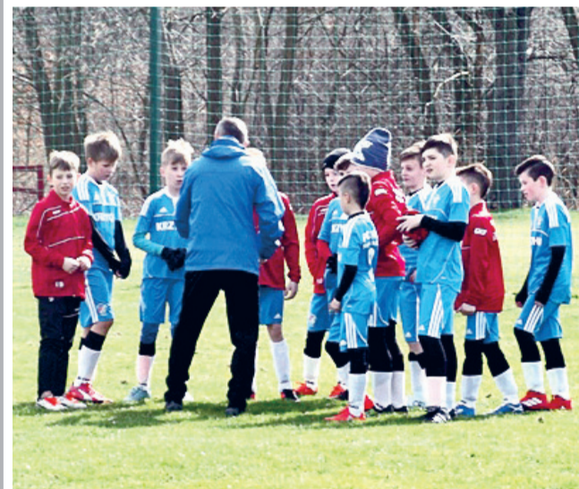
Polonia Środa Śląska - GKS Kobierzyce