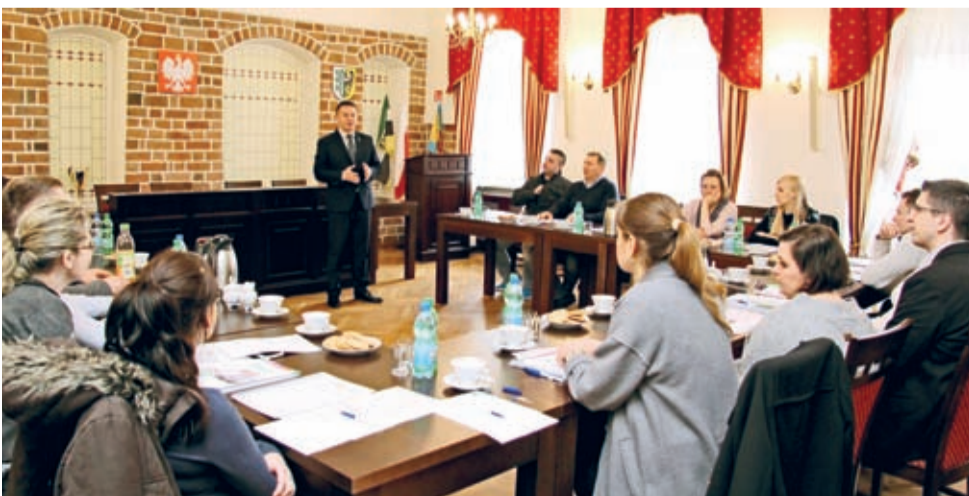
Przedsiębiorcy korzystali z warsztatów w sali konferencyjnej Urzędu Miejskiego.

Szkolenia przyjęły formę warsztatów, dzięki czemu uczestnicy mogli przyrzeć się bliżej zasadom wypełniania wniosków oraz zadać nurtujące ich pytania osobom prowadzącym. Spotkania zrealizowano przy współpracy z Powiatowym Urzędem Pracy w Środzie Śląskiej wspierającym rekrutację uczestników oraz Biurem Terenowym Zakładu Ubezpieczeń Społecznych.