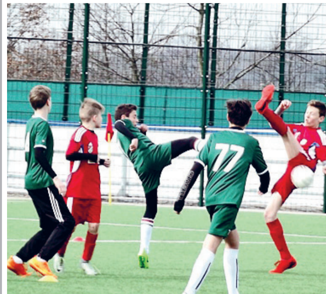
Polonia Środa Śląska - WKS Śląsk Wrocław

W sobotę 25 marca rozgrywki ligowe rozpoczęli trampkarze i młodzicy z Ligi Terenowej, a drugi mecz ligowy zagraли już podopieczni trenera Żerelika. Na boisku Centrum Sportu i Rekreacji trampkarze pokonali 6:1 Świtez Wiązów, młodzicy trenera Żerelika wygrali 4:0 ze Śląskiem Wrocław, a podopieczni trenera Masalskiego ulegli GKS Kobierzyce 1:6!