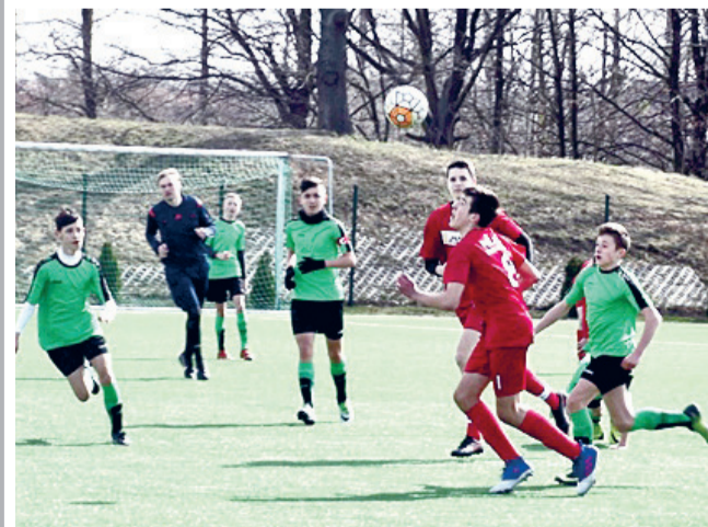
Polonia Środa Śląska - Świtez Wiązów

Radosnych, zdrowych i pełnych wiosennego słońca Świąt Wielkiej Nocy