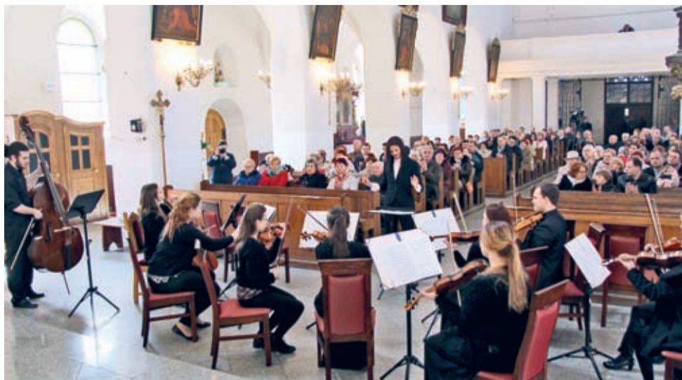
Artyści z Akademii Muzycznej we Wrocławiu zachwycili średzich słuchaczy.

Studenci i wykładowcy Akademii Muzycznej im. Karola Lipińskiego we Wrocławiu wystąpili w niedzielę, 26 marca w kościele pw. św. Andrzeja Apostoła w Środzie Śląskiej. Koncert Wielkopostny zgromadził licznych słuchaczy.