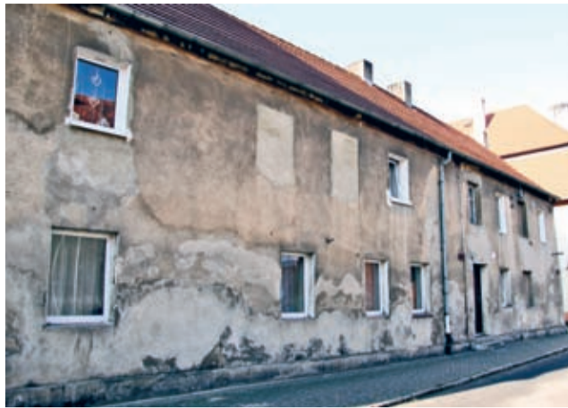
Tak budynek mieszkalny przy ul. Daszyńskiego 20 wygląda dziś, przed remontem.

Przedmiotem projektu są roboty budowlane związane