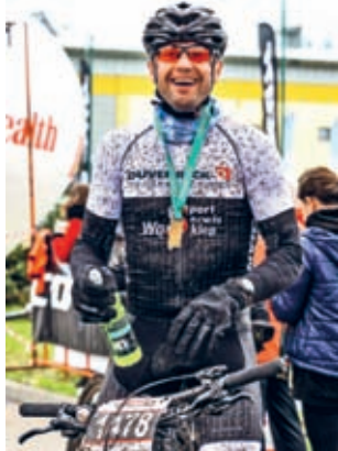
Radość na mecie

błota, w rozmaitych ilościach. Na koronnym dystansie GIGA (77 km z przewyższeniem 770 m) rywalizacja była zacięta, a poziom wyrównany. Trudność trasy i błoto miały niebagatelny wpływ na przetasowania