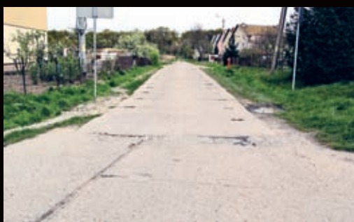
Droga na bloki w Jastrzębach również remontowana będzie w technologii dróg transportu rolnego.