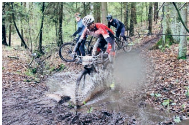
Zmagania na trasie

Tłumy kolarzy zjechały w drugi weekend kwietnia do Miękini, aby wspólnie zainaugurować nowy sezon Bike Maratonu. Mimo mało sprzyjającej pogody (zaledwie kilkanaście stopni Celsjusza) i trudnych warunków na trasie po kilkudniowych opadach deszczu miłośnicy rowerowych zmagania nie zawiedli.