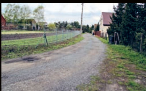
Jeden z odcinków remontowany będzie także w Przedmościu.