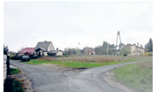
Nowe oświetlenie drogowe powstanie m.in. w Mrozowie

W ramach inwestycji wykonane zostanie oświetlenie ledowe w następujących lokalizacjach: Brzezina (ul. Kopernika, ul. Lipowa, ul. Dębowa, ul. Działkowa), Mrozów (ul. B.