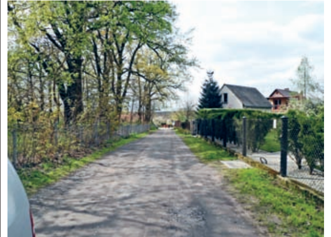
Wśród przebudowywanych dróg znajdzie się również ul. Parkowa w Mrozowie

Ruszył przetarg na przebudowę dróg gminnych w dziewięciu miejscowościach w gminie Miękinia. Przejazd nowymi asfaltowymi nawierzchniami zaplanowano na koniec września br.