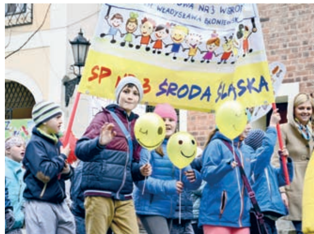
2013 - „Zdrowe bicie serca”