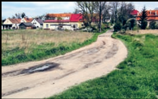
Przeznaczony do remontu odcinek drogi w Krynicznie.