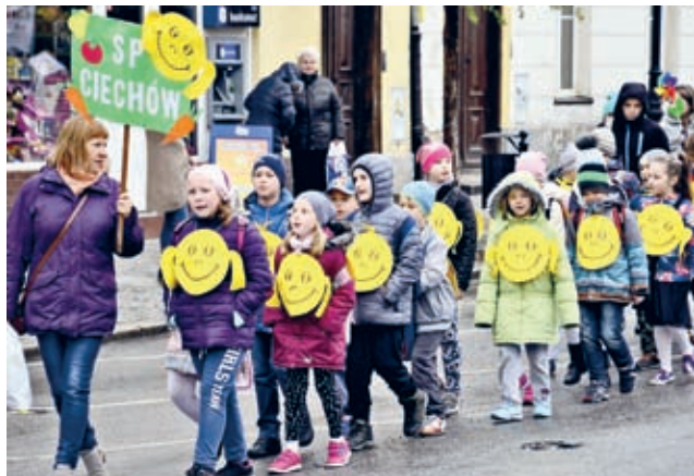
oraz Polski Czerwony Krzyż. (rfp)

Druga część obchodów odbyła się w domu kultury i była nią Powiatowy Przegląd Artystyczny. Dzieci śpiewały, recytowały i tańczyły, a wszystko to w kontekście zdrowia i zdrowego stylu życia. Wszyscy uczestnicy otrzymali gromkie brawa oraz drobne upominki od organizatorów obchodów, którymi od lat są: Powiatowy Zespół Placówek Oświatowych, Powiatowa Stacja Sanitarno-Epidemiologiczna