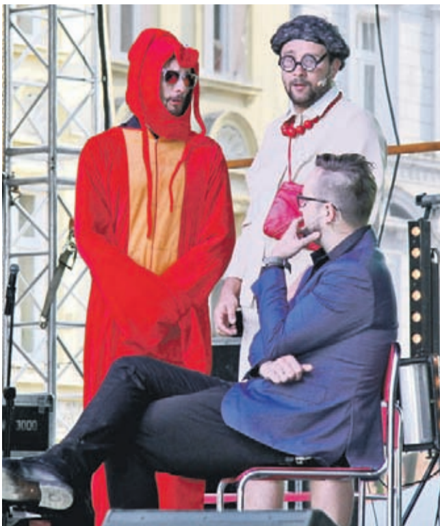
Podczas I Średzkiego Wieczoru Kabaretowego mieszkańców i gości rozbawiał m.in. Kabaret Skeczów Męczących.