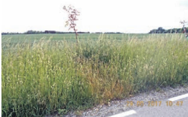
Zniszczone drzewa przy drodze na Ogrodnice.

- Korony drzew oraz trawa pod nimi są wyraźnie żółto-brązowe, wysychają. Widać, że ktoś zrobił to umyślnie, prawdopodobnie kilka dni temu. Wystąpiliśmy już