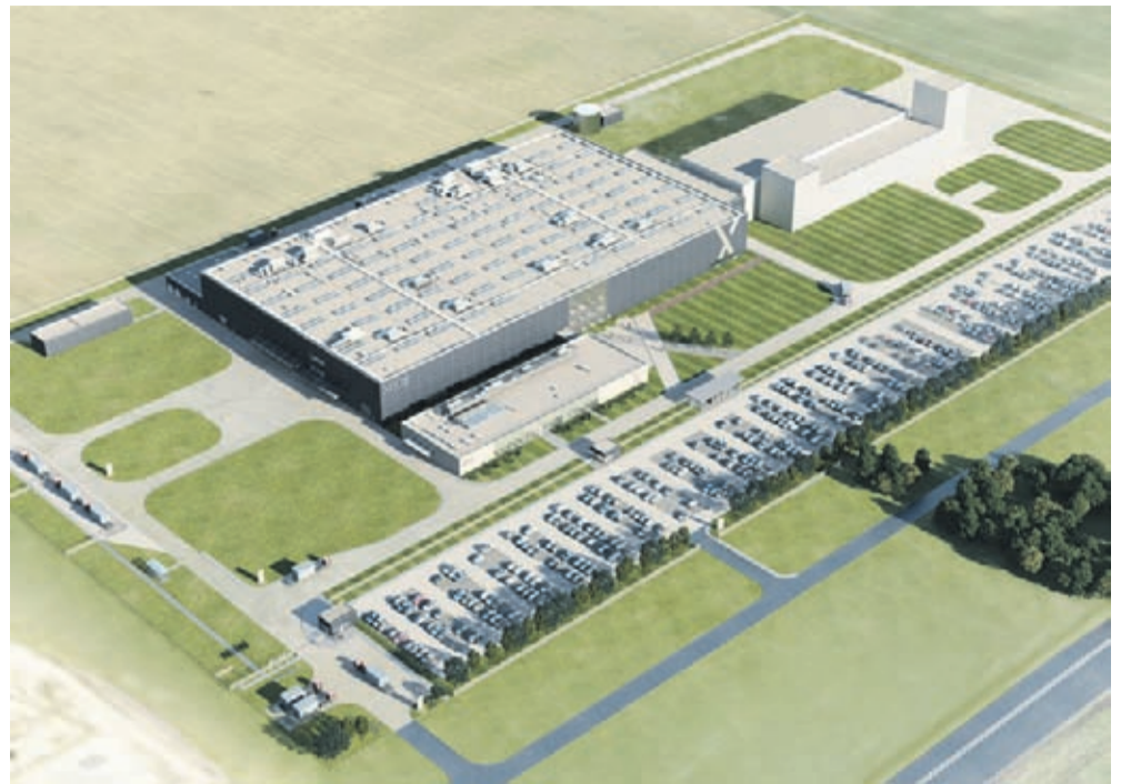
Wizualizacja centrum serwisowania i naprawy silników lotniczych XEOS.

Samorządowe Kolegium Odwoławcze we Wrocławiu 16 maja utrzymało w mocy decyzję Burmistrza Środy Śląskiej z 8 marca br., ustalającą na rzecz spółki XEOS środowiskowe uwarunkowania dla inwestycji budowy centrum serwisowania i naprawy silników lotniczych w podstrefie Legnickiej Specjalnej Strefy Ekonomicznej w gminie Środa Śląska.