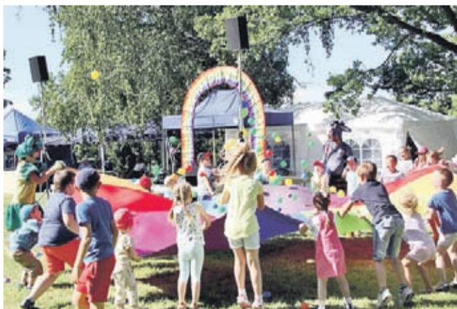
Najmłodszy chętnie bawili się z przebranymi za bajkowe postacie animatorami.