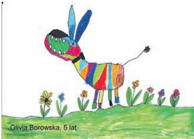
Olivia Borowska, 5 lat

Olivia Borowska - 5 lat, Pracownia Artystyczna „Na Piętrze” Natan Stremiecki - 7 lat, Przedszkole nr 3 w Środzie Śląskiej Wiktor Wójcik - 6 lat, Miękinia