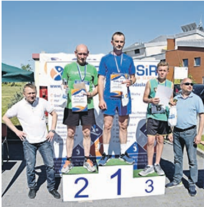
Zwycięzcy Biegu Przelajowego w kategorii OPEN mężczyzn.

W imieniu organizatorów dziękujemy wszystkim oso-