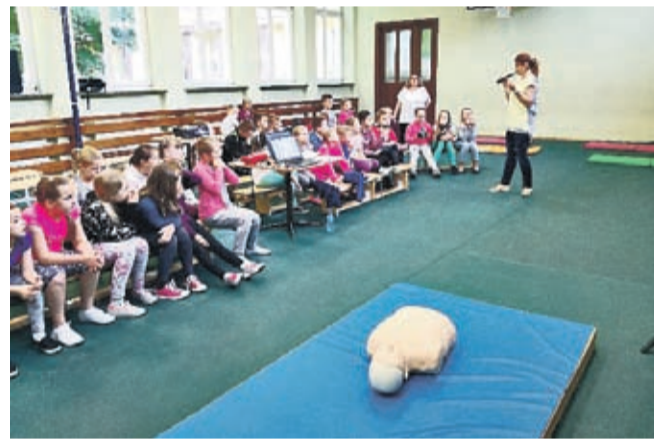
wykonać wszystkie ćwiczenia w udzielaniu pierwszej pomocy przedmedycznej pod okiem prowadzących zajęcia.

Zajęcia przeprowadzone we wszystkich klasach zostały bardzo dobrze ocenione przez wychowawców klas i przez same dzieci. Szczególnie zadowolone były dzieci klas trzecich, ponieważ każdy uczeń mógł