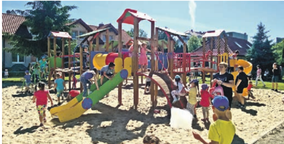
Dzieci chętnie korzystają z nowego placu zabaw.

Przy Przedszkolu Publicznym nr 1 w Środzie Śląskiej otwarto 1 czerwca nowy plac zabaw. Burmistrz Środy Śląskiej – Adam Ruciński wraz z wychowankami przedszkola przy ul. Strzeleckiej uroczą przecieli wstęgę. Radościom i zabawom nie było końca, zwłaszcza że otwarcie połączone z obchodami Dnia Dziecka.