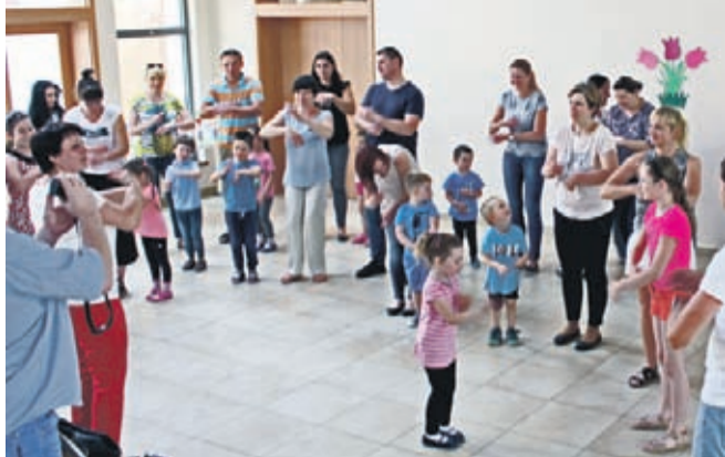
Podczas Dnia Rodziny dzieci bawiły się i tańczyły wspólnie z rodzicami.

Dla czwórki żłobkowiczów „Dzień rodziny” był również zakończeniem roku, gdyż od wrze-