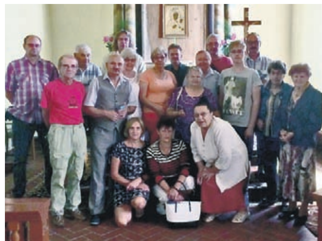
Podczas zjazdu 3 czerwca br. spotkali się byli i obecni mieszkańcy oraz ich wnukowie.