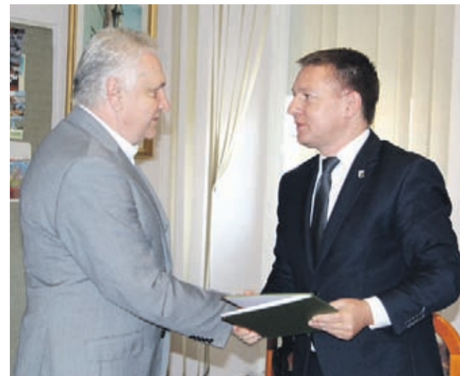
Umowa z firmą Tauron Dystrybucja S.A. obowiązuje od początku czerwca br.

Wśród kluczowych zadań, do których zobowiązał się Tauron znalazły się przede wszystkim obsługa łącznie 1912 szt. lamp oświetleniowych, ich przeglądy, serwisowanie oraz usuwanie usterek i awarii. Co istotne, umowa określa czas, w jakim Tauron ma zareagować na zgłoszenie i naprawić awarię lub usterkę. Bardzo ważnym elementem całego kontraktu jest również modernizacja istniejącego oświetlenia ulicznego, na którą przeznaczono w umowie ponad 610 tys. zł. Wykonawca ma sukcesywnie wymieniać istniejące oświetlenie sodowe na stosowane już standardowo w Gminie oświetlenie typu LED oraz dowieszać lampy na sieciach skojarzonych.