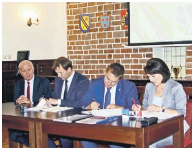
Podpisanie umowy z lublińską spółką Ursus Bus S.A.

Polska spółka Ursus Bus z Lublina jeszcze w tym roku dostarczy Gminie Środa Śląska 3 autobusy klasy midi o napędzie elektrycznym o wartości blisko 6,5 mln zł. Takiego kroku w stronę elektromobilności nie postawiło dotąd żadne polskie miasto tej wielkości.