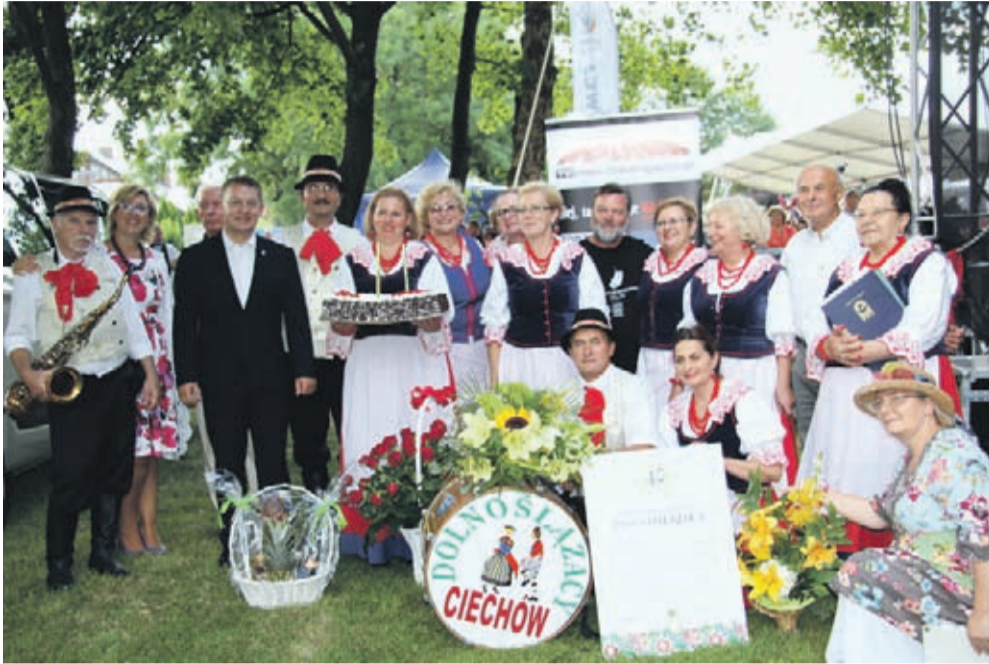
Dolnoślązacy w pełnej krasie.

Na terenie zielonym przy akwenu Kajaki w Środzie Śląskiej w niedzielę, 23 lipca, zabrzmiała muzyka z 4 stron świata. Festiwal Kultury Ludowej, który integruje tradycje ludowe, folkowe z lokalnym społeczeństwem, już po raz szósty odbył się w Mieście Skarbów.