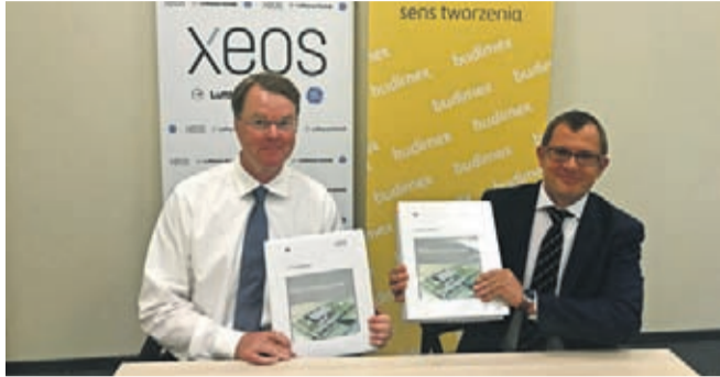
Podpisanie kontraktu z Budimexem 31.07.2017

Prace ruszyły w pierwszym tygodniu sierpnia. Na terenie inwestycji odbyła się już wewnętrzna uroczystość wbicia pierwszej łopaty. Oficjalne wmurowanie kamienia węgielnego z zaplanowane jest na koniec września.