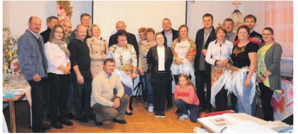
Fot. MIECZKÓW - zwycięzca II edycji

Już po raz trzeci Powiat organizuje konkursu „Nasza wieś ma się czym pochwalić”. Twoja wioska jest aktywna, dba o tradycje i porządek? Koniecznie weź udział w zabawie!