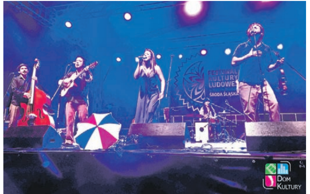
Koncert zespołu MiraMundo uwieńczył tegoroczny Festiwal Kultury Ludowej.

- Od wielu lat jestem pod wrażeniem tego, co robią Dolnoślązacy. Ten piękny jubileusz to dowód na to, że pomysł był wspaniały, a jego realizacja przez 40 lat wyjątkowo ambitna i radosna. Chciałbym pogratulować Wam Drodzy Dolnoślązacy tego wszystkiego co zrobiliście przez te dziesiątki lat, krzawiąc tradycje