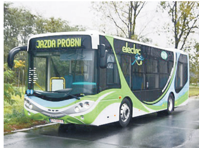
Ursus City Smile 10m – takie autobusy pojawią się w gminie Środa Śląska.

– Środa Śląska robi bardzo ważny, pierwszy taki krok w Polsce. Pojazdy elektryczne stają się coraz bardziej popularne, ale przede wszystkim są przyjazne środowisku, są tanie w eksploatacji i mają niską awaryjność. Gratuluję Państwu tego przełomowego kroku i cieszę się, że został on postawiony na Dolnym Śląsku, ponieważ otwiera to możliwość prowadze-