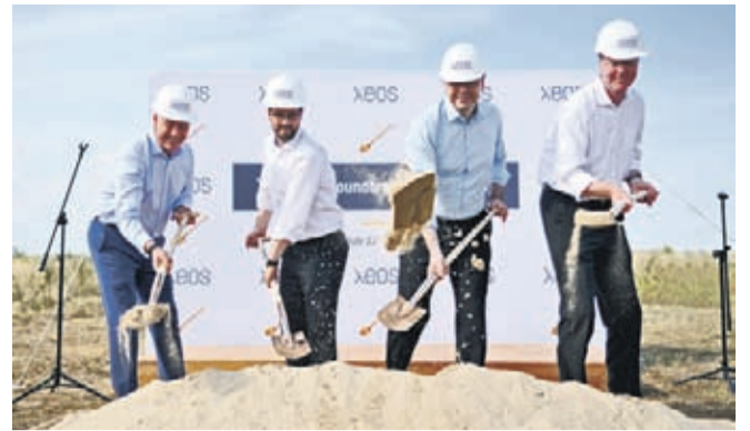
Uroczystość Wbicia Pierwszej Łopaty 22.07.2017

Głównym przeznaczeniem zakładu będzie serwisowanie silników typu GENx-2B, a w kolejnych latach również typu GE9X. Aktualnie w komercyjnym użyciu przez 18 operatorów lotniczych na całym świecie jest prawie 500 silników GENx-2B, które wylatały już w sumie 5 mln godzin, osiągając świetne wyniki