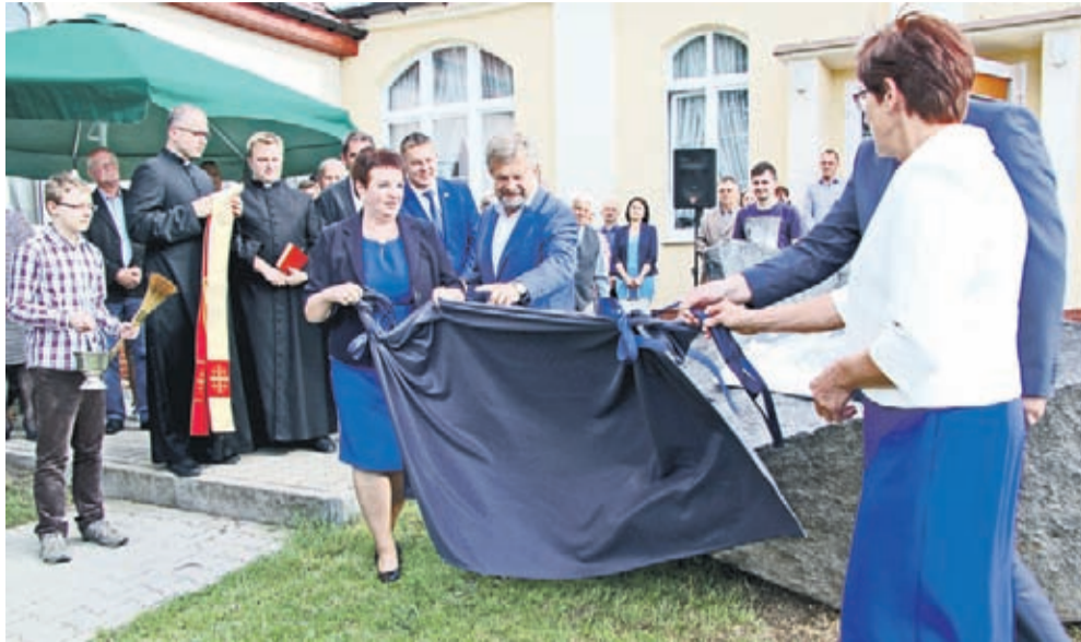
Poświęcenie i odsłonięcie tablicy pamiątkowej w Rzeczycy.