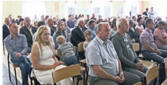
Mieszkańcy licznie uczestniczyli w obchodach i wspominali wydarzenia sprzed 20 lat.