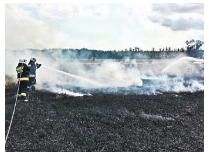
2 sierpnia około godziny 15:00 strażacy OSP Miękinia zostali wezwani do pożaru ścierniska w miejscowości Zabór Wielki. Oprócz zastępu tej jednostki, w akcji uczestniczył zastęp z OSP Głóska i JRG Środa Śląska.