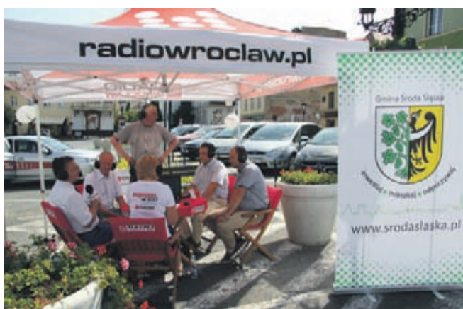
Studio Radia Wrocław w śródkiem rynku.

Ostatni w sezonie letnim wyjazdowy czwartek ekipa Radia Wrocław spędziła w Środzie Śląskiej. Program prowadzony był na żywo z plenerowego studia przy pomniku Rolanda.