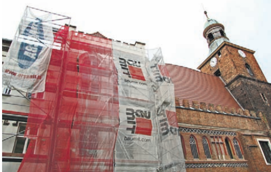
Obecnie prowadzone są m.in. prace na północnej ścianie Ratusza.

W projekcie ujęto także doposażenie Muzeum Regionalnego m.in. w nowoczesny system wystawienniczy i bezprzewodowy system dźwiękowego przewodnika. Rewaloryzacja już ruszyła – aktualnie firma StarCorp S.A., wykonawca inwestycji, prowadzi prace przy izolacji poziomej i pionowej oraz odwodnieniu budynku. Prace zaplanowano do końca sierpnia 2018 r.