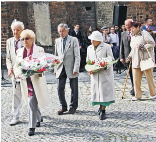
Członkowie Związku Sybiraków w Środzie Śląskiej składają kwiaty przy pamiątkowej tablicy.