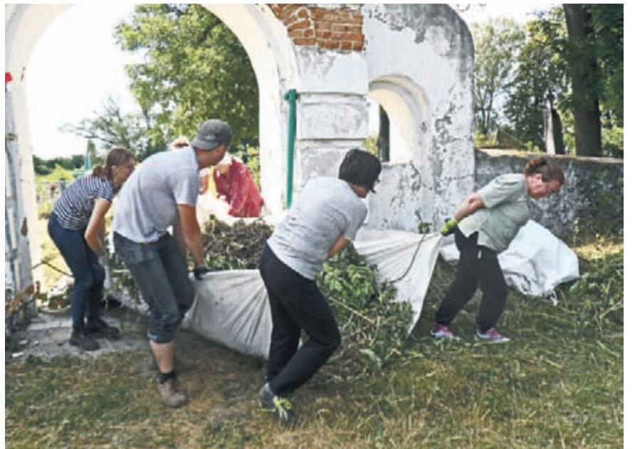
Prace na cmentarzu w Machnówce nie należały do łatwych.

ORGANIZATORZY AKCJI „MOGILĘ PRADZIADA...” W ŚRODZIE ŚLĄSKIEJ