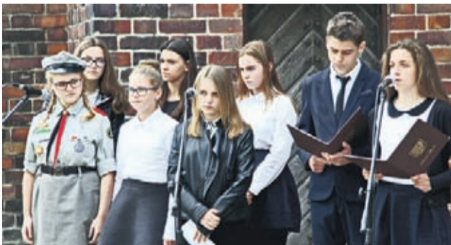
Część artystyczną przygotowali uczniowie Szkoły Podstawowej w Rakoszycach.

Przedstawiciele związków, władz samorządowych oraz lokalnych instytucji, placówek oświatowych i harcerzy tradycyjnie złożyli kwiaty przy tablicy upamiętniającej Sybiraków. Uroczystość została zorganizowana przez Gminę Środa Śląska we współpracy z Prezesem średzkiego oddziału Związku Sybiraków i Domem Kultury w Środzie Śląskiej.