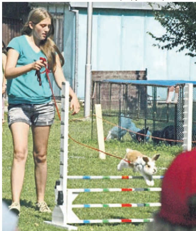
Króliczy „hop”.

lickiej. Właśnie w ten tydzień muszę tam zajrzeć choćby na kilka godzin. I tak już od pięciu lat, bo właśnie piąta rocznica podpisania umowy o partnerskiej współpracy gminy Sztiepanow z gminą Środa Śląska minęła przed kilkoma tygodniami.