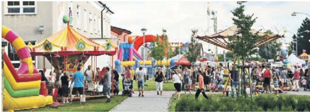
W Sztiepanowie na deptaku.

Lubię też wracać do niewielkiego, nieco ponad trzytysięcznego Sztiepanowa położonego tuż obok ponad stutysięcznego Ołomuńca (Czechy).