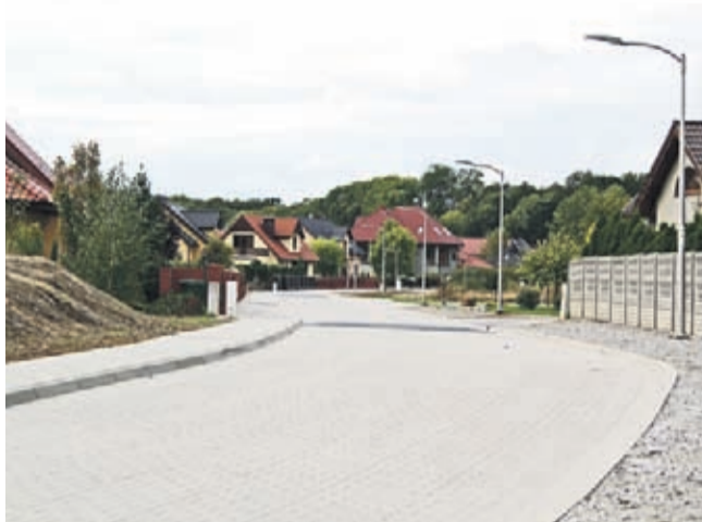
Widok na nową nawierzchnię ul. Konwaliowej w Środzie Śląskiej.

Blisko 660 metrów nowej nawierzchni wybudowano w ramach inwestycji prowadzonej od lipca br. na Osiedlu Zachodnim w Środzie Śląskiej.