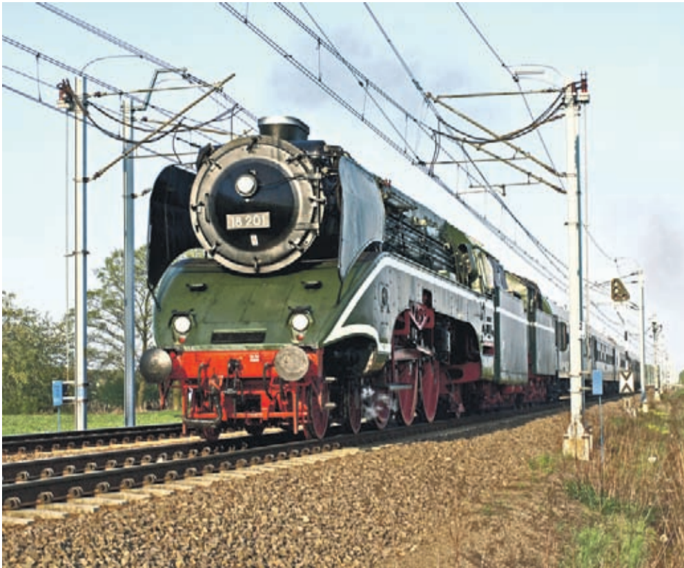
Linia kolejowa pod Środą Śląską i niemiecki, najszybszy czynny zabytkowy parowóz na świecie: DR 18 201.

W siłę i wszechstronność internetowych serwisów i wyszukiwarek nie wątpi chyba żaden użytkownik sieci. Ilość stron - wynik wyszukiwania wpisanego hasła - często może przyprawić o zawrót głowy. Nie inaczej jest w przypadku Środy Śląskiej.