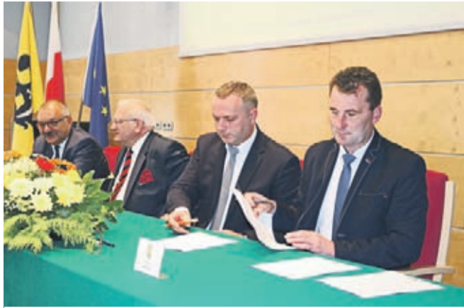
29 września podpisano list intencyjny odnośnie realizacji projektu „Zintegrowani”

Projekt partnerski realizowany przez szesnaście powiatów oraz samorząd Województwa Dolnośląskiego. W naszym powiecie bierze w nim udział 112 uczniów z PZSP nr 1 i PZSP nr 2 kształcących się w zawodach deficytowych tj. technik informatyk, technik elektryk, technik logistyk i technik spedytor. Uczniowie uczestniczą w zajęciach laboratoryjnych na Politechnice Wrocławskiej, rozwijają swoje zainteresowania zawodowe w kołach zainteresowań oraz odbywają płatne staże u lokalnych pracodawców. Nauczyciele zawodu uczestniczą w warsztatach metodycznych prowadzonych przez DODN oraz politechnikę. W ramach projektu kupiono już projektor multimedialny, notebook, drukarkę laserową, słuchawki i dysk zewnętrzny. W planach jest doposażenie pracowni kształce-