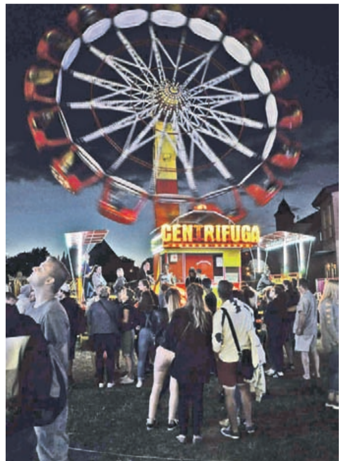
W piątek i sobotę Gody trwają do późnego wieczora.

Udana impreza to jednak przede wszystkim ludzie, a więc np. artyści na scenie. Tym razem są to po raz kolejny niekwestionowani ambasadorowie hanackiej kultury i tradycji - kilkupokoleniowy zespół folklorystyczny Hagnozek, znany i średniej publiczności. Im bliżej wieczoru, tym gwiazd więcej. Występują filary nie tylko czeskiej, ale też