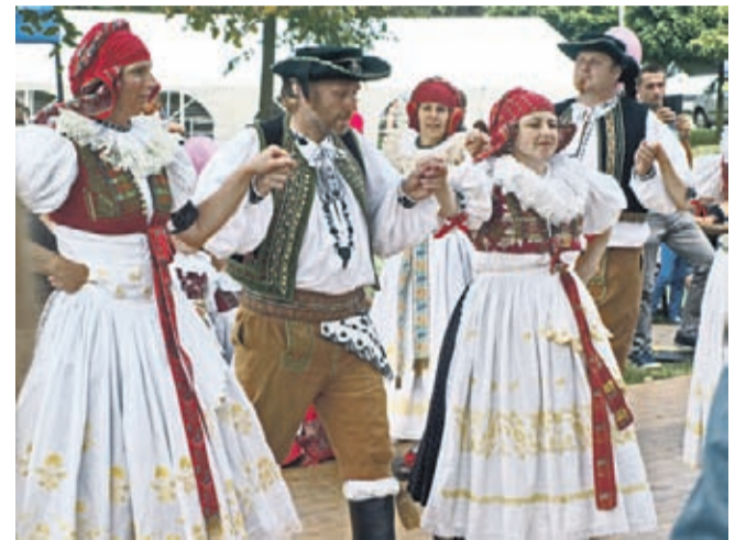
Hagnozek – starsi. (fot. J.Leginowicz)

Każdy, kto choćby na chwilę odwiedził Sztiepanow 11-13 sierpnia potwierdzi, że było warto, a kto nie był, niech żałuje. (J.Leginowicz)