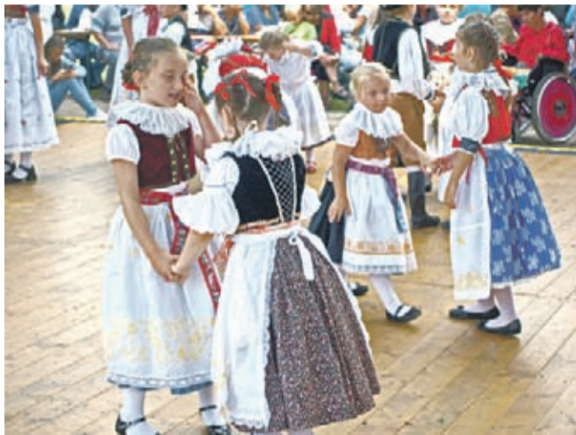
Hagnozek – młodszy.

W połowie sierpnia ze szczęścia szaleją łowcy Perseidów. Pewien rodzaj szaleństwa udziela się i mnie, szczególnie im bliżej do 10 tego miesiąca. 10 sierpnia wypadają imieniny Wawrzyńca. W tydzień najbliższy tej dacie Sztiepanow przez trzy dni świętuje Gody św. Wawrzyńca, patrona tamtejszej parafii rzymskokato-