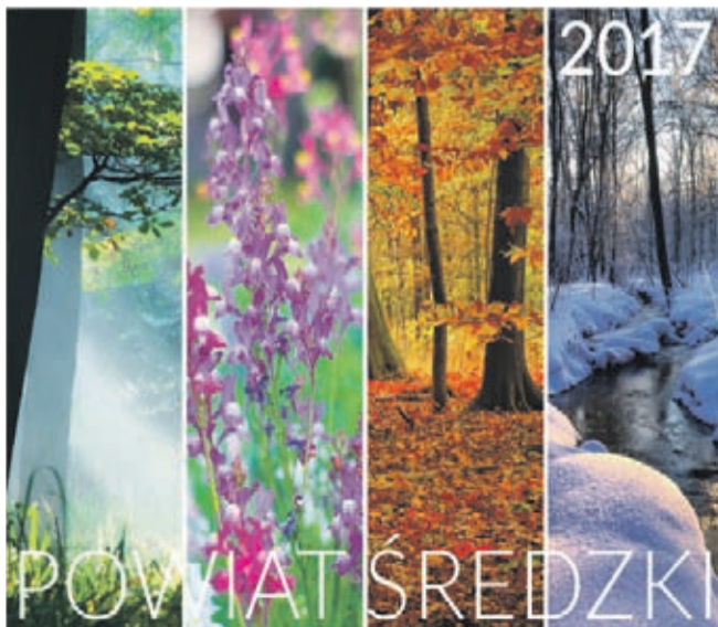
Kalendarz Powiatu na 2017 rok ozdobiły zdjęcia Krzysztofa Bednarczyka z Ciechowa