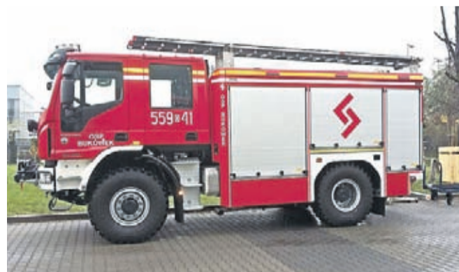
17 listopada strażacy ochotnicy powitali w Bukówku długo oczekiwany nowy samochód ratowniczo-gaśniczy IVECO Eurocargo 4x4.