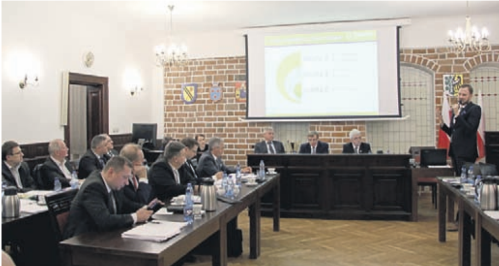
Prezentacja proponowanych taryf w ramach gminnej komunikacji autobusowej.

Kolejne ważne kroki na drodze do uruchomienia gminnej komunikacji autobusowej zostały wykonane na sesji Rady Miejskiej 29 listopada. Radni zaakceptowali taryfy gminnej komunikacji autobusowej przedstawione przez Burmistrza Adama Rucińskiego, a przygotowane przez firmę doradczą TRAKO na bazie porównań z innymi gminami w Polsce np. Brzesko, Nysa, Oława, Sandomierz, Wodzisław Śl. czy Pułtusk.