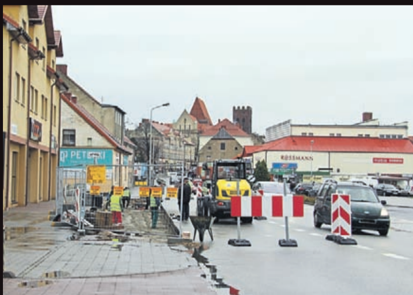
Budowa peronu autobusowego przy ul. Legnickiej w Środzie Śląskiej. Wykonawca: firma Instalator ze Środy Śląskiej.