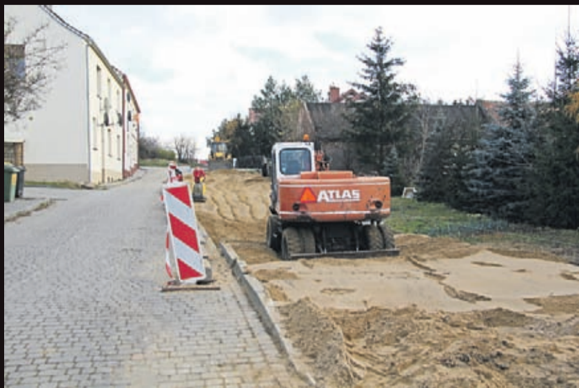
Przebudowa ul. Probusa w Środzie Śląskiej. Wykonawca: firma Instalator ze Środy Śląskiej.