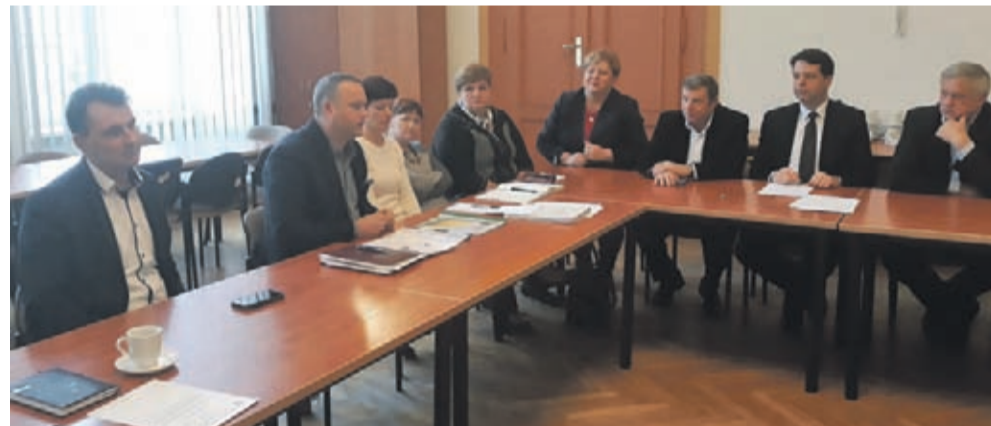
Kolejne spotkanie zaplanowano na 13 grudnia.

Wpływ uruchomienia komunikacji publicznej w gminie Środa Śląska na powiatową komunikację publiczną był tematem spotkania zorganizowanego 20 listopada w starostwie.