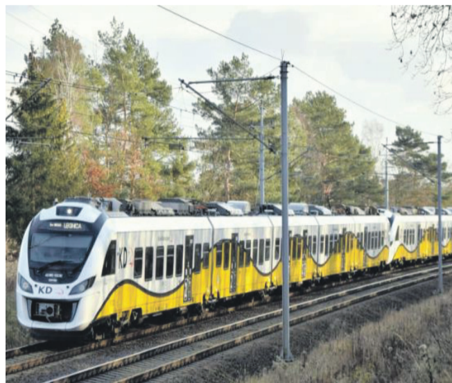
Impuls 45WE na trasie między Wrocławiem a Legnicą.

– Planujemy w przyszłości uruchomienie między miastami połączenia na zasadzie Regionalnego Expressu, który łączy je w trzydzieści minut. Nie stanie się to jednak jeszcze w tym