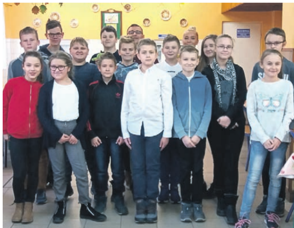
Uczestnicy śródzkiej edycji Ogólnopolskiego Konkursu „Orzeł informatyczny” wraz z nauczycielami-koordynatorami..

23 listopada w Szkole Podstawowej nr 3 w Środzie Śląskiej odbył się Ogólnopolski Konkurs „Orzeł informatyczny”.