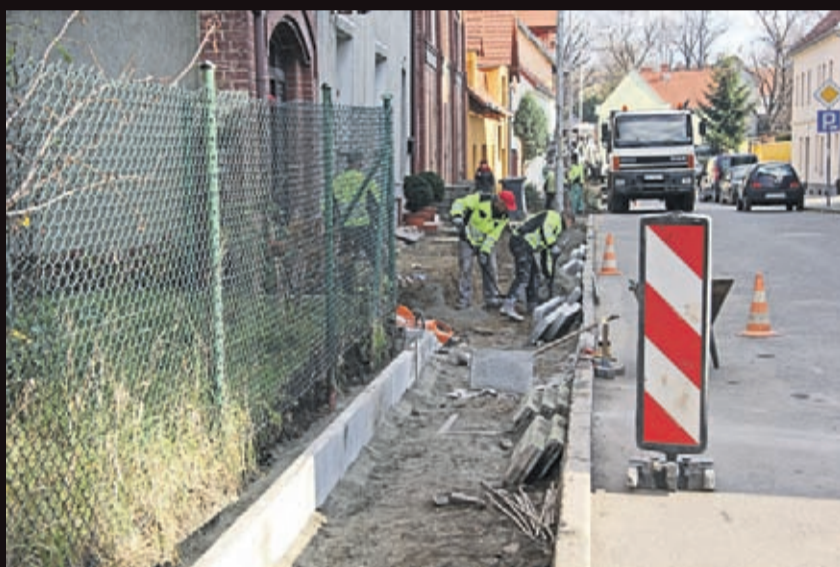
Budowa chodnika przy ul. Daszyńskiego w Środzie Śląskiej. Wykonawca: firma Hemis – Bis z Prochowic.