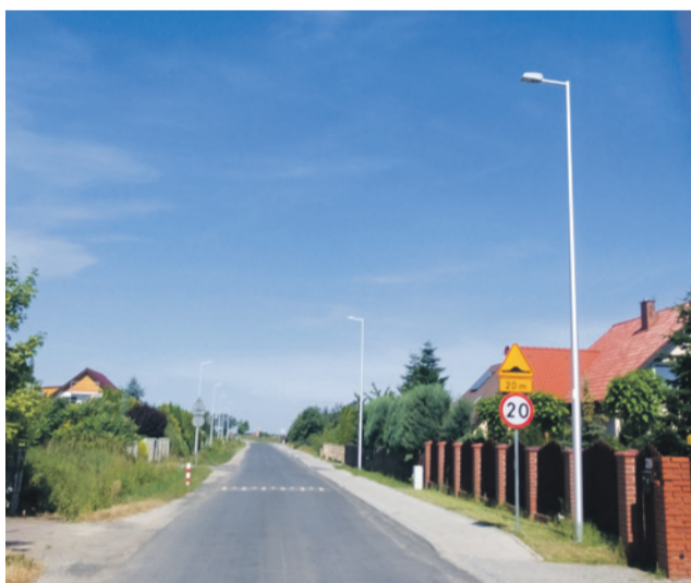
Łąkowa i Północna) i Lutyni (ulice Szkolna i Wiśniowa).

Warto przypomnieć, że tylko w 2017 r. nowe oświetlenie drogowe powstało w Brzezynie (ul. Kopernika, Lipowa, Dębowa, Działkowa), Mrozowie (ul. B. Chrobrego, Aleja Brzozowa, Jastrzębia, Orla, Myszołowa) i Żurawińcu (ul. Główna) oraz Wilkszynie (ulice: Kwiatowa, Chabrowa, Wiśniowogórska,