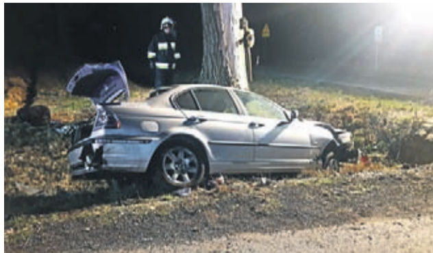
9 stycznia po godz. 22 na skrzyżowaniu, na wysokości miejscowości Łagiewniki i Pichorowice kierująca pojazdem marki BMW kobieta straciła panowanie nad samochodem. Auto wypadło z drogi do przydrożnego rowu. W tym zdarzeniu obyło się bez osób poszkodowanych.