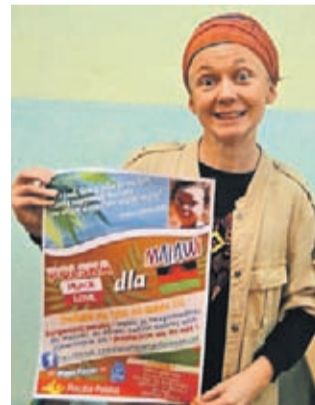
Zainteresowanych pomocą zachęcamy do odwiedzenia strony: tongaheritage.wixsite.com/thc2

Wykład składał się także z przedstawienia swojej roli jako opiekunki członków plemienia. Pokazała uczniom w jakich warunkach żyją ci ludzie oraz zachęciła ich do wspierania akcji, która ma na celu pomoc członkom plemienia oraz odmianę życia tamtejszych ludów za pomocą paczek z ubraniami i żywnością.