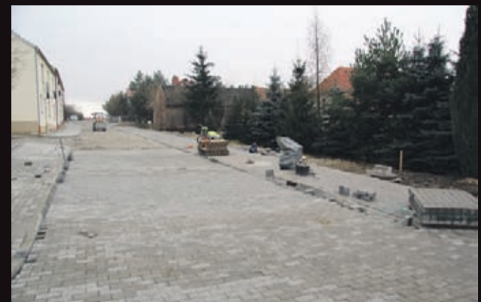
Przebudowa ul. Probusa w Środzie Śląskiej. Wykonawca: firma Instalator ze Środy Śląskiej.