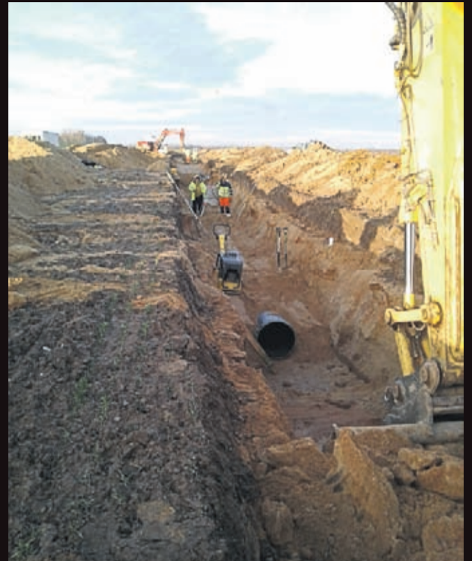
Budowa kanalizacji sanitarnej w podstrefie LSSE Komorniki Święte. Wykonawca: firma Globistic ze Strzelina.