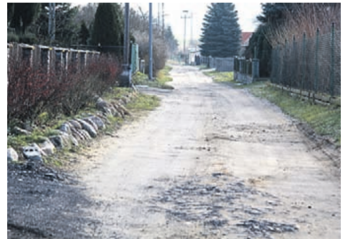
Ul. Słoneczna w Ciechowie

Firma STRABAG wykona do 15 maja trzy odcinki nawierzchni dróg: 260 metrowy odcinek ul. Słonecznej w Ciechowie (od ul. Średzkiej w sąsiedztwie ul. Spacerowej), łącznik drogowy przy przystanku w Chwalimierzu oraz dalszy ciąg drogi przy FCB w Chwalimierzu.