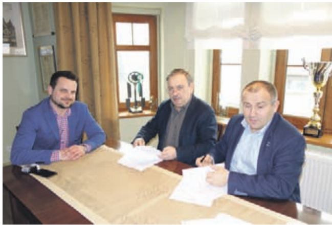
Jastrzębia, Orla, Myszołowia) i Żurawincu (ul. Główna) oraz Wilkszynie (ulice: Kwiatowa, Chabrowa, Wiśniowogórska, Łąkowa i Północna) i Lutyni (ulice Szkolna i Wiśniowa). [zdjęcie: podpisanie umowy na budowę oświetlenia]

Warto przypomnieć, że tylko w 2017 r. nowe oświetlenie drogowe powstało w Brzezynie (ul. Kopernika, Lipowa, Dębowa, Działkowa), Mrozowie (ul. B. Chrobrego, Aleja Brzozowa,