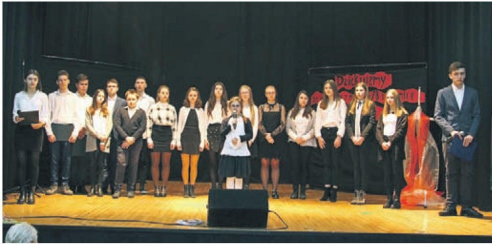
Na scenie średzkiego Domu Kultury program słowno-muzyczny poświęcony historii Sybiraków zaprezentowali uczniowie Szkoły Podstawowej nr 3 w Środzie Śląskiej.