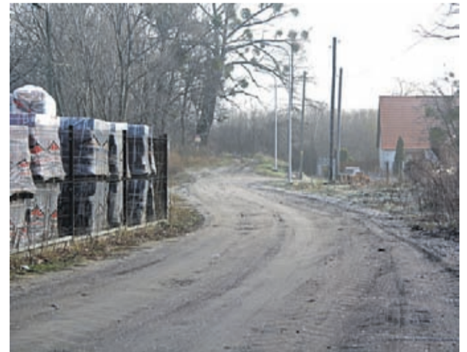
Droga przy FCB w Chwalimierzu

Prace ruszą w połowie marca, a ich łączny koszt to 380 tys. zł. Umowę w tej sprawie burmistrz