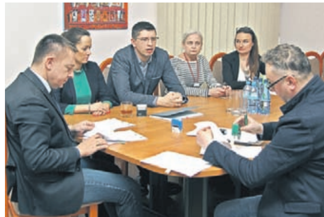
Podpisanie umowy na modernizację średzkiego targowiska.

Takich dotacji przyznano tylko 14 na całym Dolnym Śląsku.