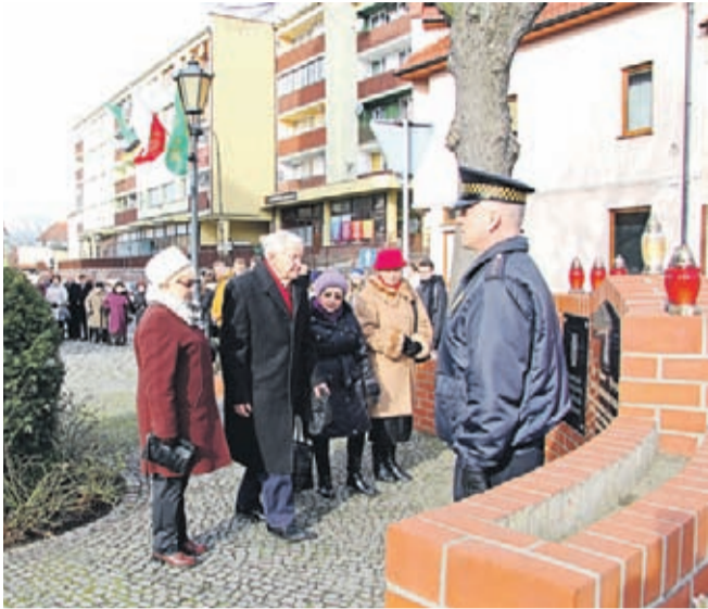
Delegacja Związku Sybiraków w Środzie Śląskiej składa kwiaty pod tablicą na Skwerze Zesłańców Sybiru.

W Środzie Śląskiej 12 lutego odbyły się uroczyste obchody 78. rocznicy I Masowej Deportacji Polaków na Sybir. Tę ważną rocznicę obchodzili wspólnie średzcy Sybiracy, zaproszeni goście oraz młodzież z tutejszych szkół.