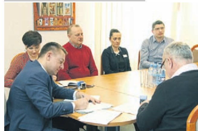
Podpisanie umowy na rewitalizację terenu przy świetlicy wiejskiej w Krynicy.

Nowoczesne i bezpieczne miejsce do rekreacji i aktywności sportowej powstanie przy świetlicy wiejskiej w Krynicy. 13 lutego w Urzędzie Miejskim podpisano umowę na ciąg dalszy rewitalizacji tego terenu, która rozpoczęła się w ub. roku.